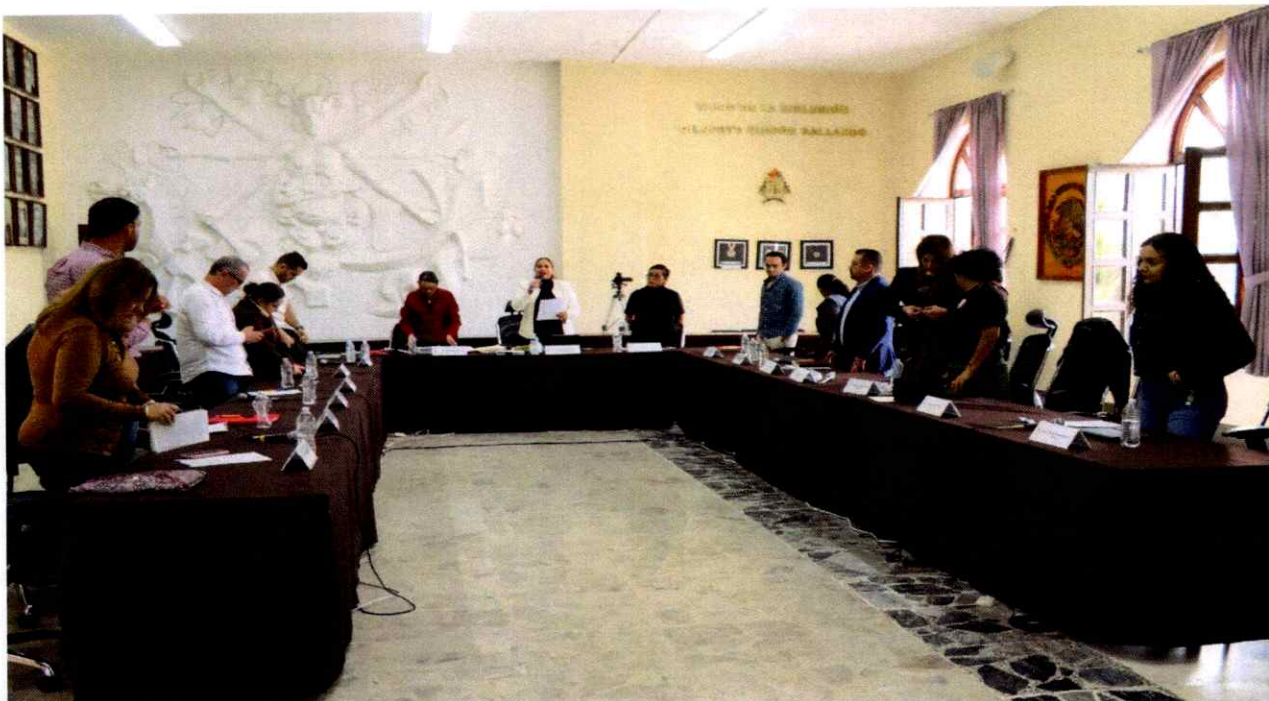
Sesión Extraordinaria No. 51.