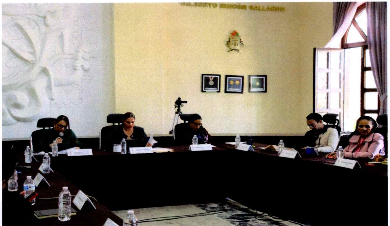
Sesión Extraordinaria No. 50.