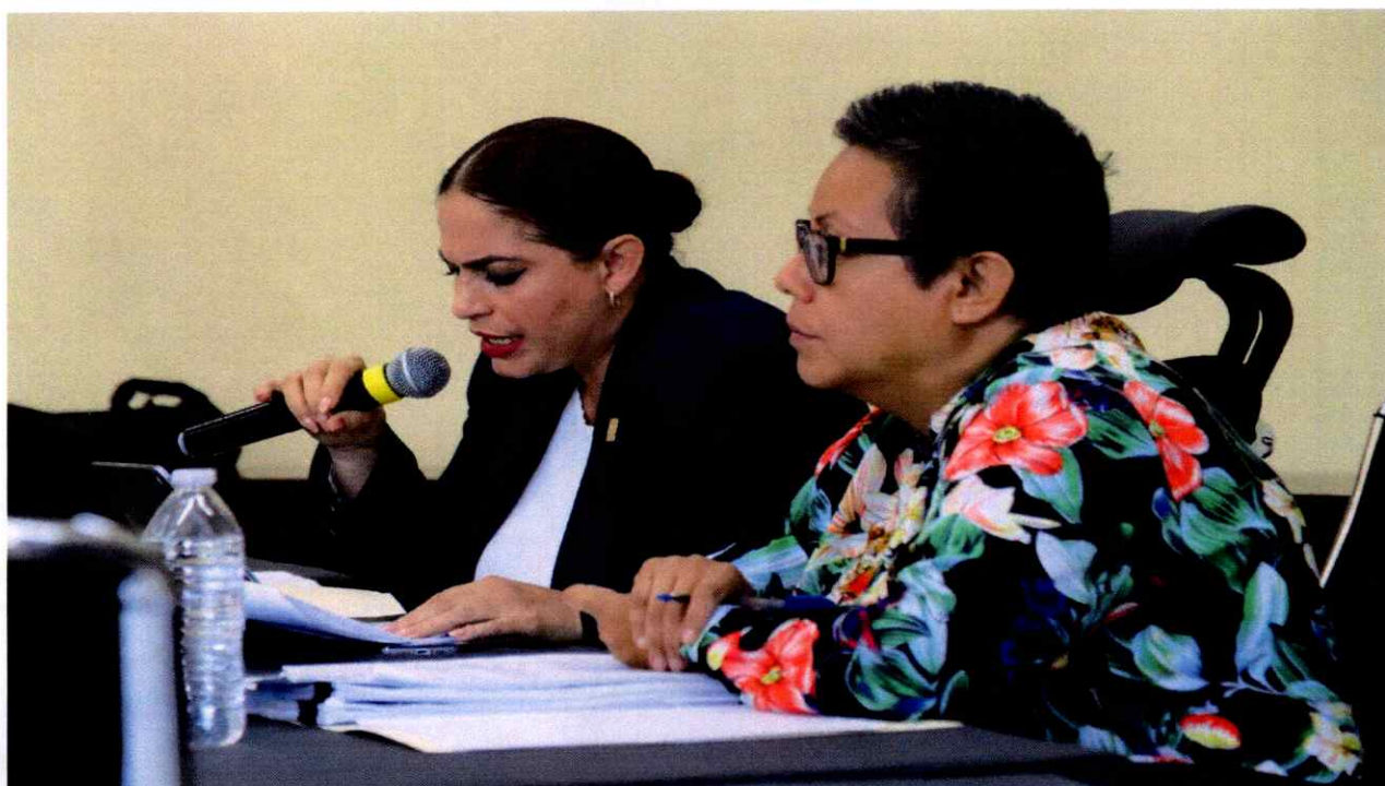
Sesión Extraordinaria No. 42.