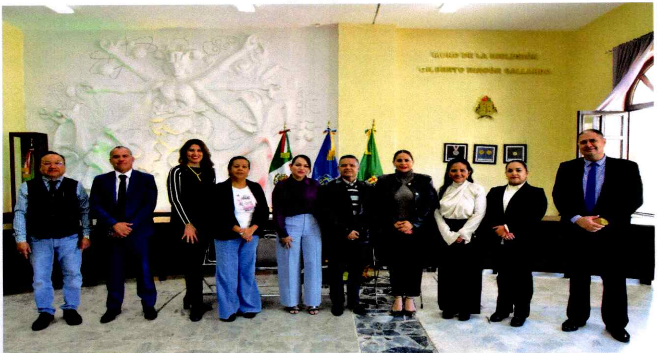
Sesión Solemne No. 18.