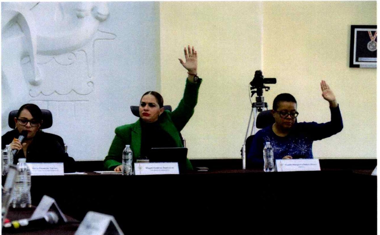
Sesión Ordinaria No. 21.