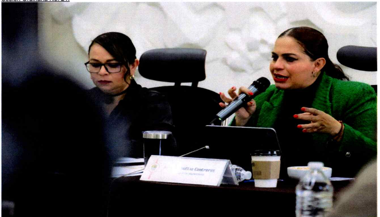
Sesión Ordinaria No. 21.