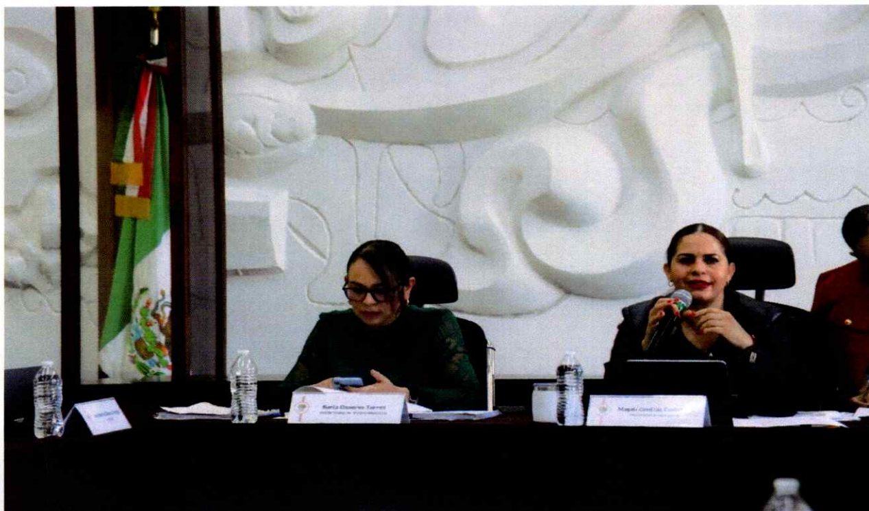
Sesión Extraordinaria No. 49.