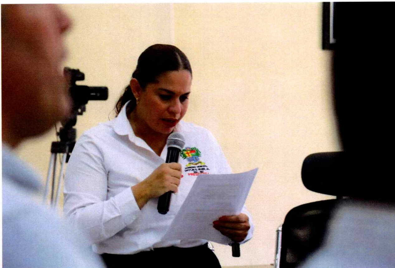
Sesión Extraordinaria de Ayuntamiento No. 44.