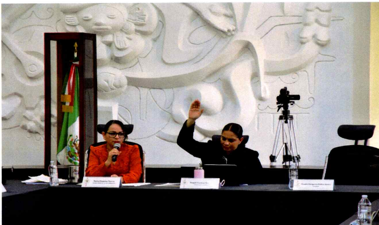
Sesión Extraordinaria No. 41.