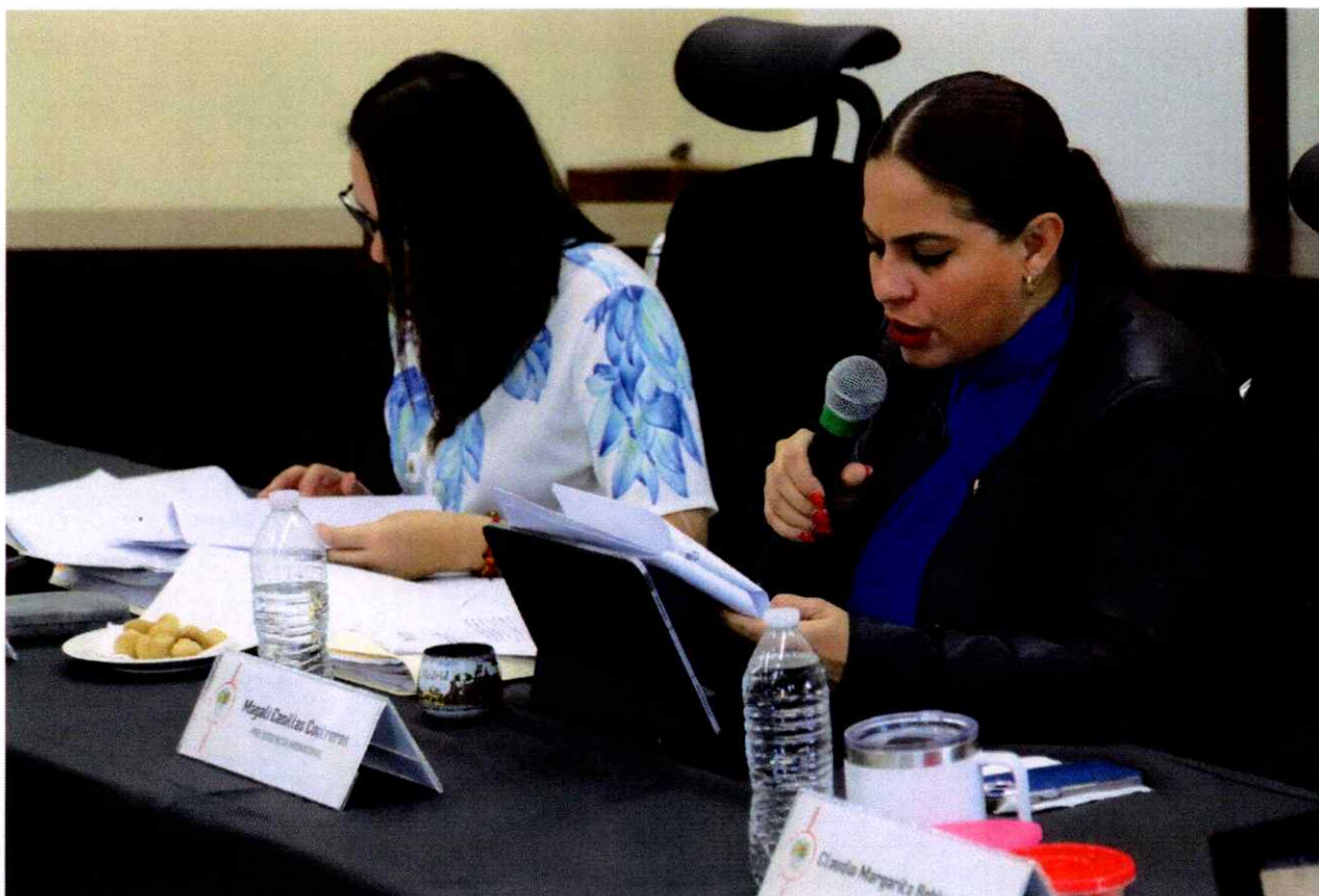
Sesión Ordinaria No. 18.