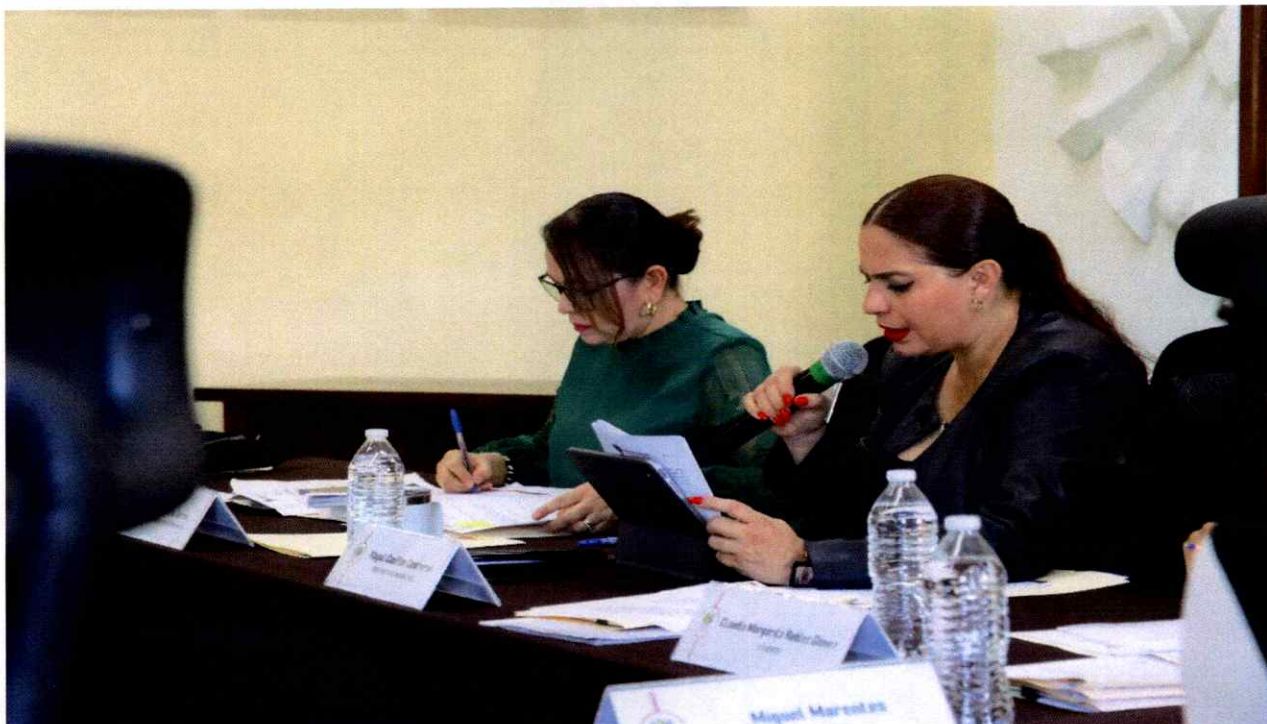
Sesión Extraordinaria No. 49.