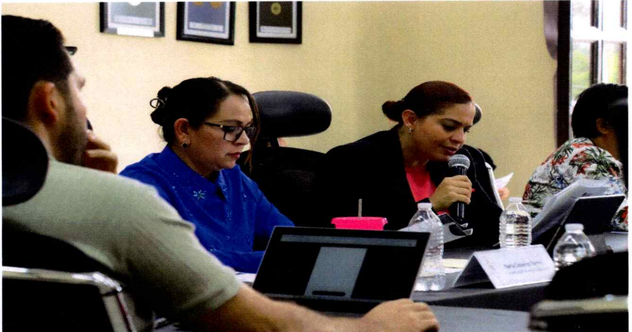
Sesión Extraordinaria No. 48.