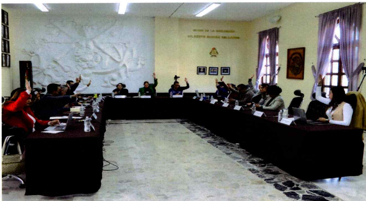
Sesión Ordinaria No. 21.