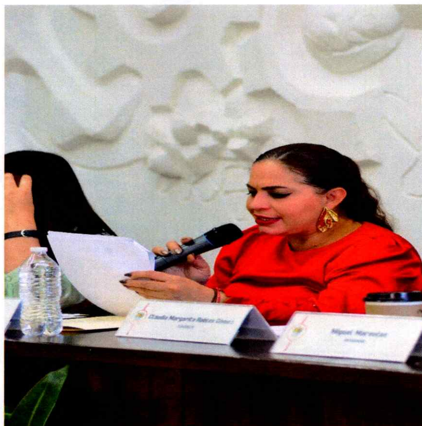
Sesión Extraordinaria No. 53.