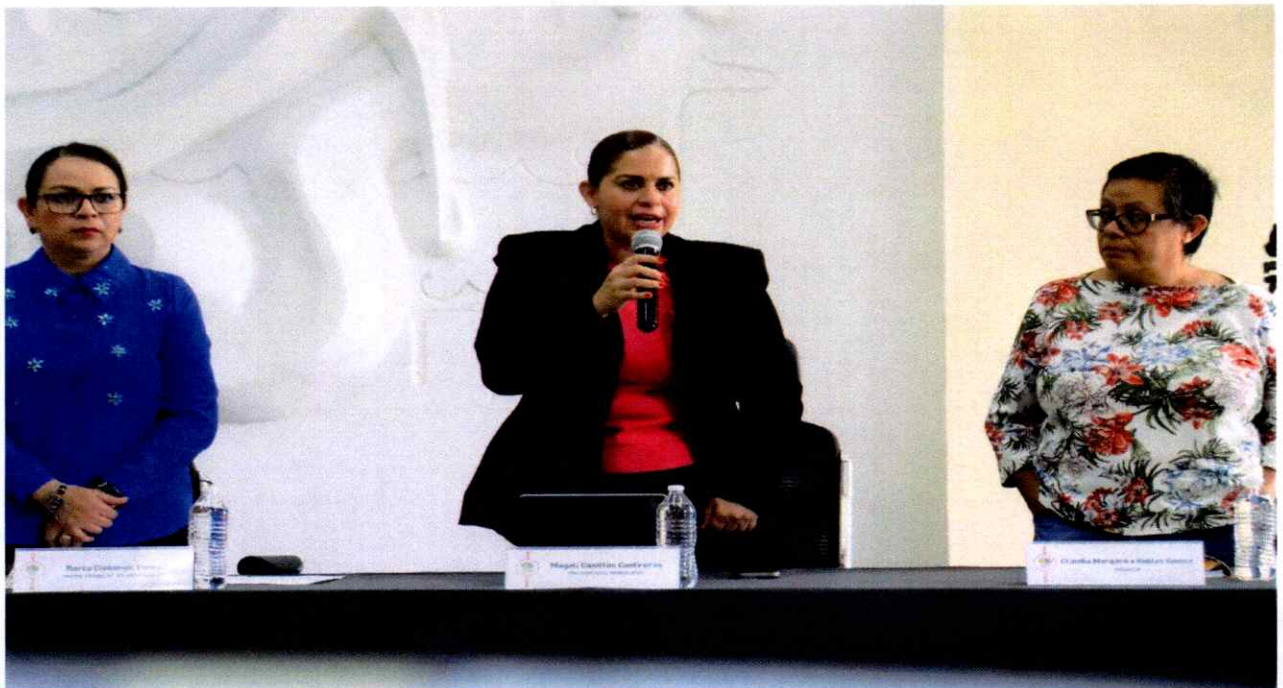
Sesión Extraordinaria No. 48.