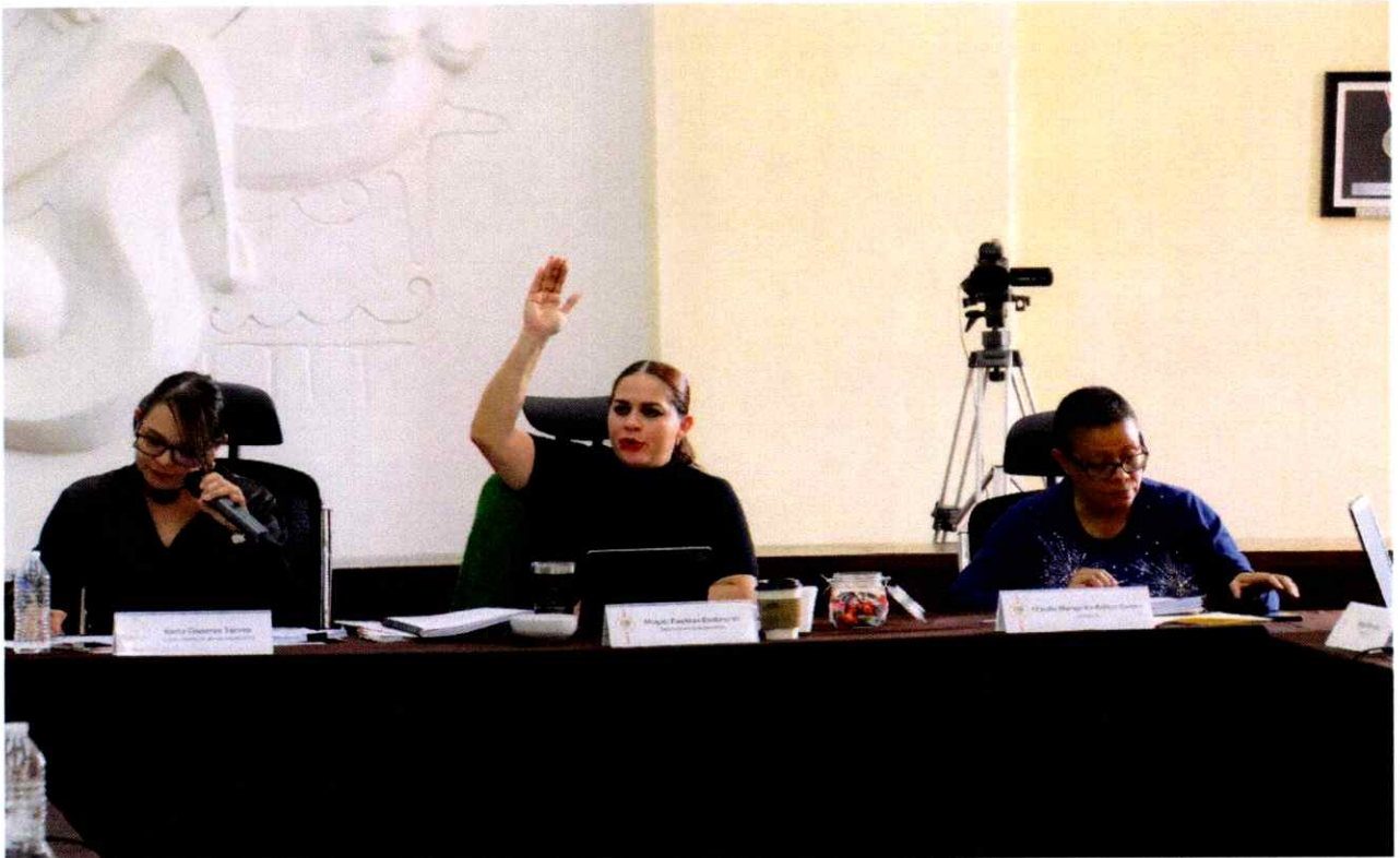
Sesión Extraordinaria No. 52.