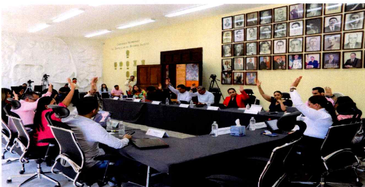
Sesión Extraordinaria de Ayuntamiento No. 44.