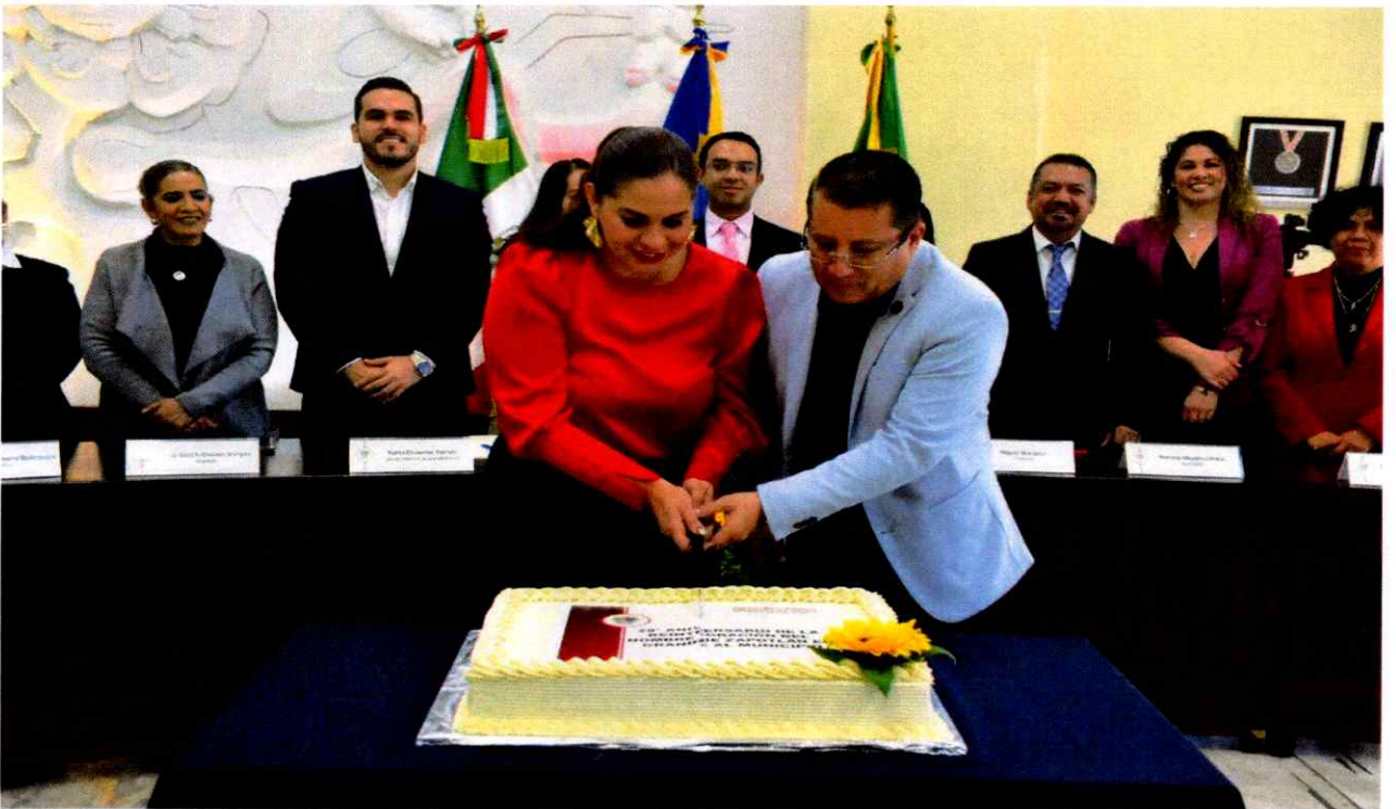
Sesión Solemne No. 19.