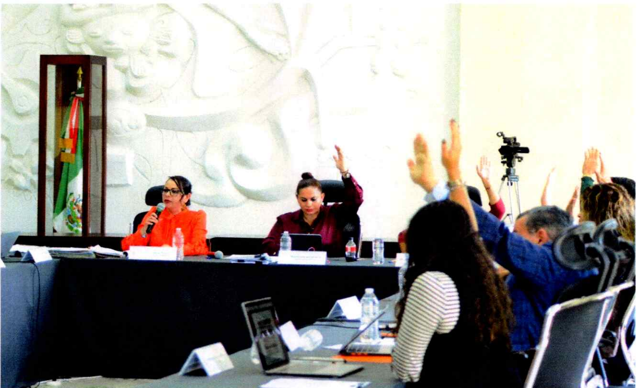
Sesión Extraordinaria No. 45.