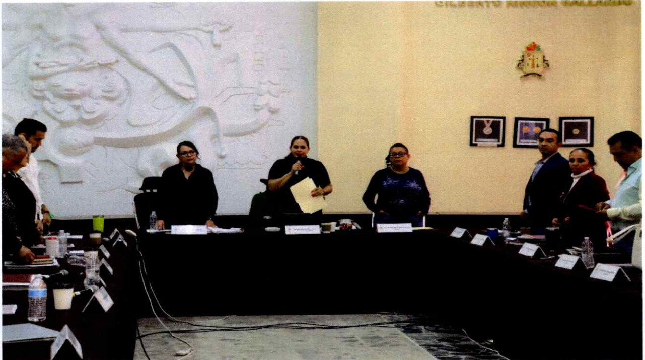
Sesión Extraordinaria No. 52.