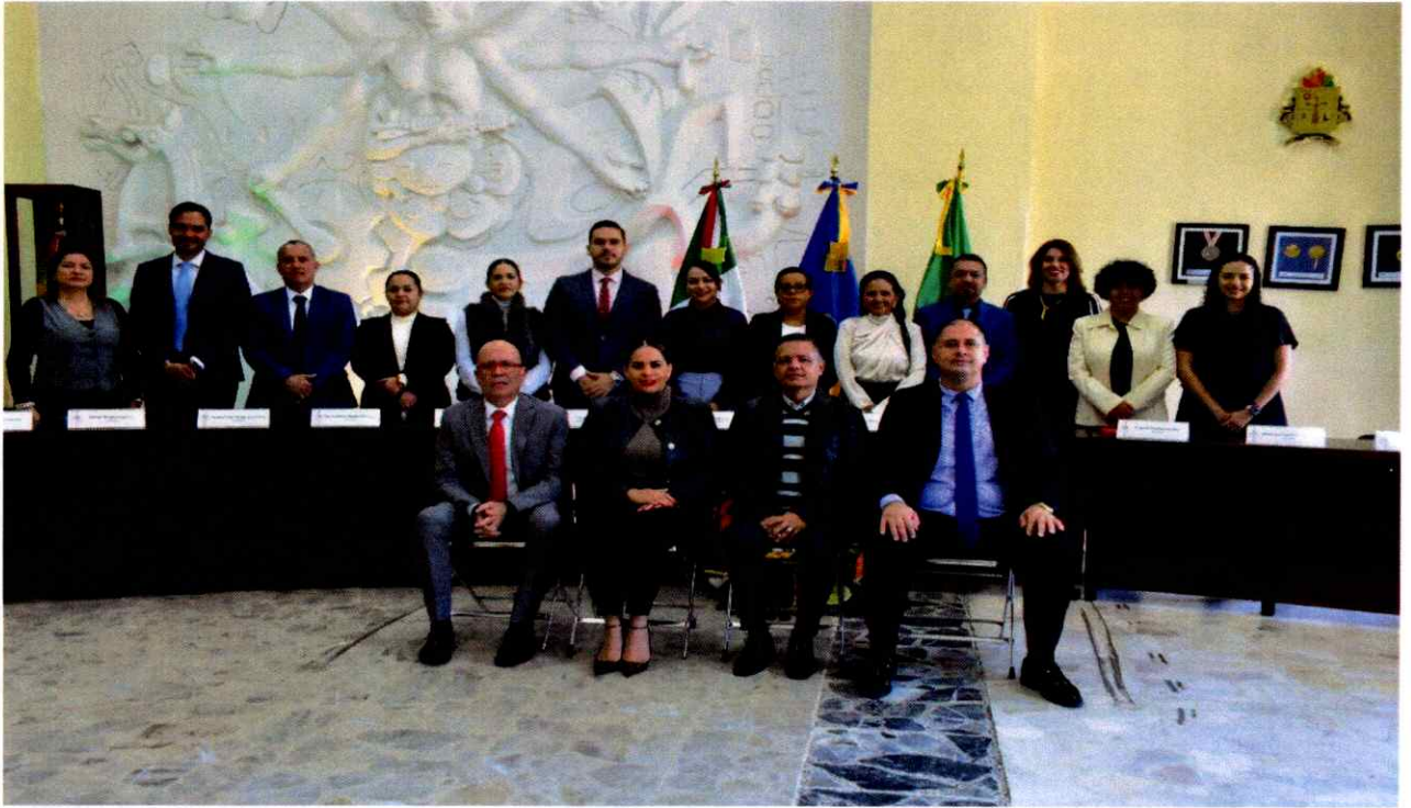
Sesión Solemne No. 18.