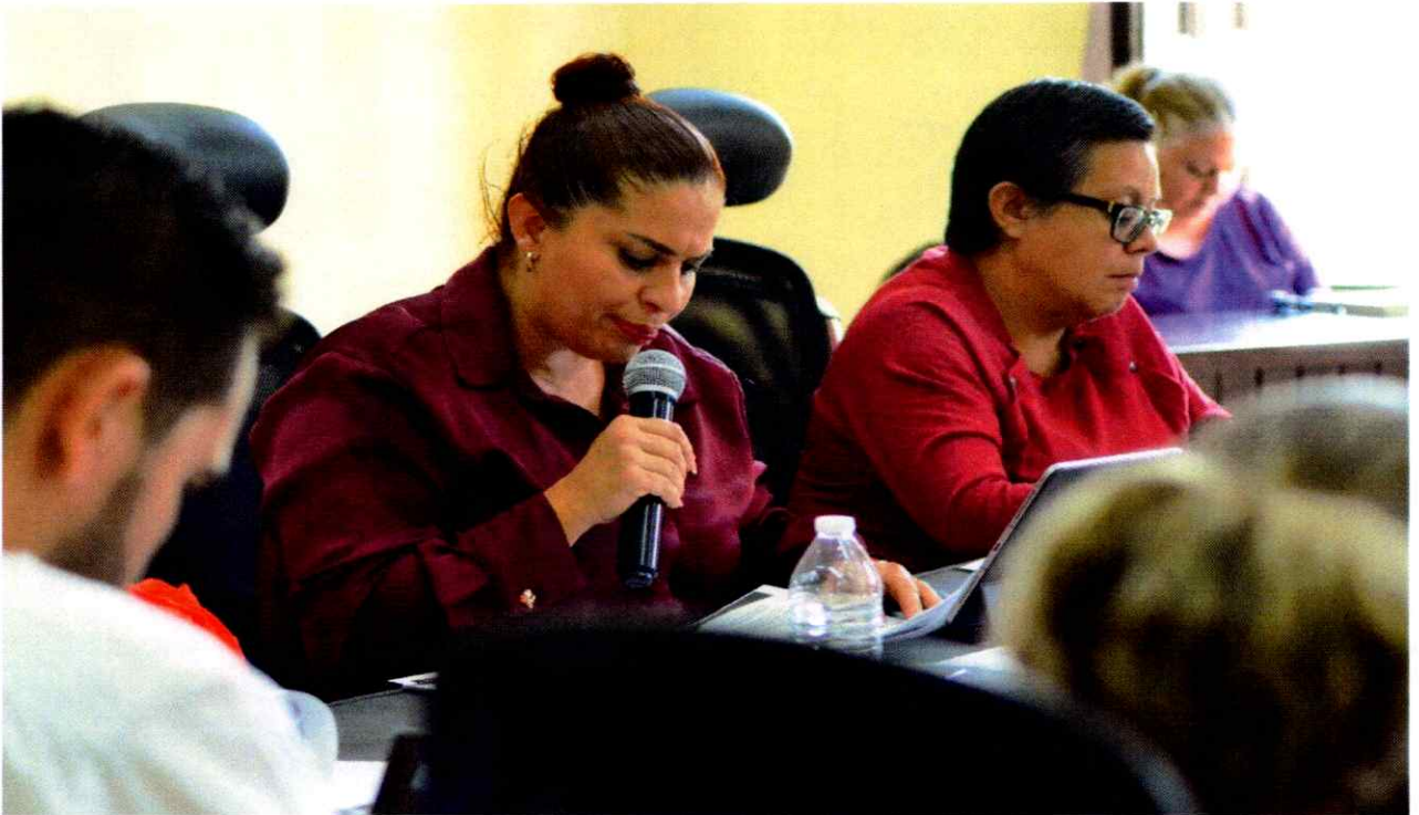
Sesión Extraordinaria No. 45.