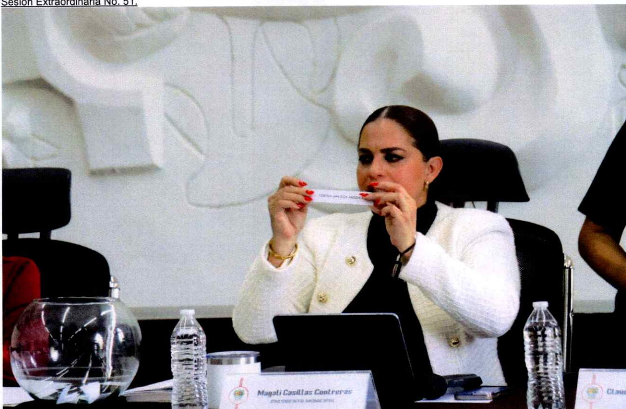
Sesión Extraordinaria No. 51