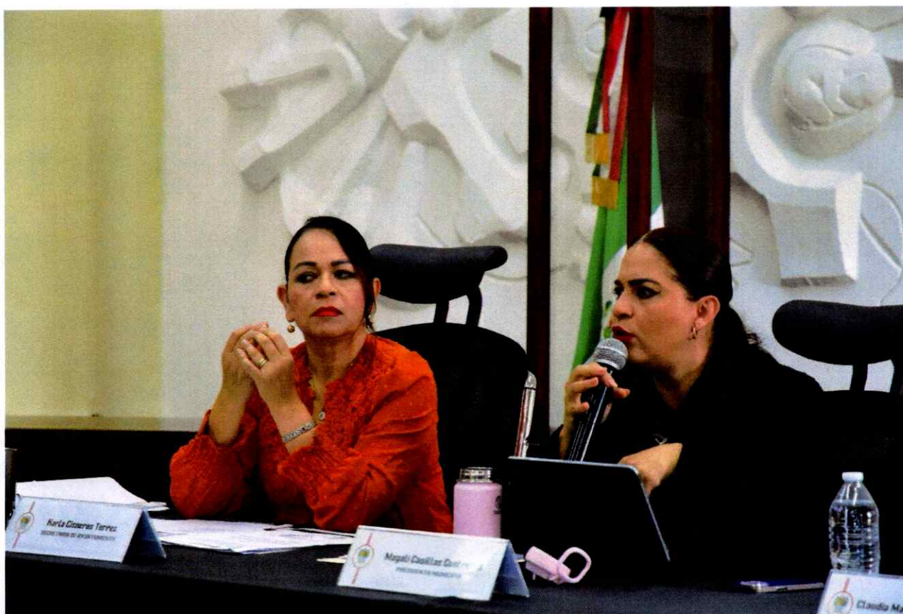
Sesión Extraordinaria No. 41.