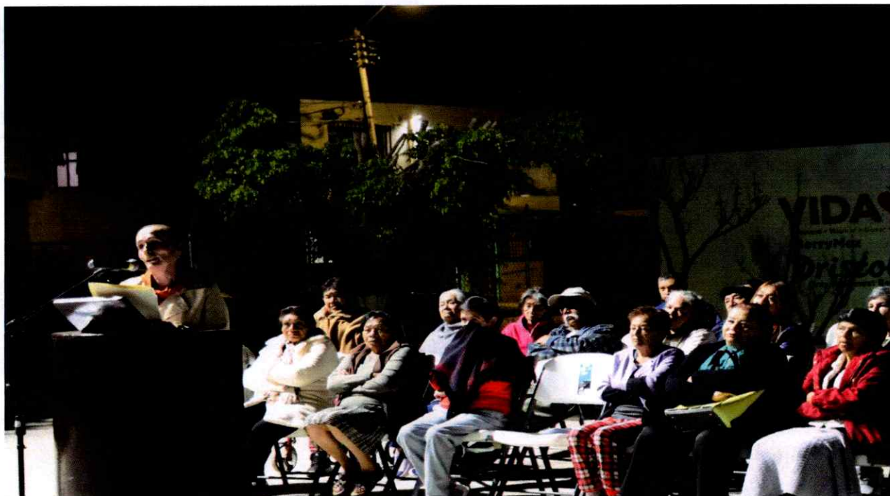
Sesión Ordinaria No. 22. Cabildo Abierto. Calle Joaquín Aguirre esquina con Calle Jesús Rojas. Colonia Constituyentes.