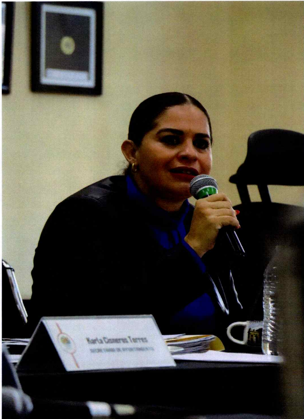
Sesión Ordinaria No. 18.