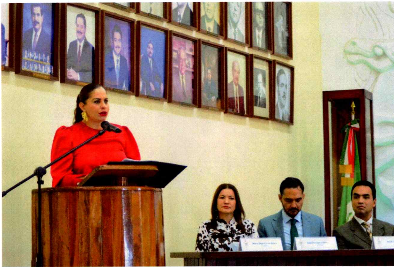
Sesión Solemne No. 19.