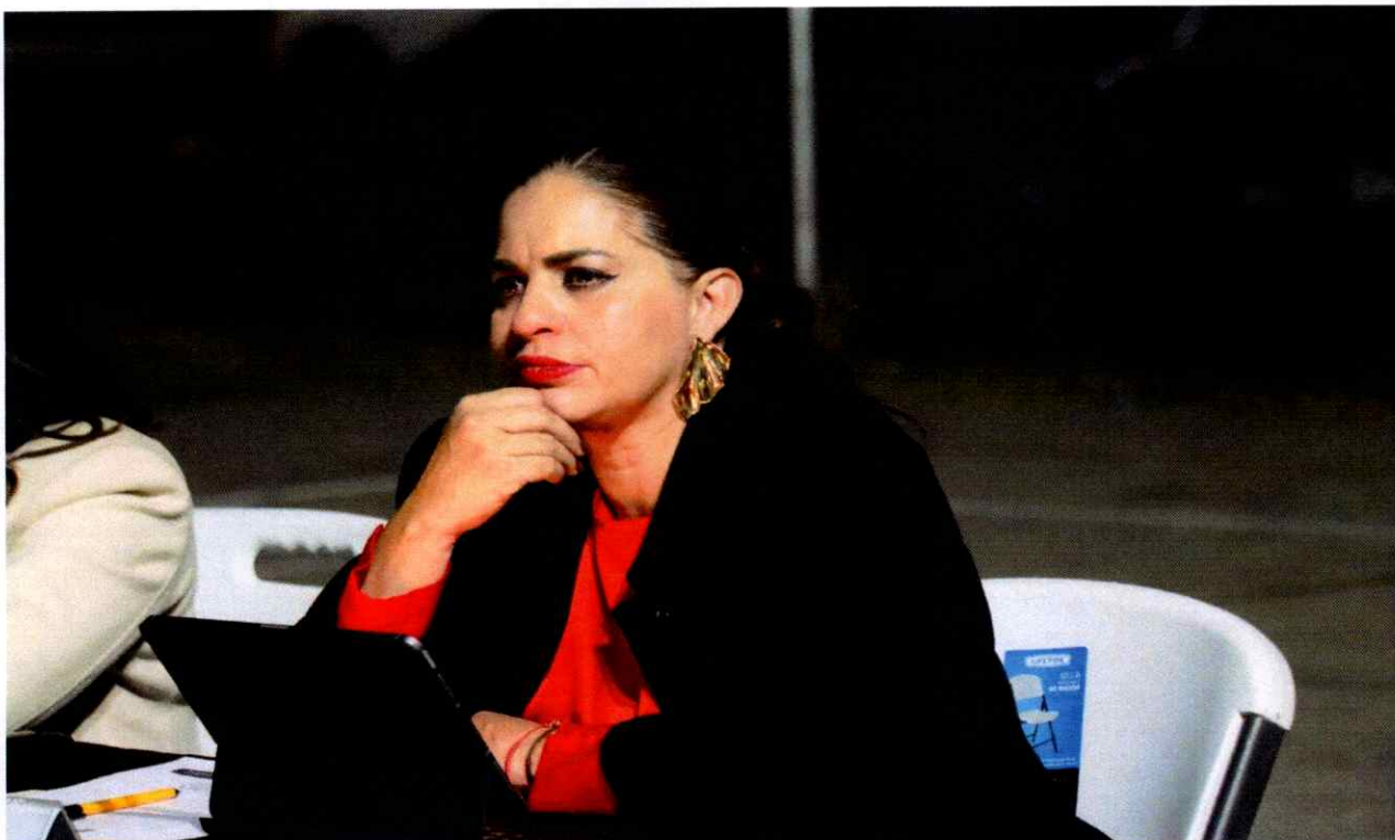
Sesión Ordinaria No. 22. Cabildo Abierto. Calle Joaquín Aguirre esquina con Calle Jesús Rojas. Colonia Constituyentes.