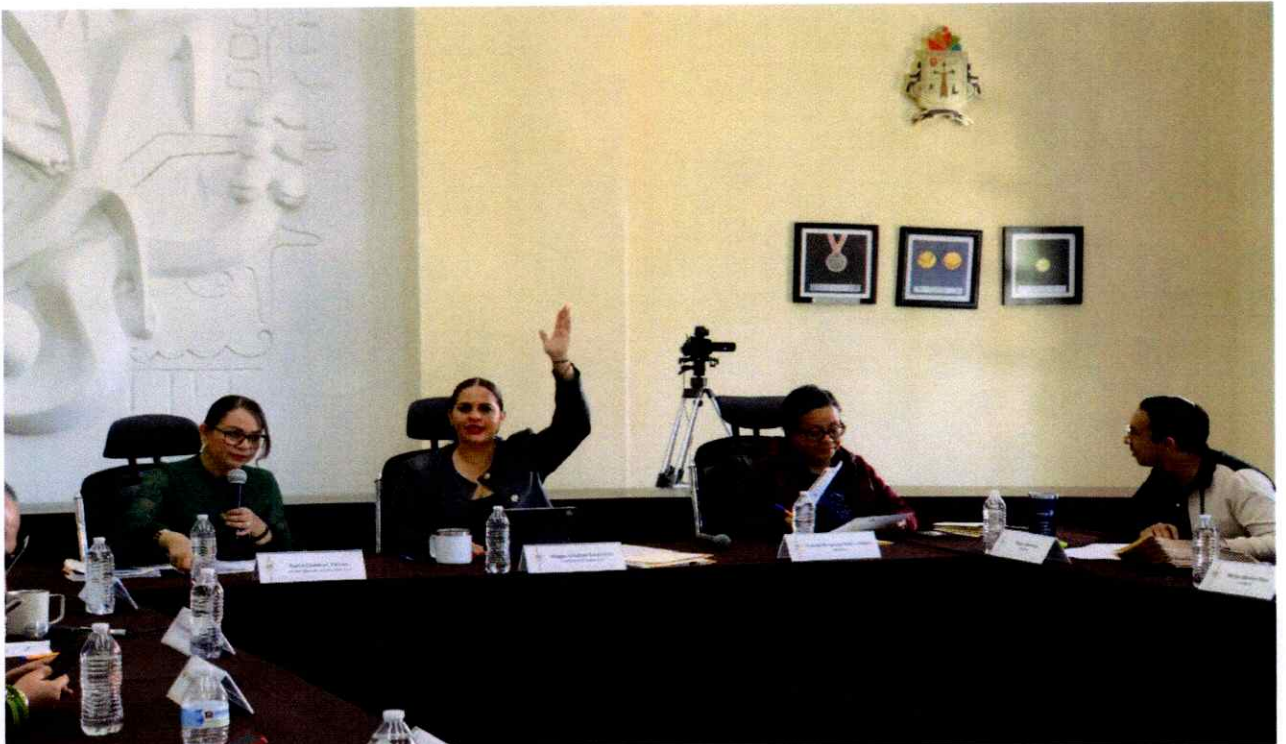
Sesión Extraordinaria No. 50.