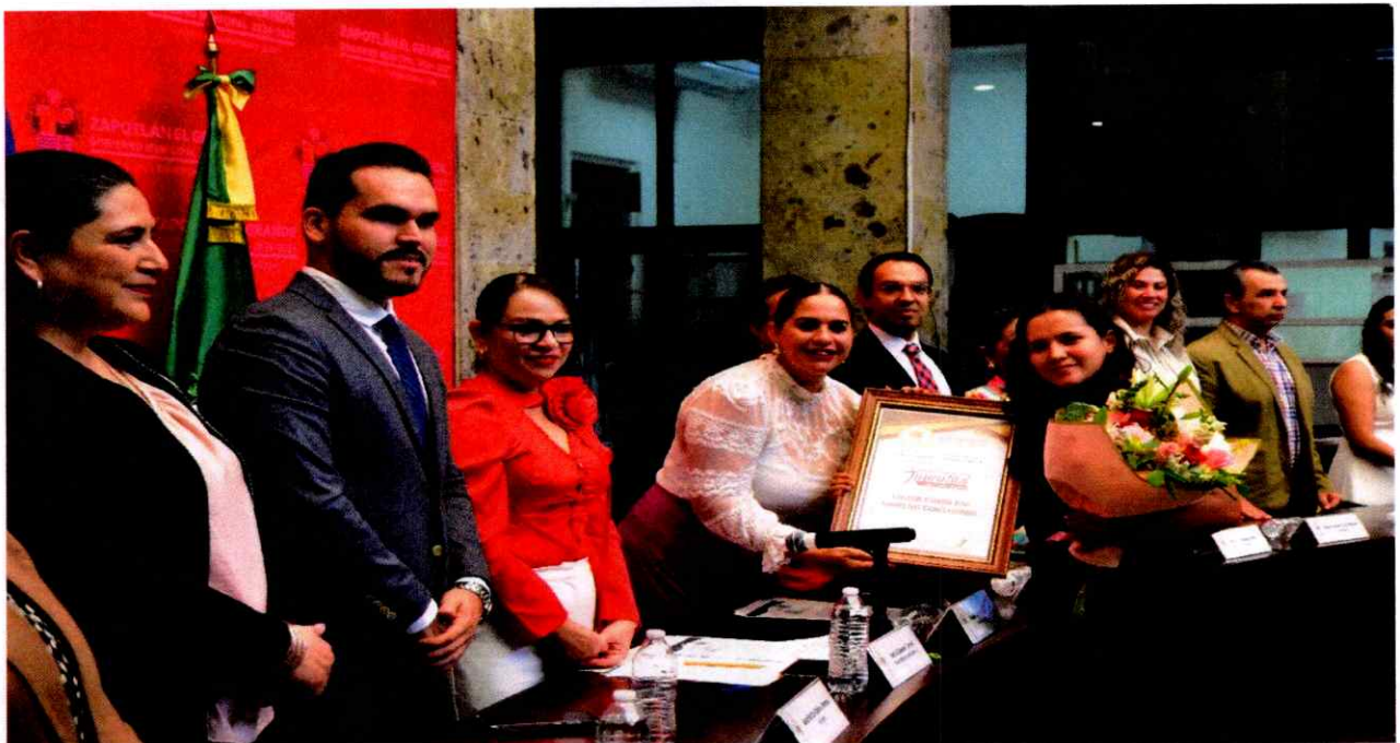
Sesión Solemne No. 13.