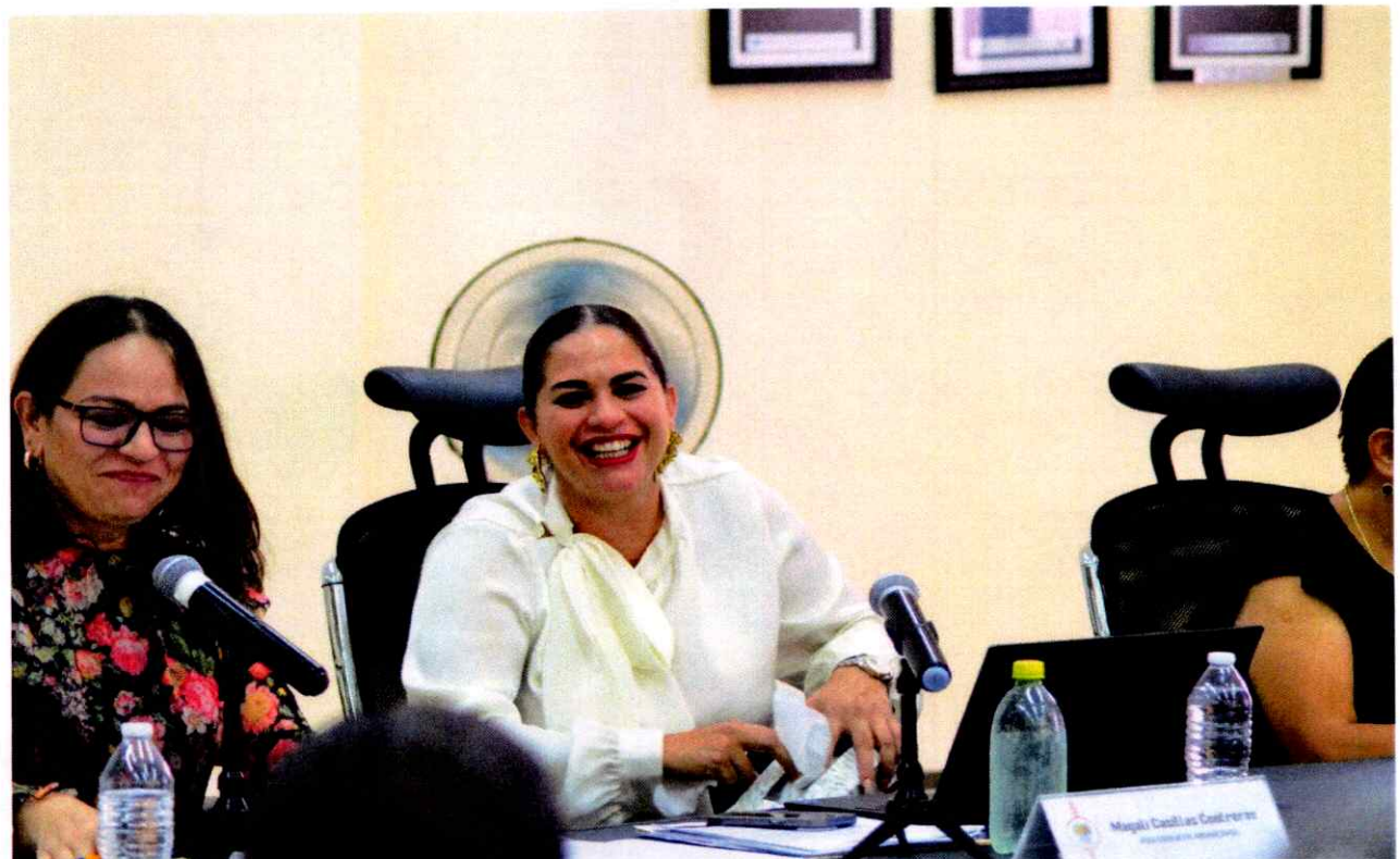
Extraordinaria No. 32.