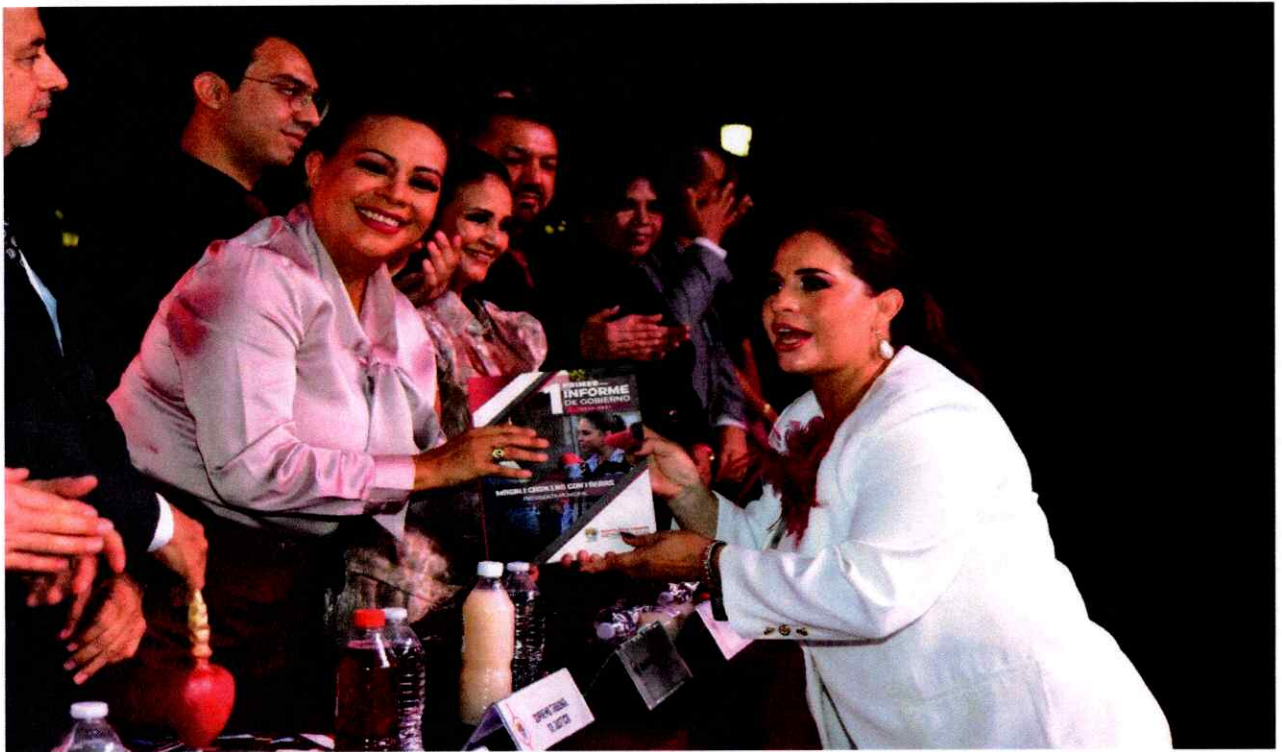
Sesión Solemne No. 16.