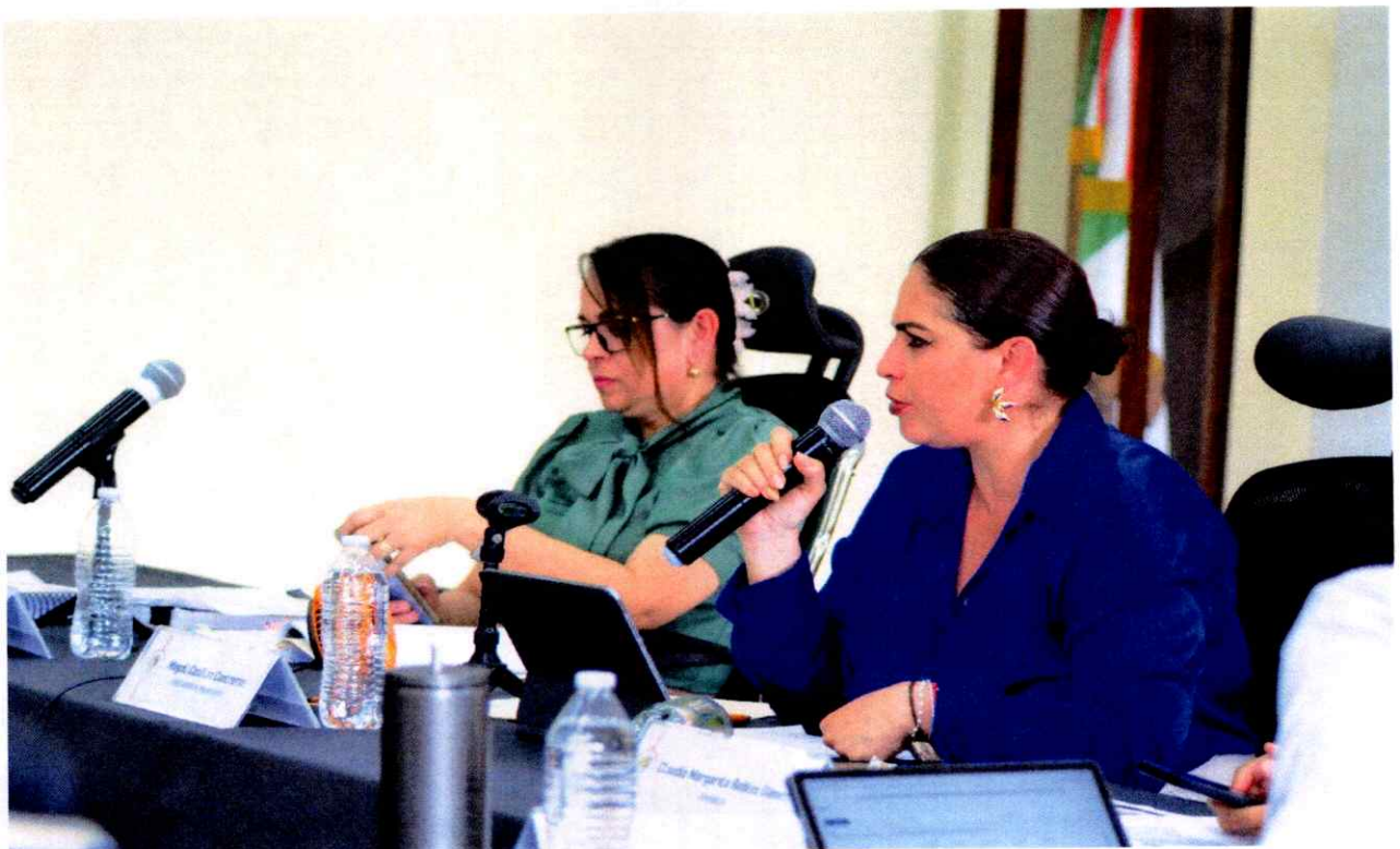
Extraordinaria No. 33.