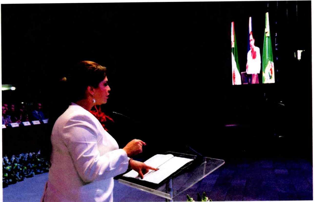
Sesión Solemne No. 16.