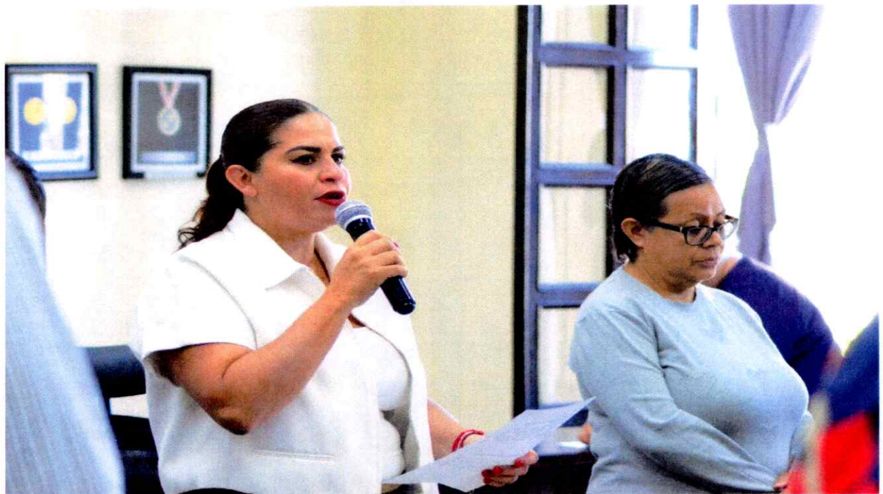
Extraordinaria No. 29.