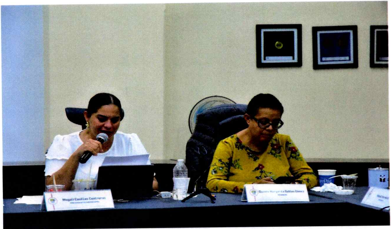
Extraordinaria No. 31.