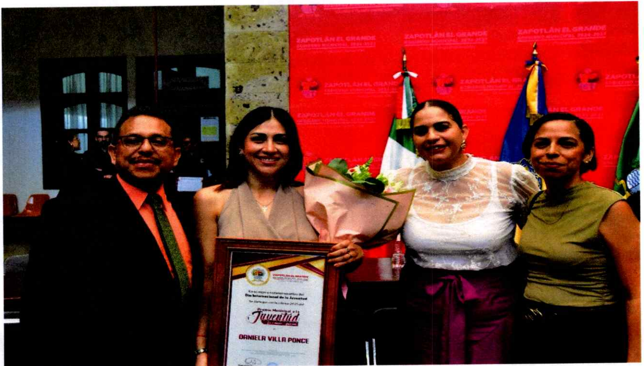
Sesión Solemne No. 13.