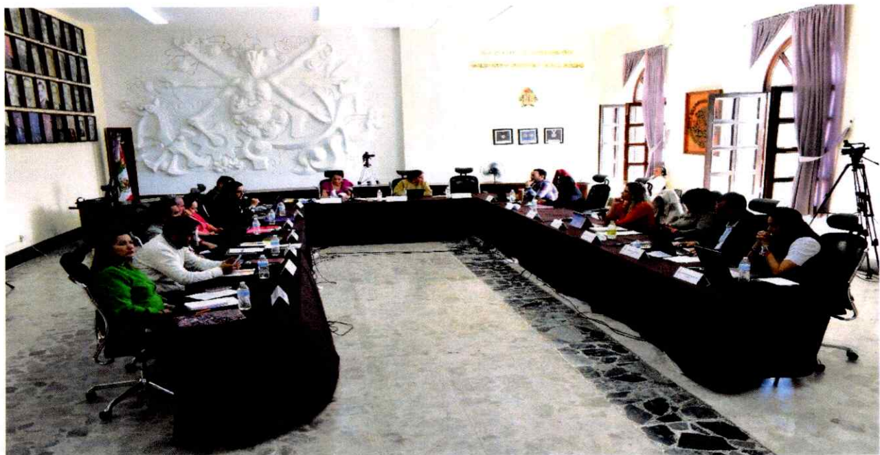
Sesión Extraordinaria No. 28.