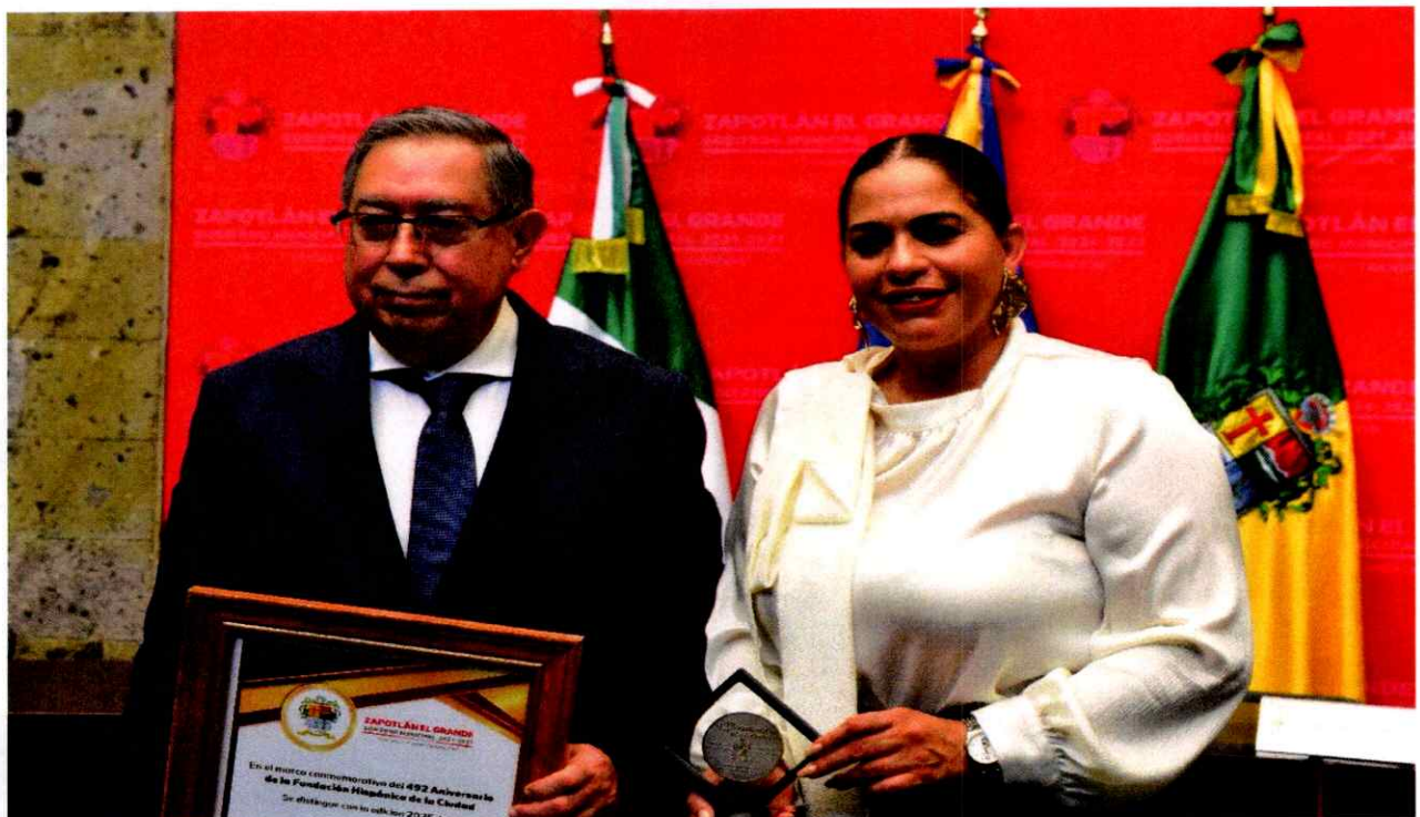
Sesión Solemne No. 14.