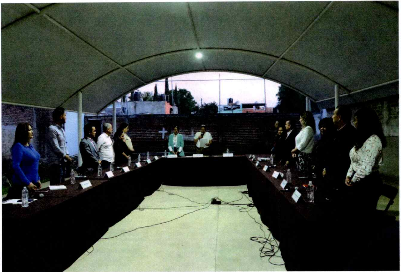
Sesión Ordinaria de Ayuntamiento No. 14. Cabildo Abierto.