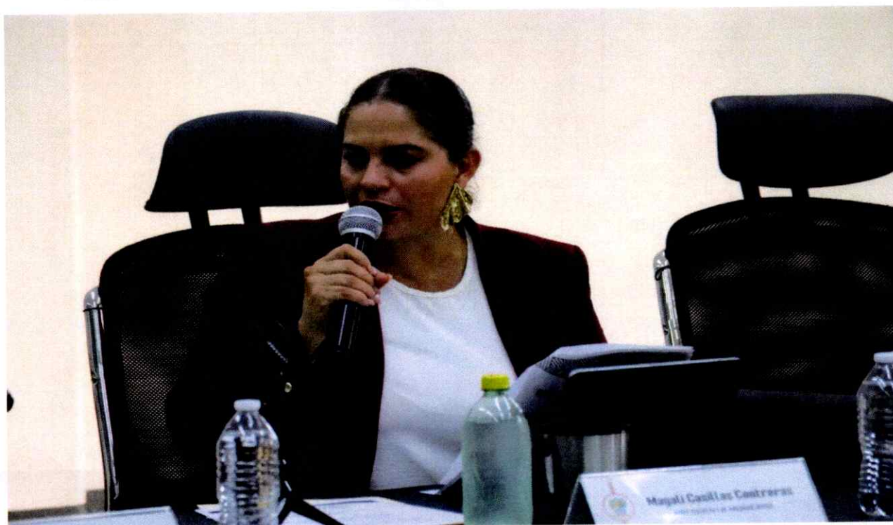
Extraordinaria No. 35.