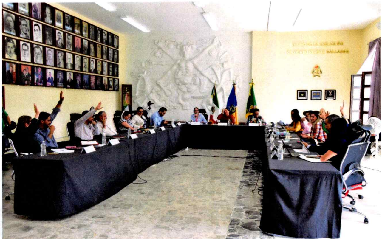
Extraordinaria No. 37.