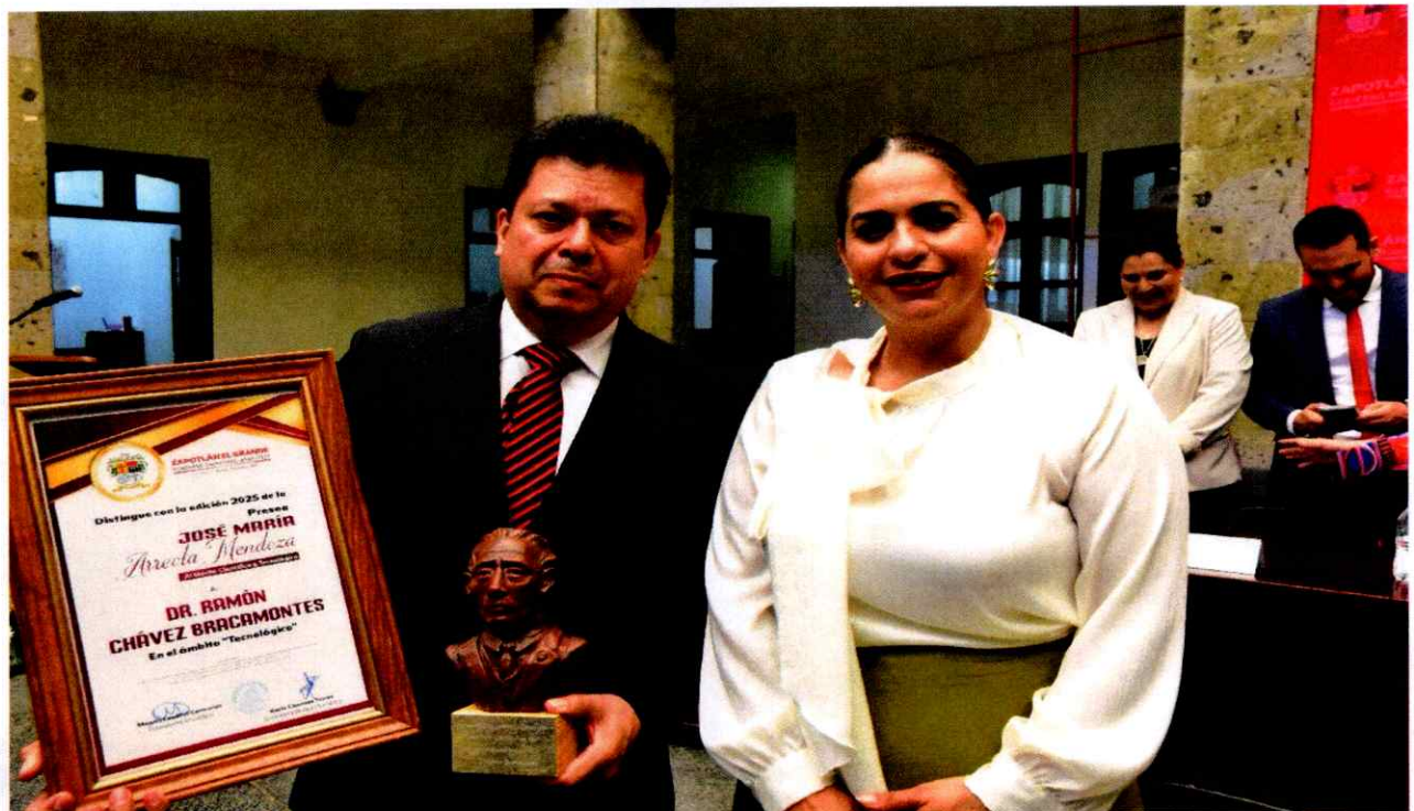
Sesión Solemne No. 15.