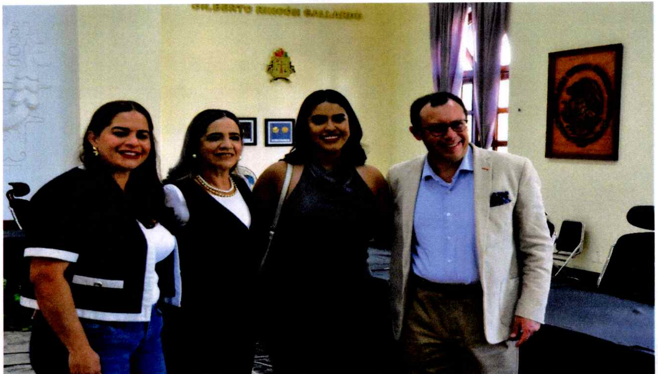
Extraordinaria No. 39.