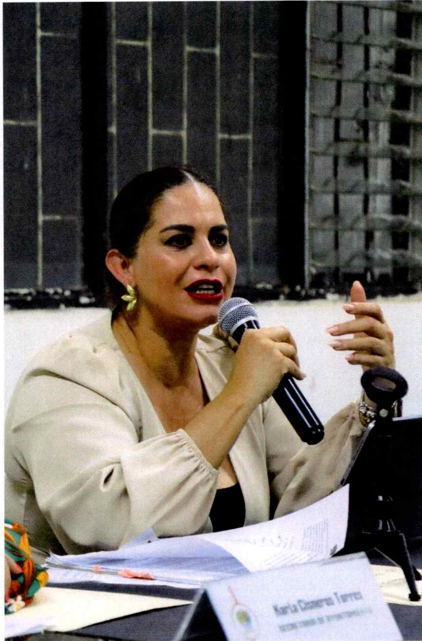
Sesión Ordinaria de Ayuntamiento 16. Cabildo Abierto.