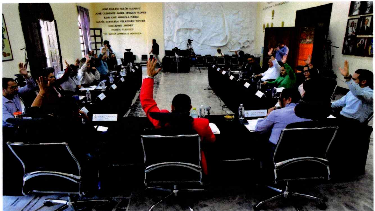
Extraordinaria No. 30.