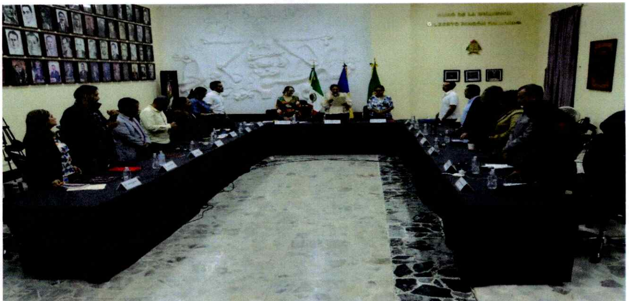
Extraordinaria No. 36.