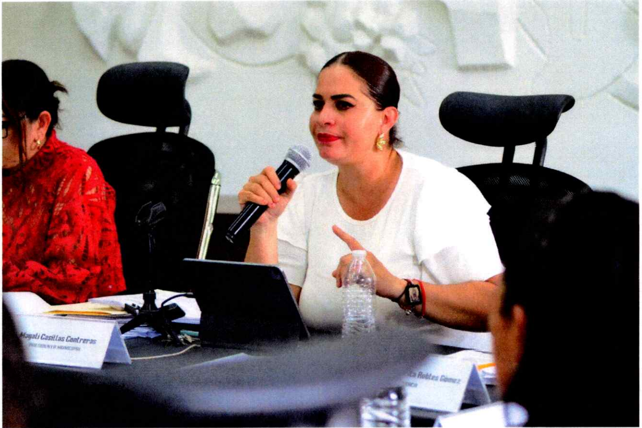
Sesión Ordinaria de Ayuntamiento No. 15.