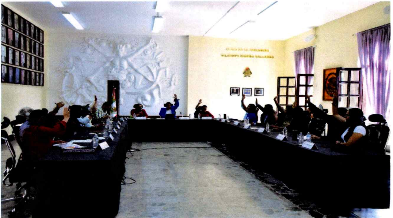
Extraordinaria No. 40.