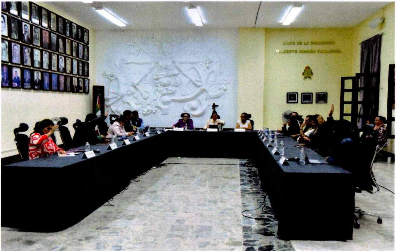
Extraordinaria No. 38.