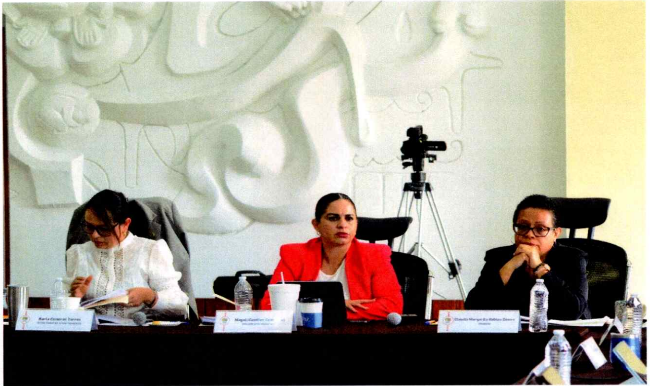
Sesión Ordinaria No. 17.