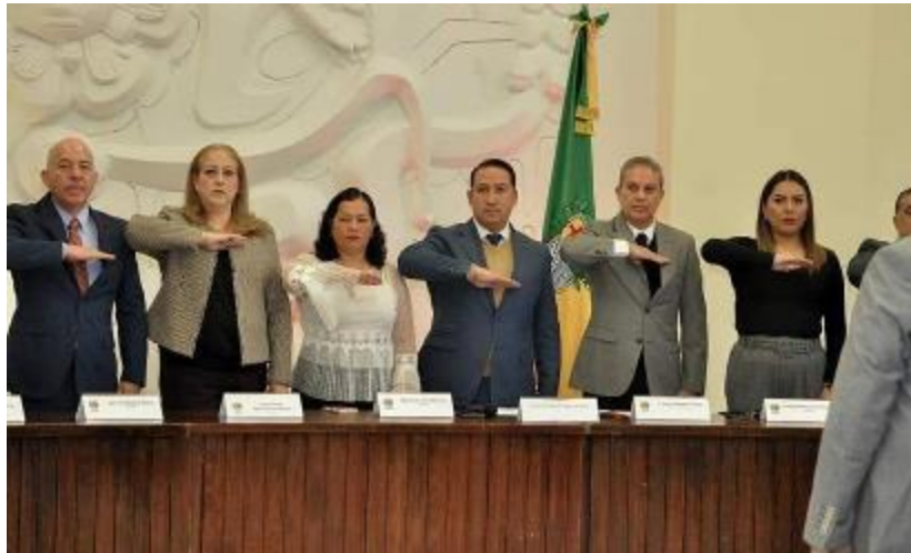
15 DE ENERO 2020