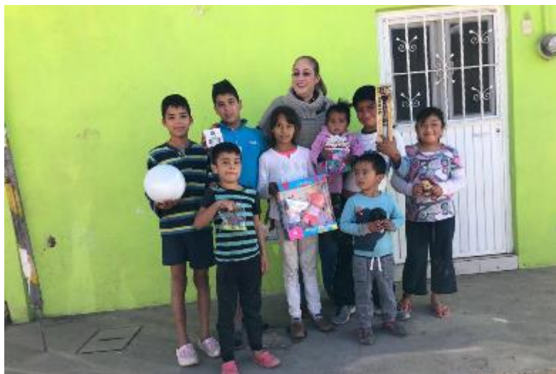
06 DE ENERO 2020