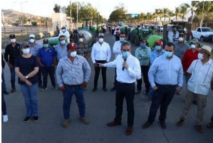
07 DE ABRIL 2020