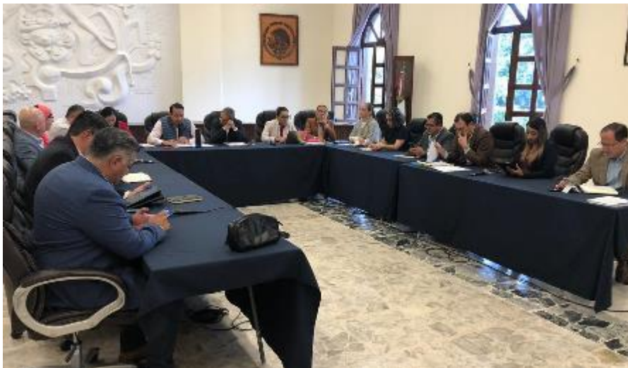
25 DE NOVIEMBRE 2019