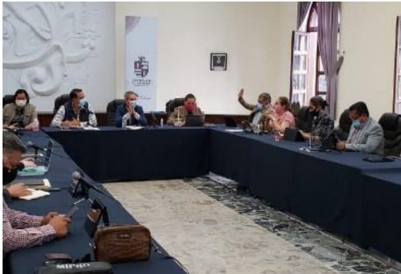
26 DE JUNIO 2020