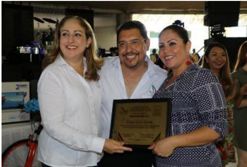
11 DE OCTUBRE 2019