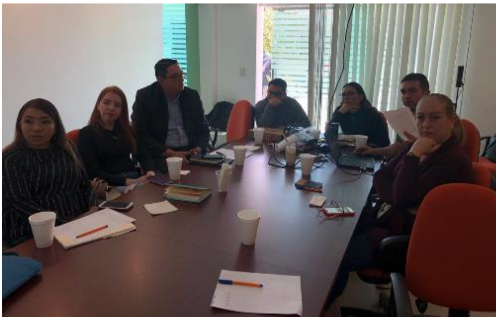
07 DE FEBRERO 2020