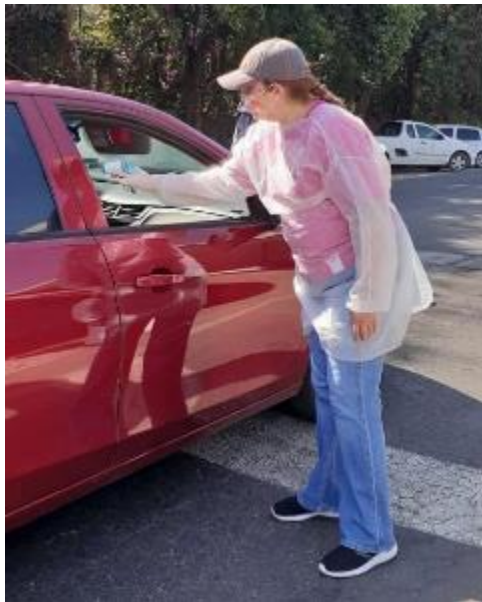
25 DE ABRIL 2020