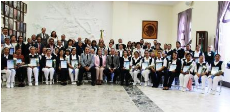
15 DE ENERO 2020