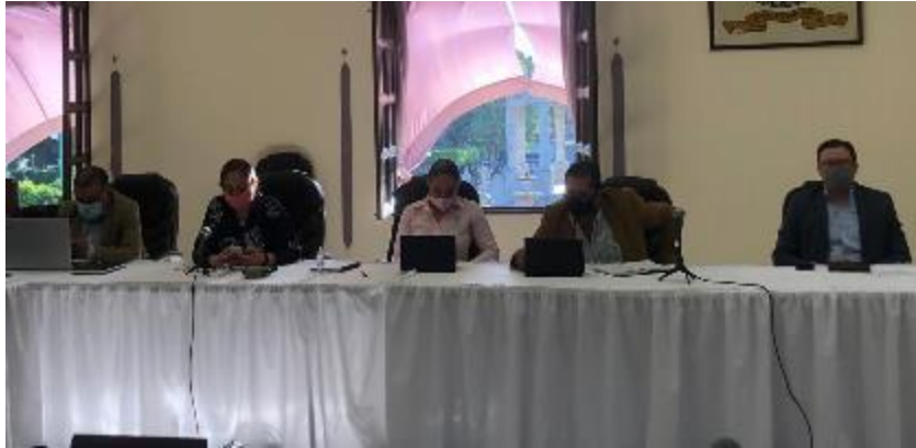
27 DE MAYO 2020