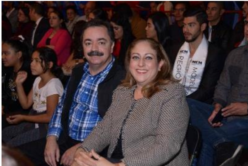
04 DE OCTUBRE 2019