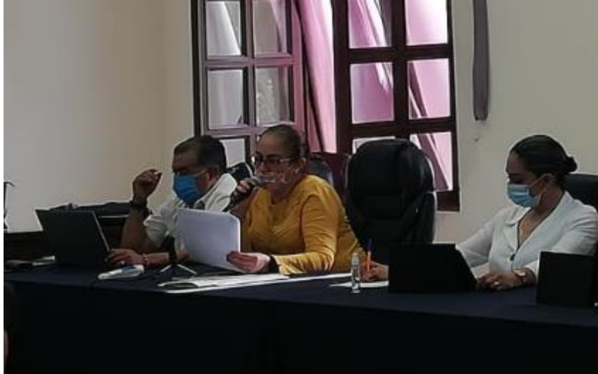
15 DE MAYO 2020