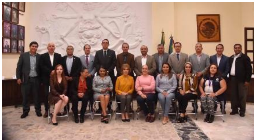
11 DE DICIEMBRE 2019