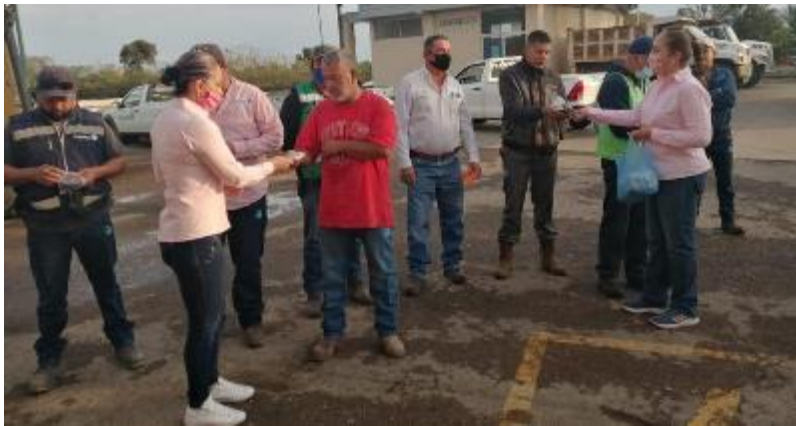
06 DE MAYO