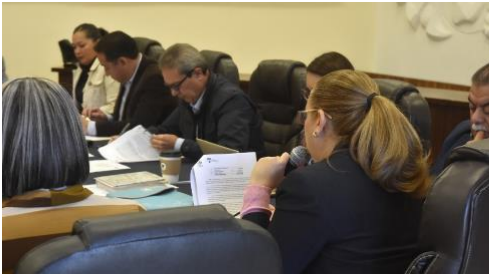
11 DE DICIEMBRE 2019