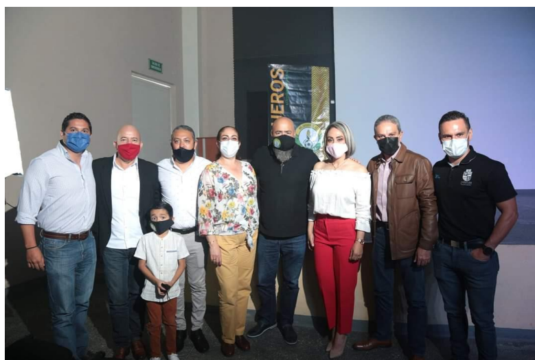
10 DE SEPTIEMBRE 2020