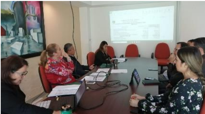
09 DE DICIEMBRE 2019