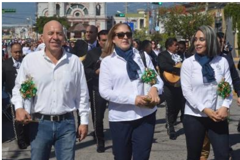
11 DE OCTUBRE 2019