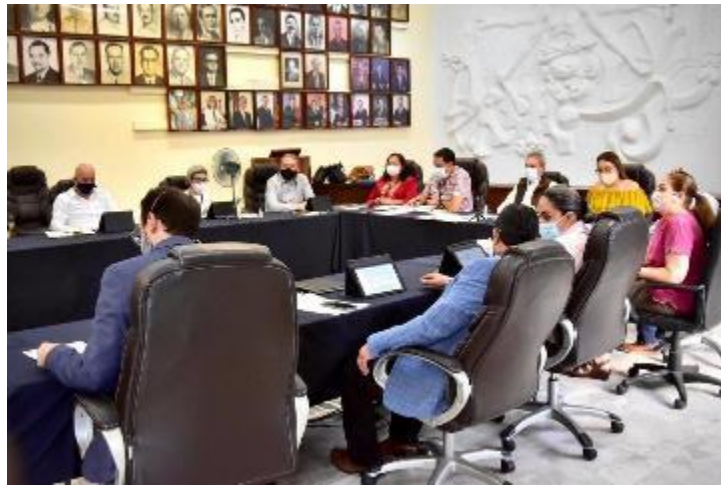
16 DE JUNIO 2020