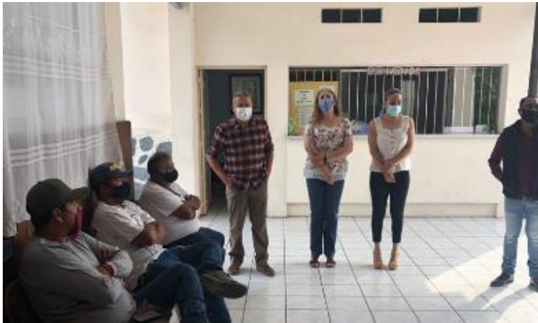
04 DE MAYO 2020