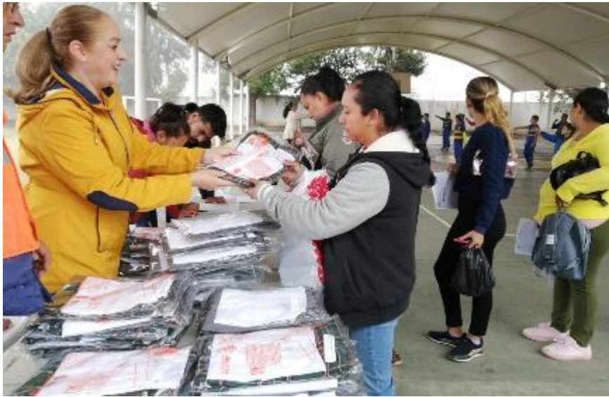
17 DE DICIEMBRE 2019