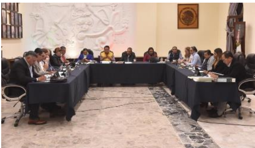
13 DE NOVIEMBRE 2019