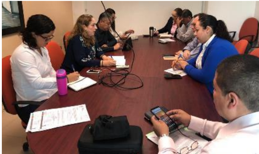
28 DE OCTUBRE 2019