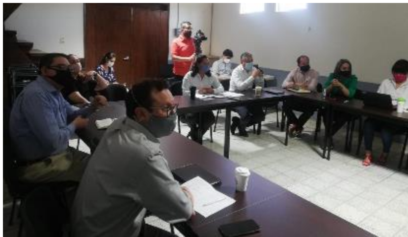
25 DE MAYO 2020