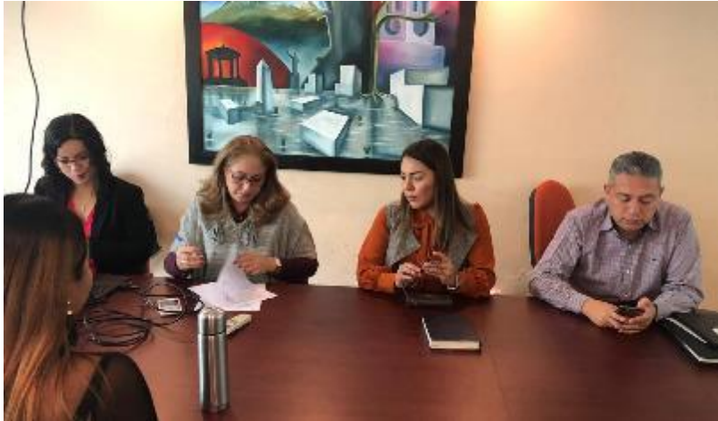
05 DE DICIEMBRE 2019