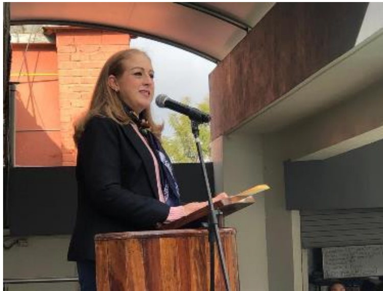
30 DE ENERO 2020