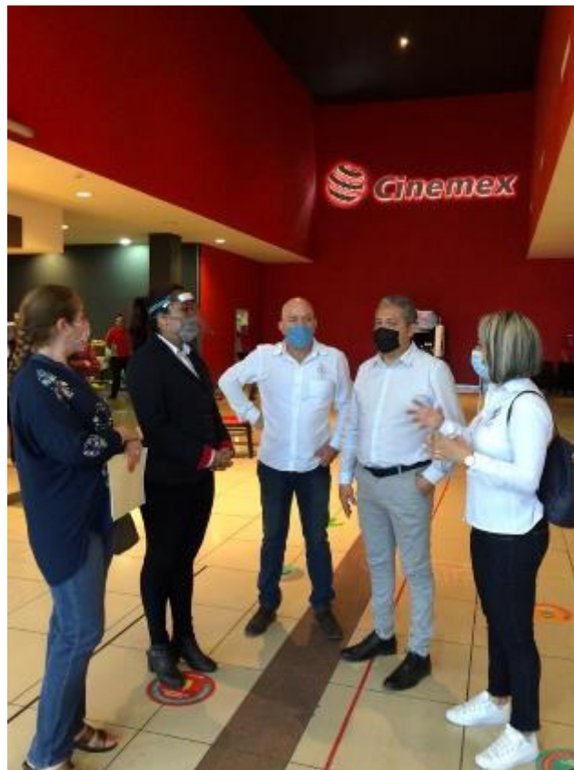
29 DE JUNIO 2020