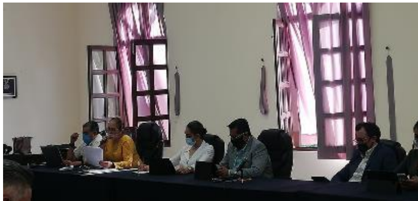
15 DE MAYO 2020