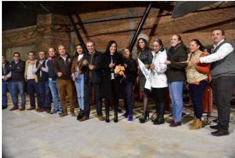
06 DE ENERO 2020