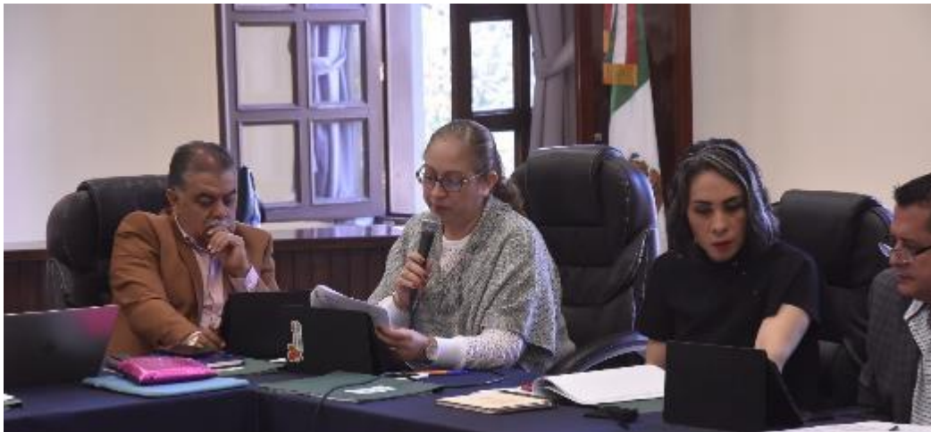
25 DE NOVIEMBRE 2019