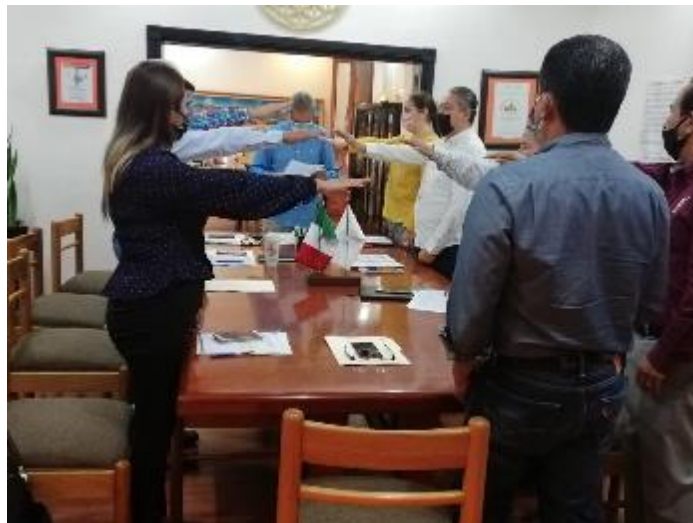
19 DE JUNIO 2020