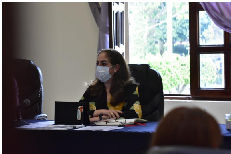
21 DE AGOSTO 2020