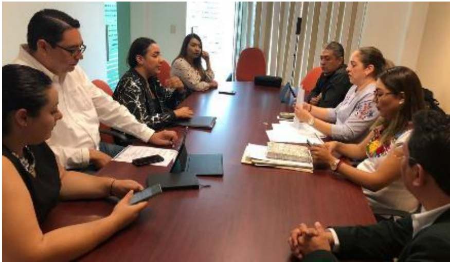
15 DE OCTUBRE 2019