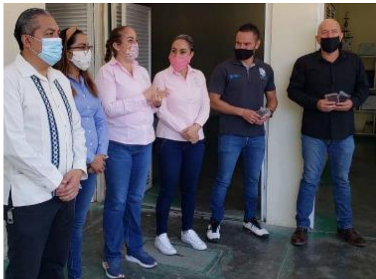
06 DE MAYO 2020