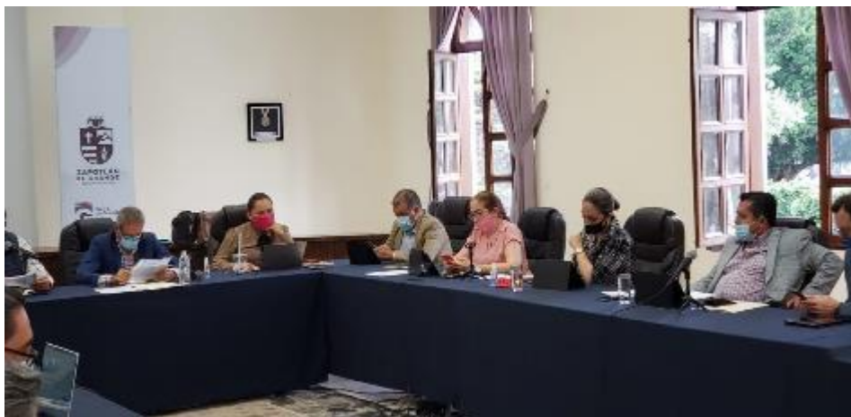
26 DE JUNIO 2020