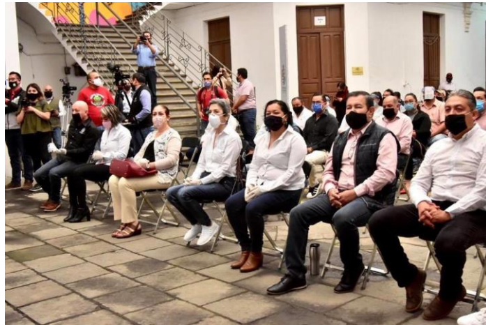
07 DE JULIO 2020