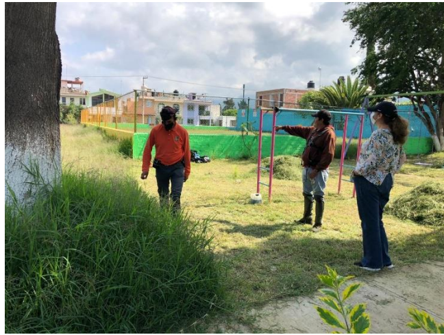
02 DE SEPTIEMBRE 2020