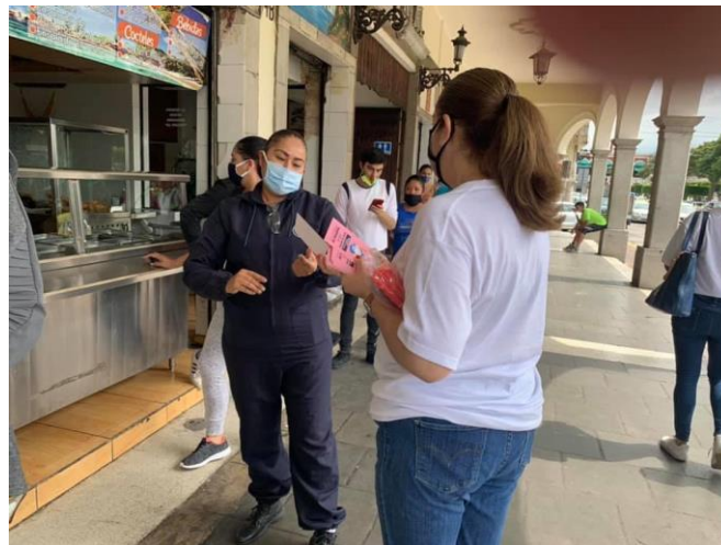
01 DE AGOSTO 2020