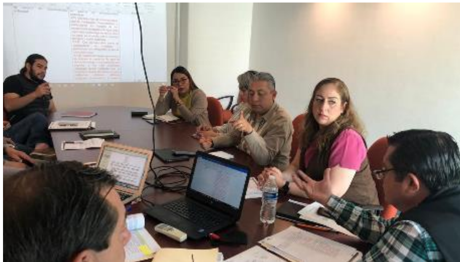
03 DE MARZO 2020