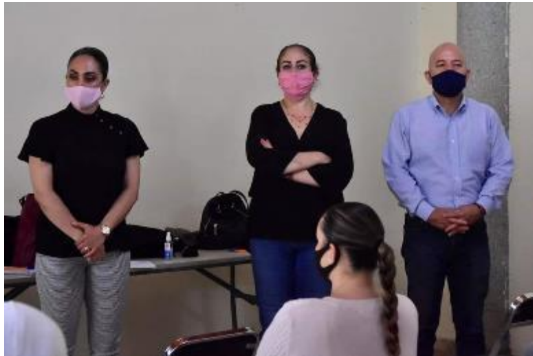
24 DE JUNIO 2020