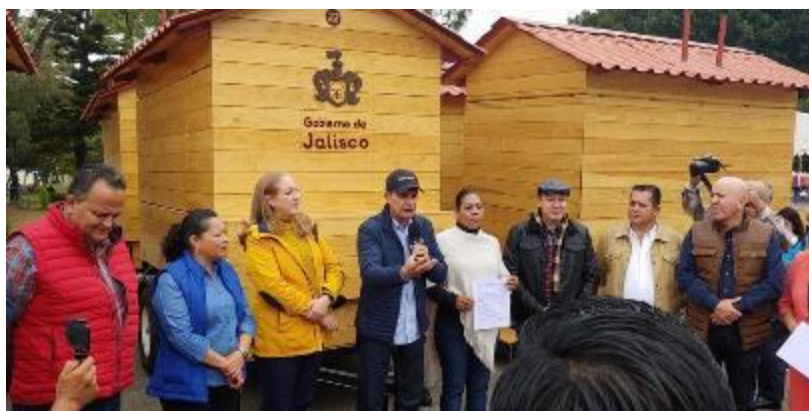
01 DE FEBRERO 2020