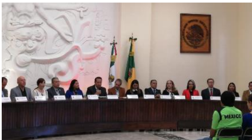
04 DE DICIEMBRE 2019