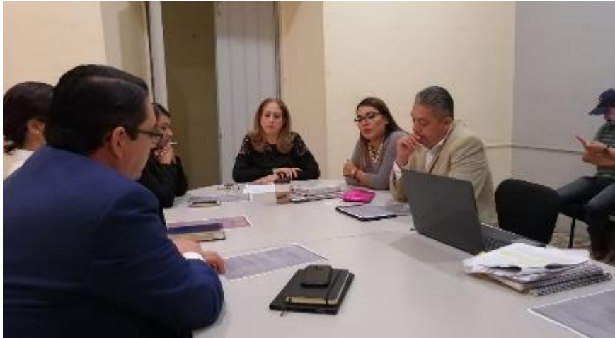
21 DE NOVIEMBRE 2019