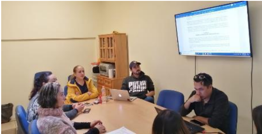
17 DE DICIEMBRE 2019