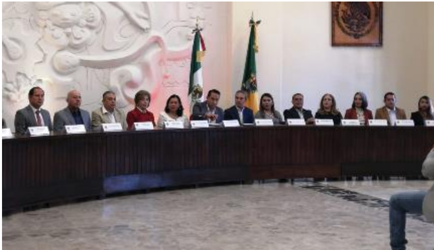
21 DE NOVIEMBRE 2019