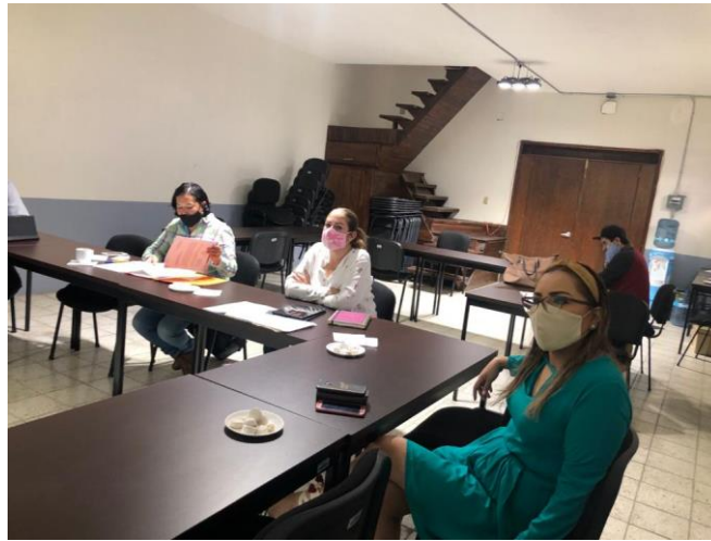
23 DE JULIO 2020