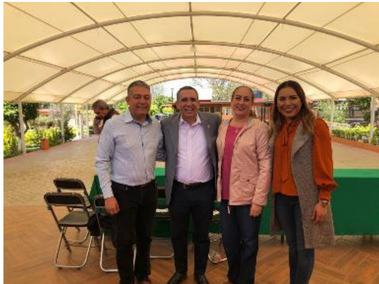
21 DE FEBRERO 2020