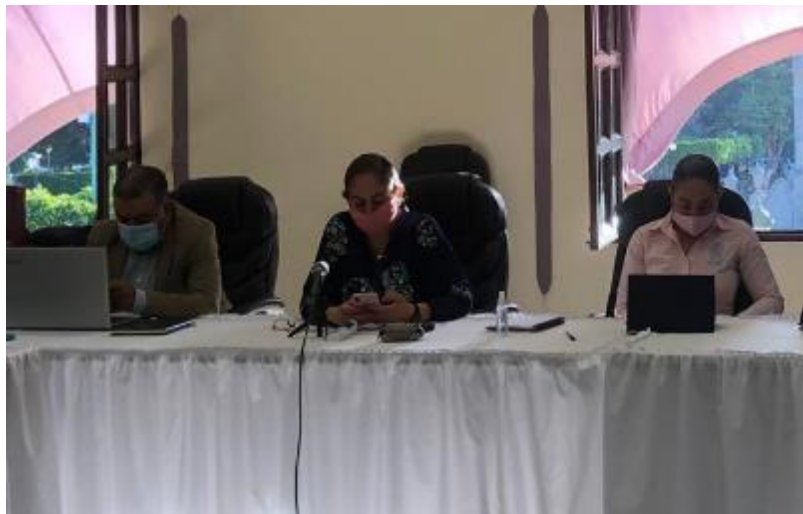
27 DE MAYO 2020