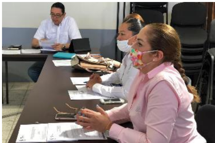
15 DE ABRIL 2020