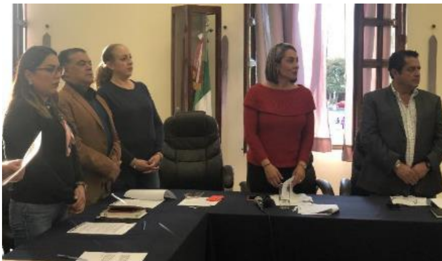
20 DE ENERO DEL 2020