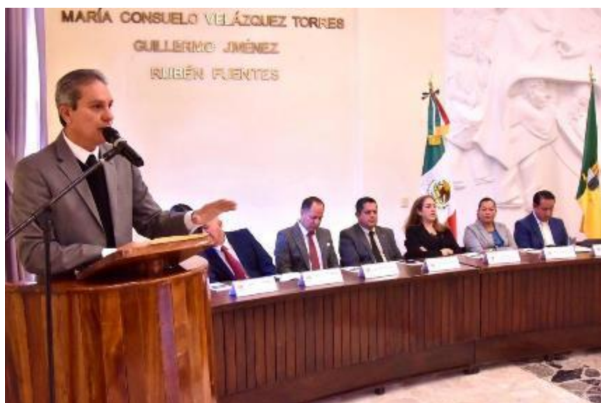
14 DE FEBRERO 2020