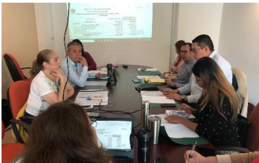
03 DE DICIEMBRE 2019