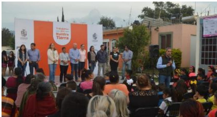
09 DE OCTUBRE 2019