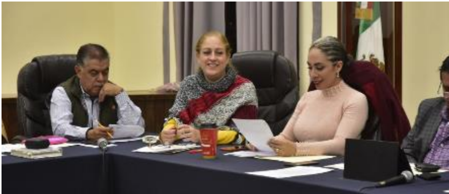
18 DE DICIEMBRE 2019