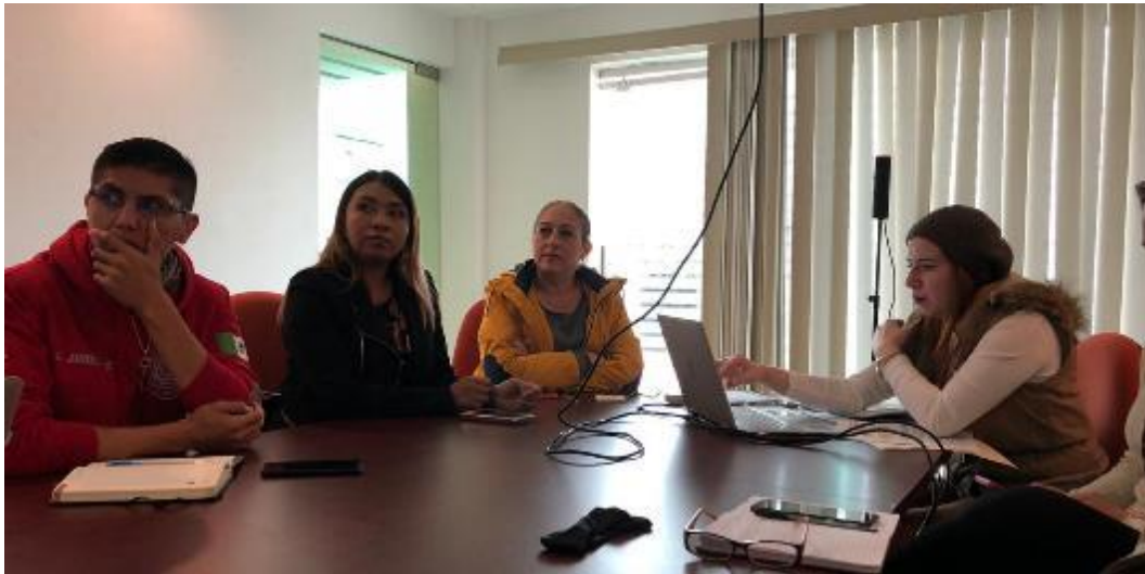
23 DE ENERO 2020