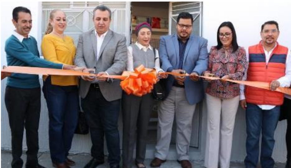
02 DE DICIEMBRE 2019