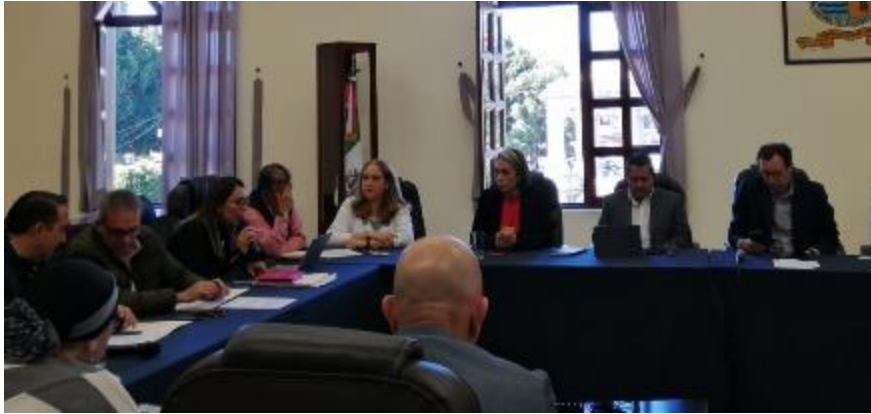
13 DE DICIEMBRE 2019