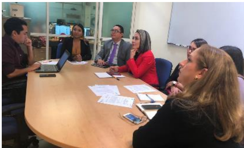
04 DE DICIEMBRE 2019