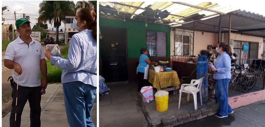
7 AL 15 DE SEPTIEMBRE 2020