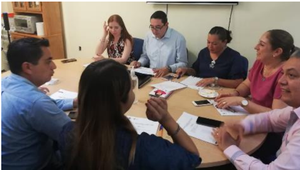
14 DE OCTUBRE 2019