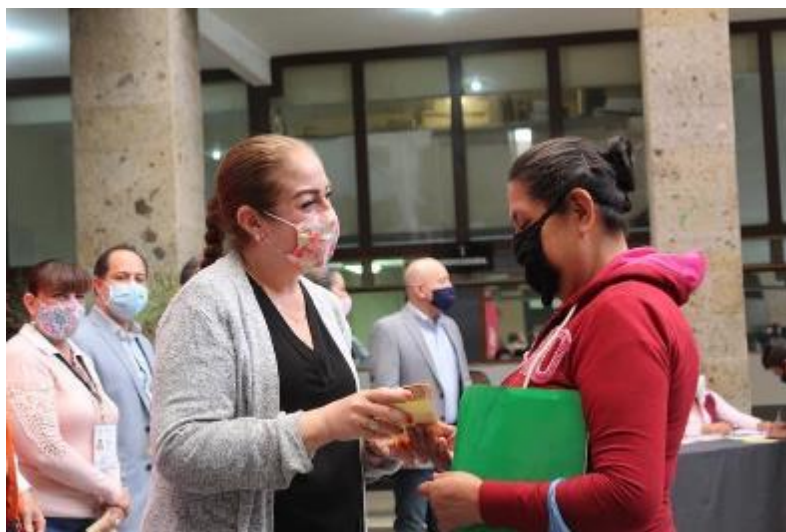
24 DE JUNIO 2020