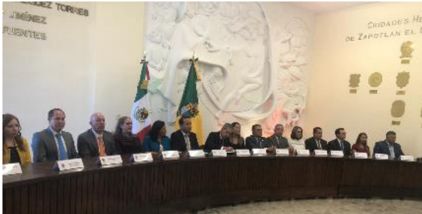
28 DE ENERO 2020