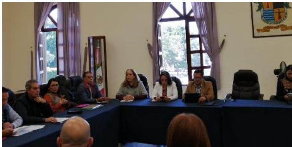
05 DE DICIEMBRE 2019