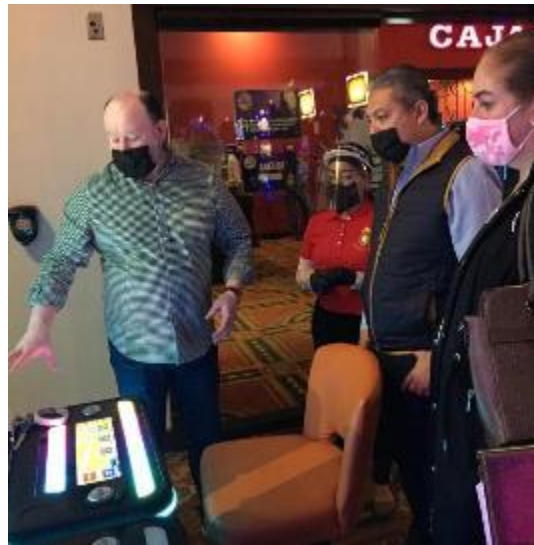
30 DE JUNIO 2020