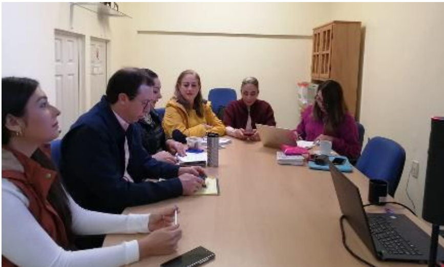
18 DE DICIEMBRE 2019