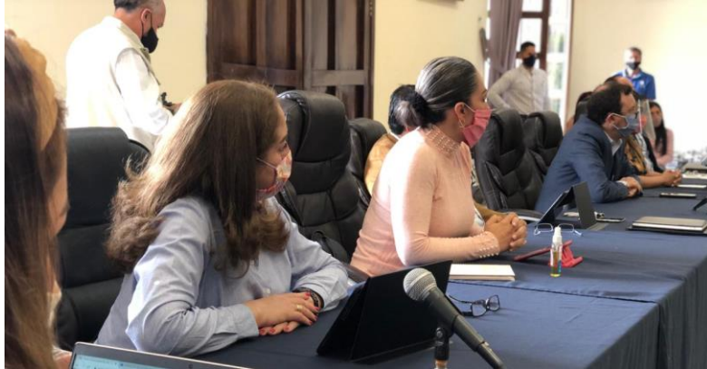
29 DE JULIO 2020