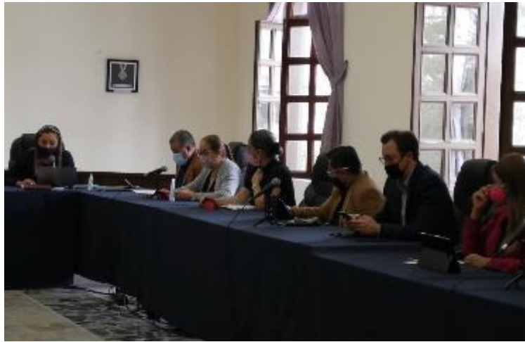
24 DE JUNIO 2020