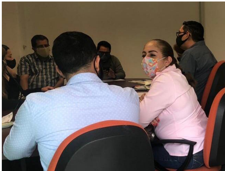
13 DE AGOSTO 2020