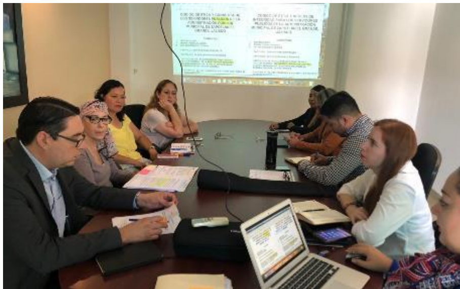
02 DE OCTUBRE 2019