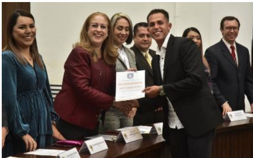
20 DE DICIEMBRE 2019