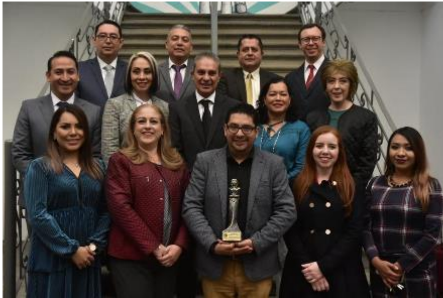
20 DE DICIEMBRE 2019