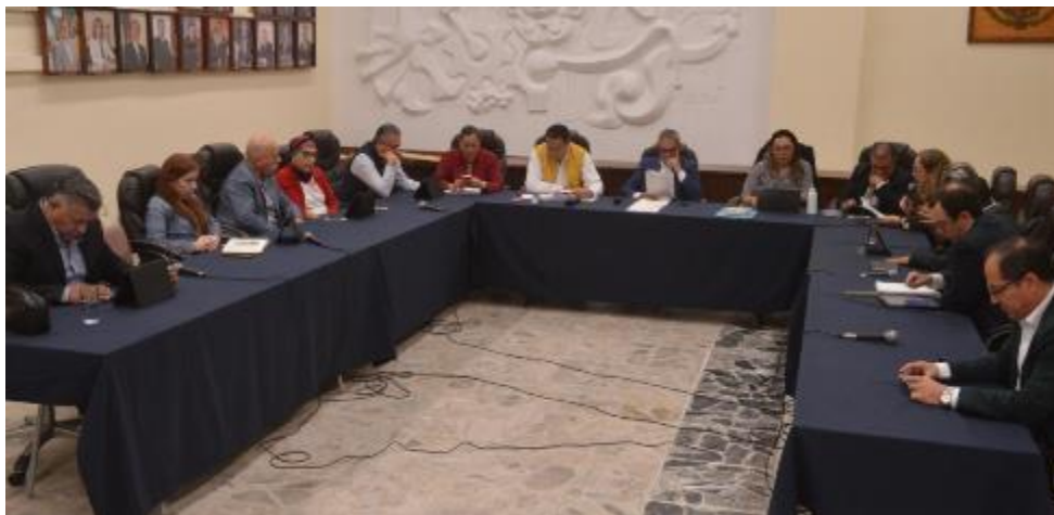
29 DE OCTUBRE 2019