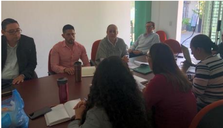
06 DE DICIEMBRE 2019