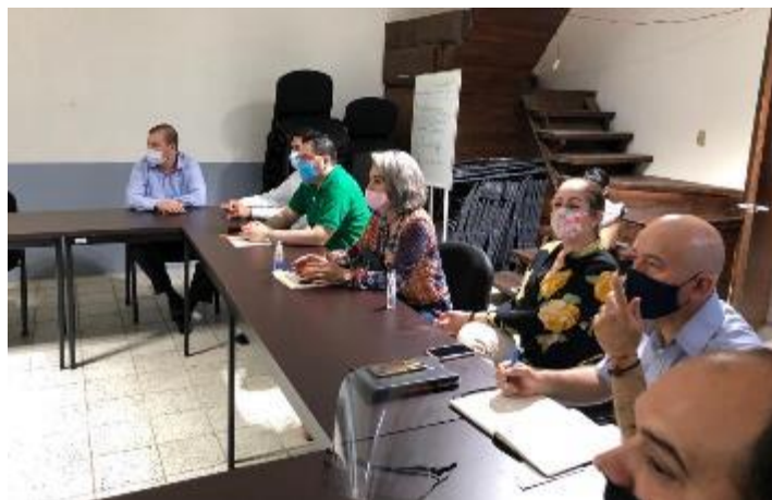
04 DE JUNIO 2020