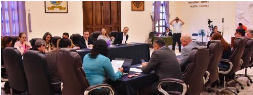
18 DE FEBRERO 2020