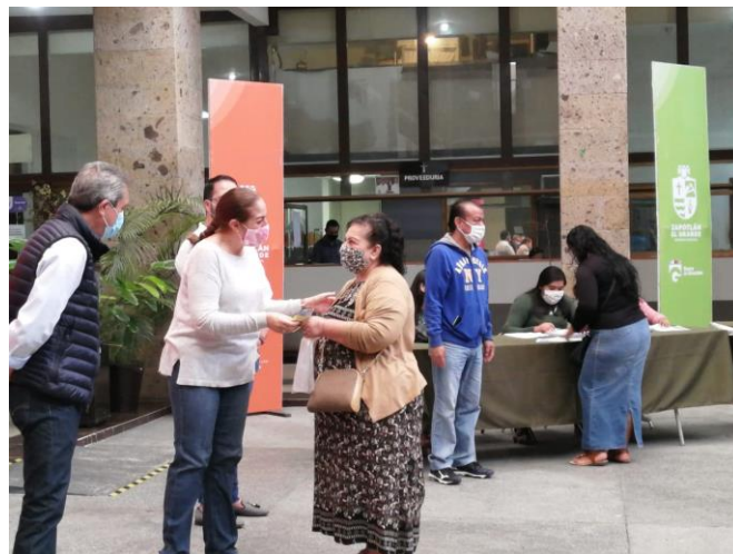
08 DE JULIO 2020