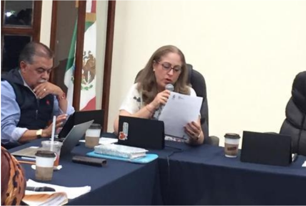
13 DE NOVIEMBRE 2019