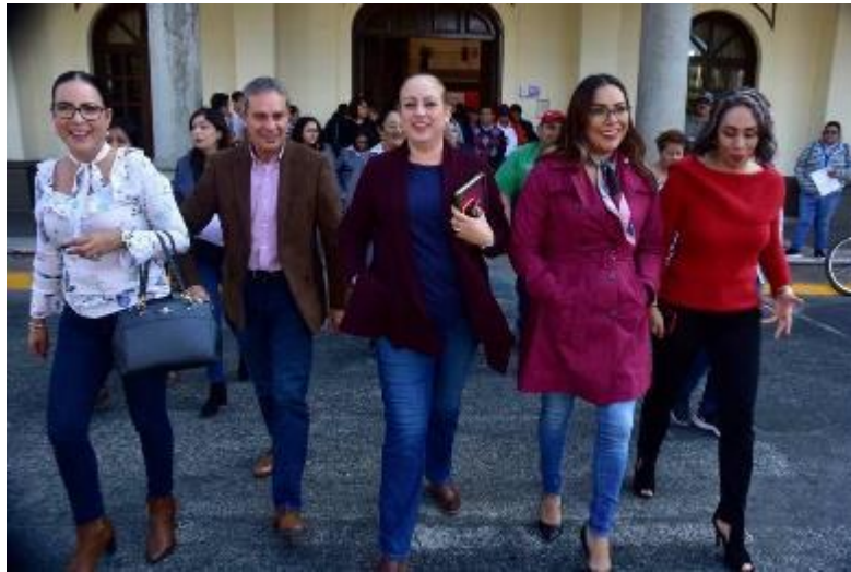
20 ENERO 2020