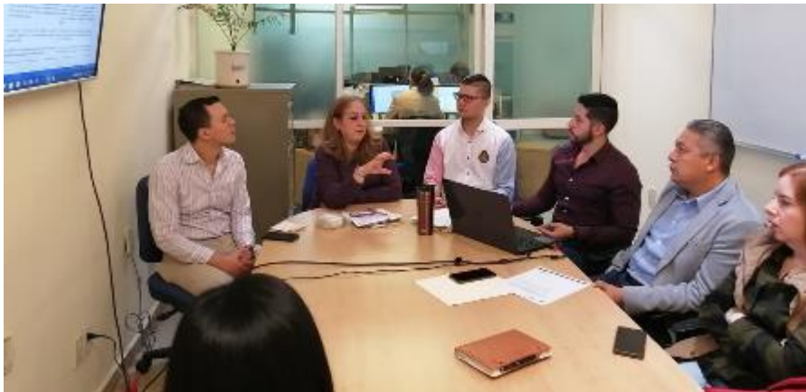
28 DE NOVIEMBRE 2019