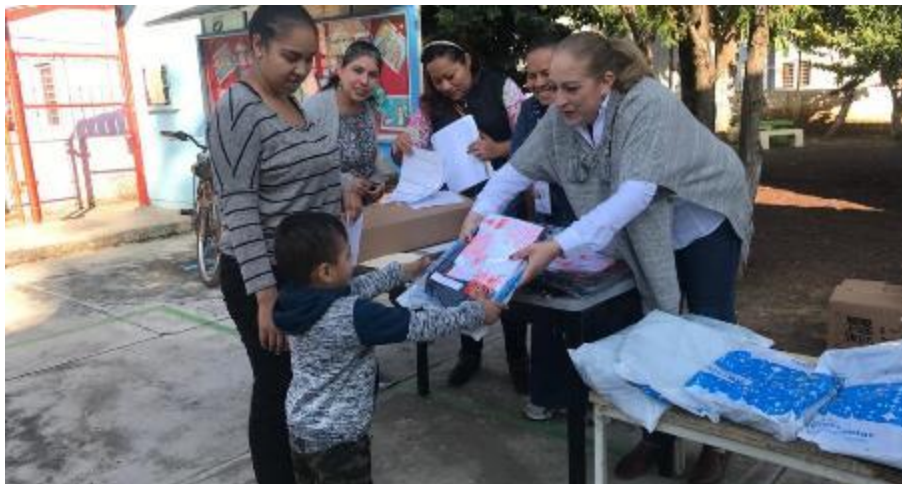
06 DE DICIEMBRE 2019