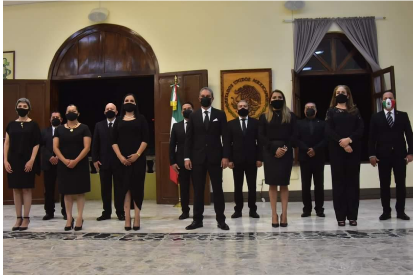
15 DE SEPTIEMBRE 2020