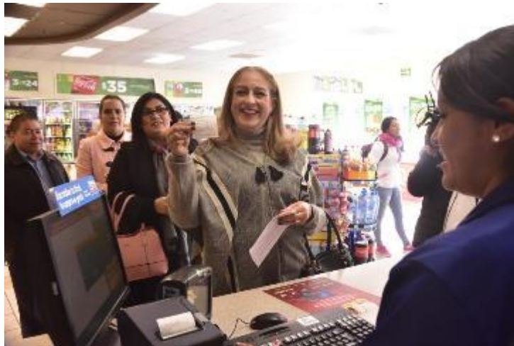
07 DE ENERO 2020