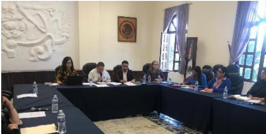
28 DE NOVIEMBRE 2019