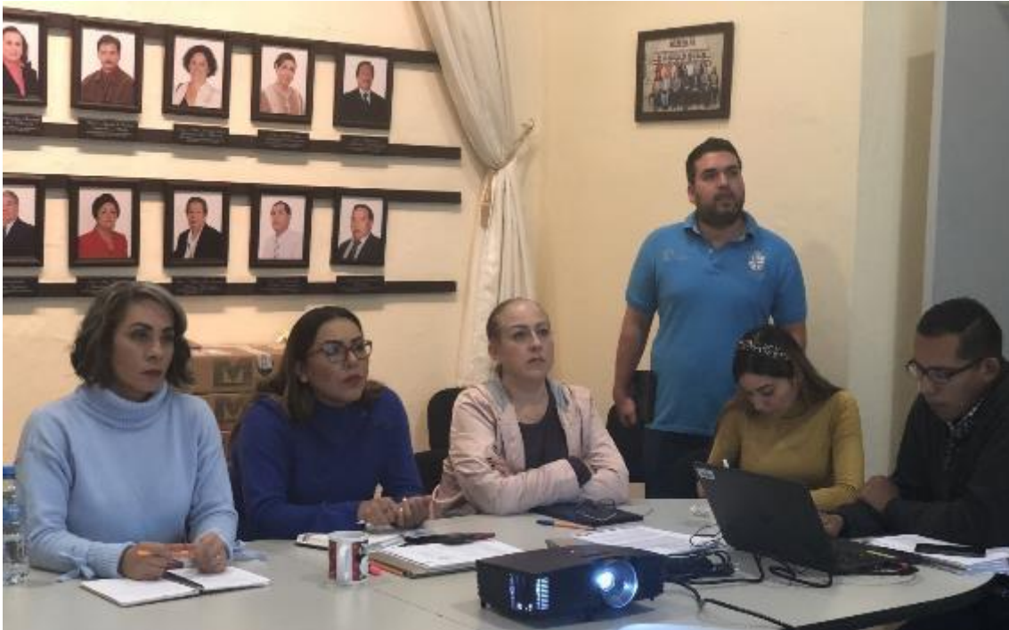
13 DE FEBRERO 2020