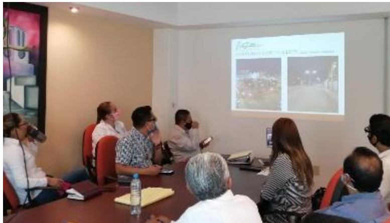
25 DE JUNIO 2020