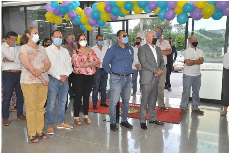
11 DE SEPTIEMBRE 2020