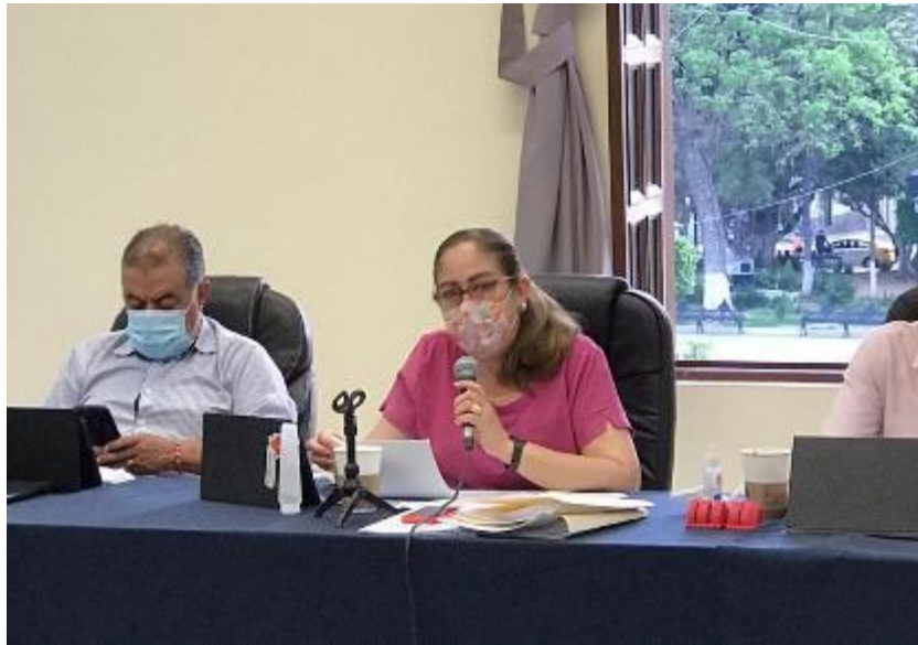
16 DE JUNIO 2020