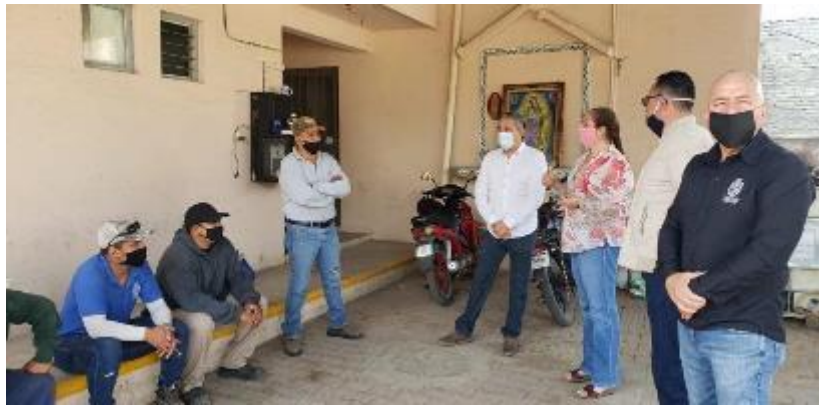
08 DE MAYO 2020