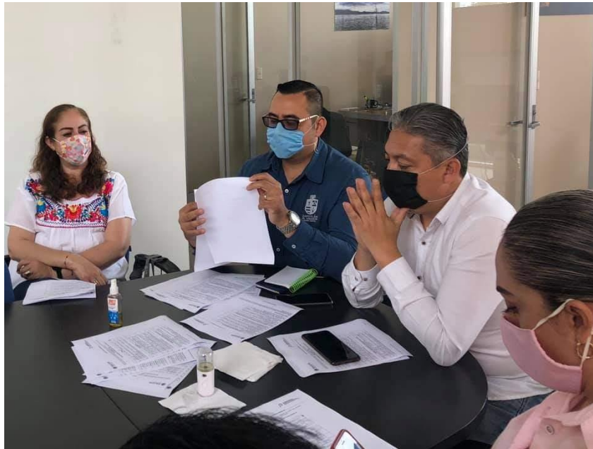
25 DE AGOSTO 2020