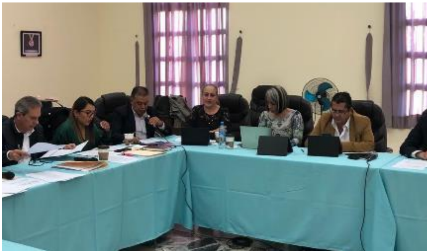
10 DE FEBRERO 2020