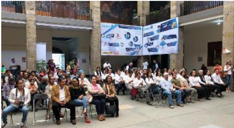
19 DE FEBRERO 2020