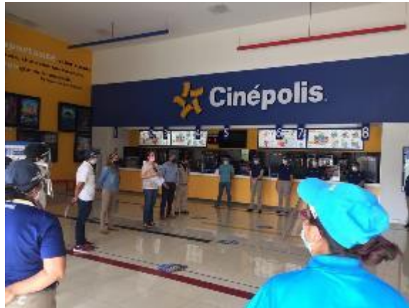
29 DE JUNIO 2020