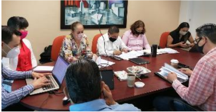
22 DE MAYO 2020