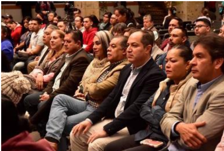
29 DE ENERO 2020