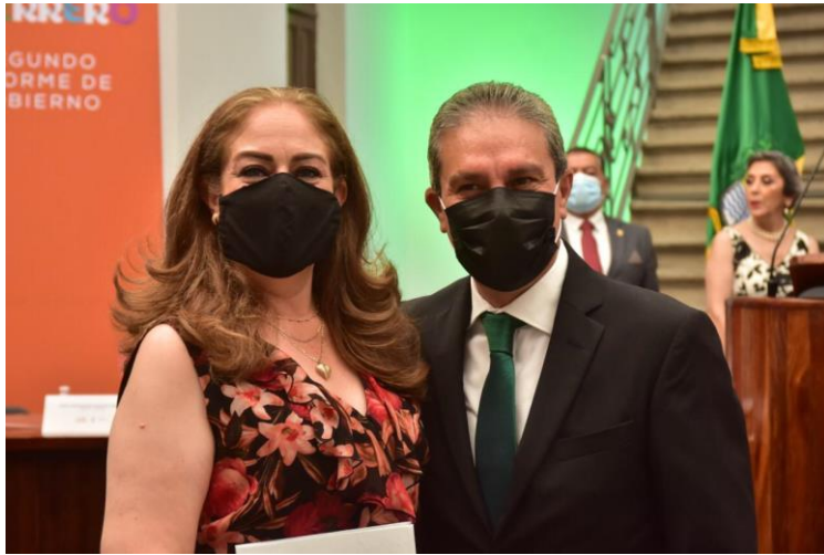
11 DE SEPTIEMBRE 2020