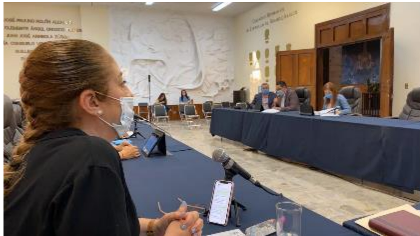
08 ABRIL 2020