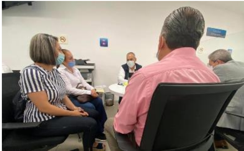
07 DE MAYO 2020