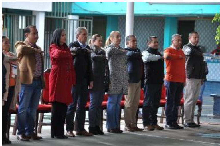
05 DE FEBRERO 2020