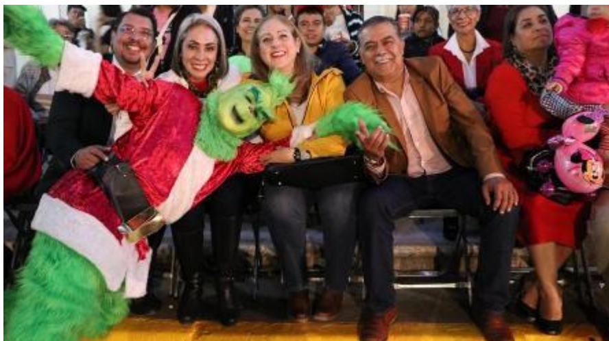
14 DE DICIEMBRE 2019