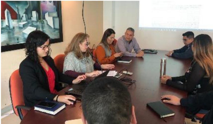
05 DE DICIEMBRE 2019