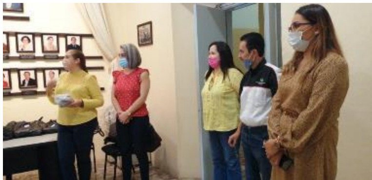
30 DE ABRIL 2020