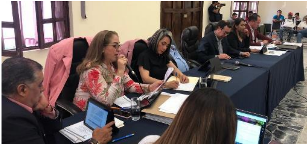
18 DE FEBRERO 2020