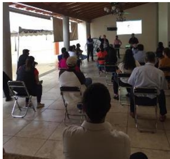
30 DE JUNIO 2020