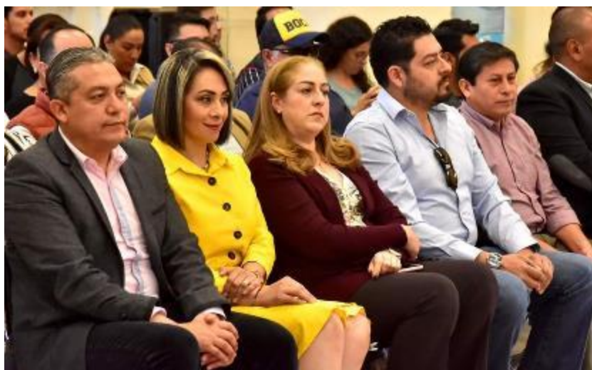
27 DE FEBRERO DE 2020