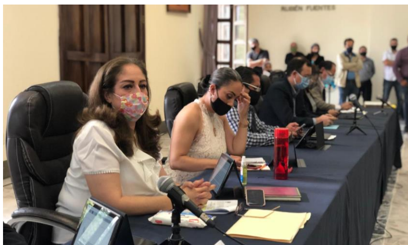
22 DE JULIO 2020