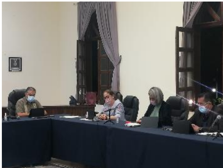
18 DE JUNIO 2020