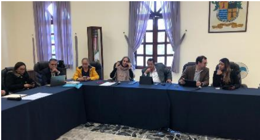
17 DE DICIEMBRE 2019