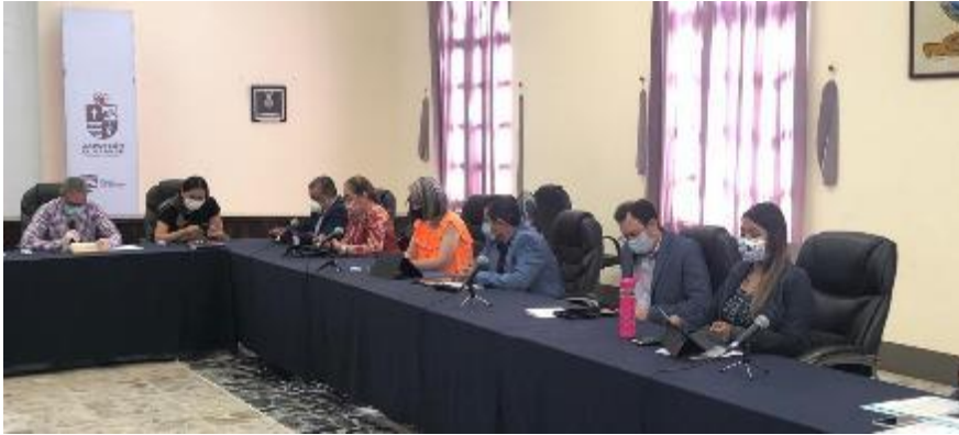
14 DE ABRIL 2020