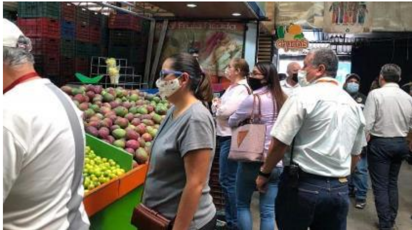
18 DE MAYO 2020