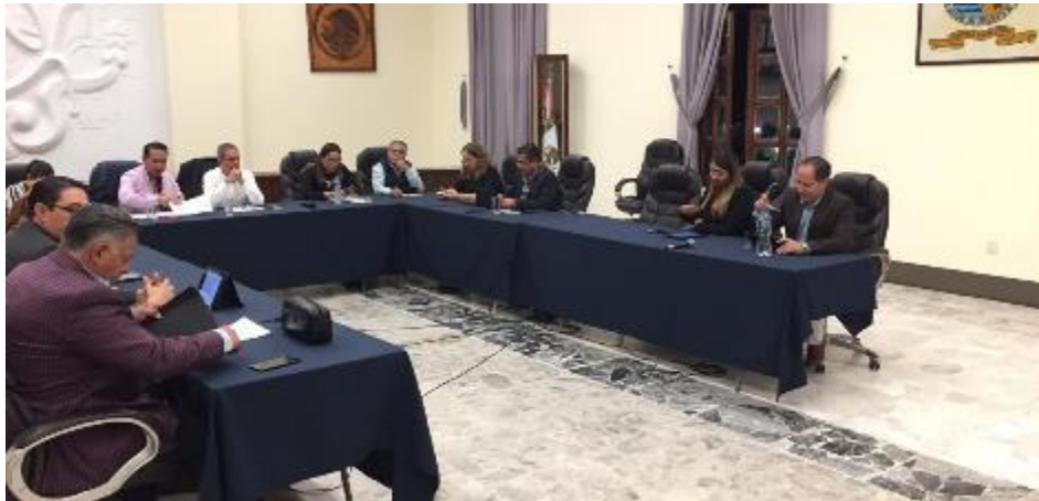
16 DE OCTUBRE 2019