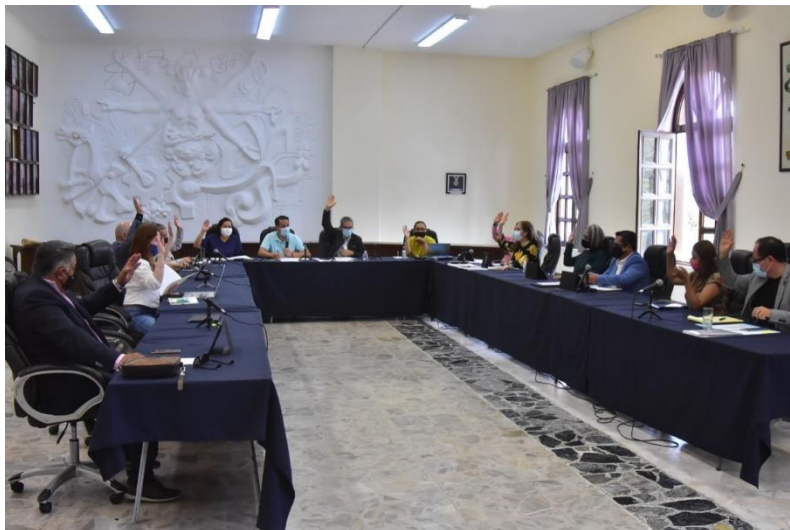
21 DE AGOSTO 2020