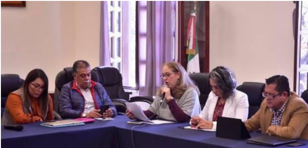
05 DE DICIEMBRE 2019