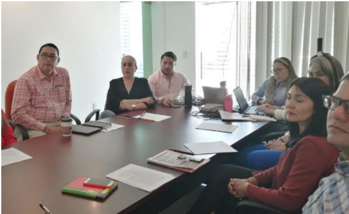
26 DE FEBRERO 2020