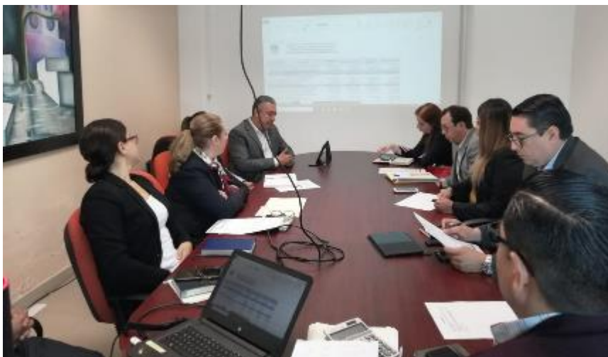
20 DE NOVIEMBRE 2019