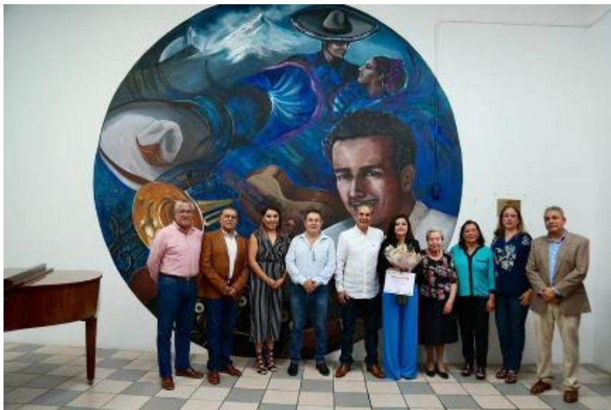
05 DE OCTUBRE 2019