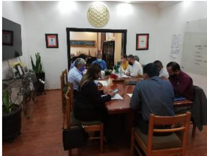
19 DE JUNIO 2020