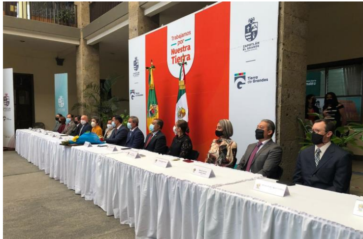
18 DE AGOSTO 2020