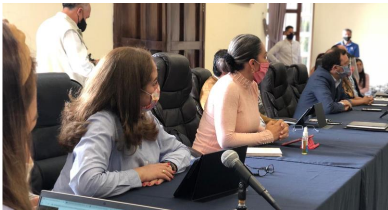
30 DE JULIO 2020