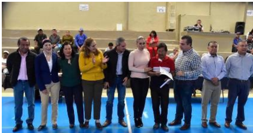
19 DE DICIEMBRE 2019