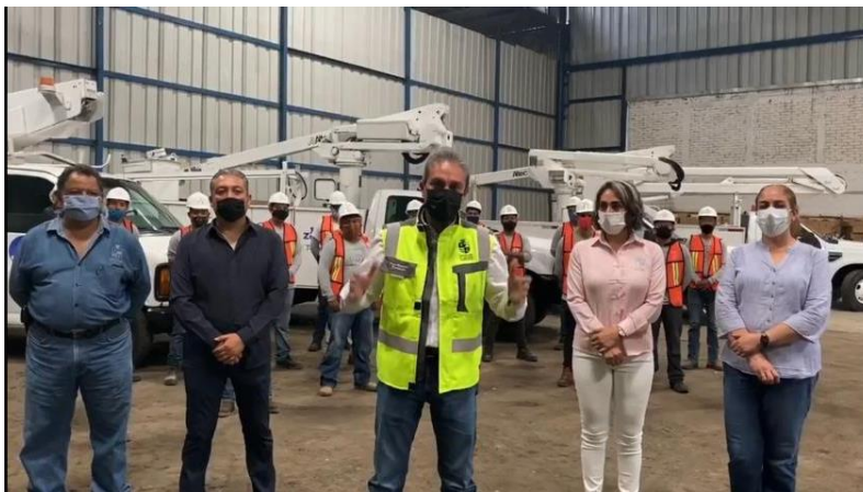
17 DE SEPTIEMBRE 2020