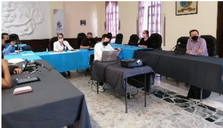
12 DE JUNIO 2020