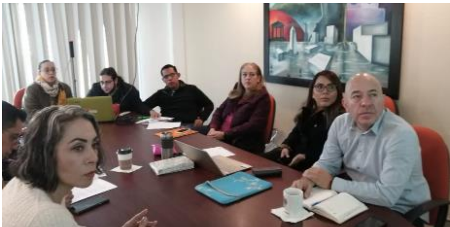
12 DE DICIEMBRE 2019