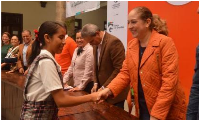
08 DE OCTUBRE 2019