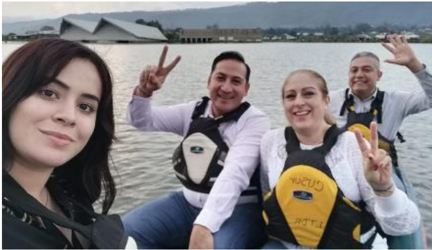
25 DE NOVIEMBRE 2019