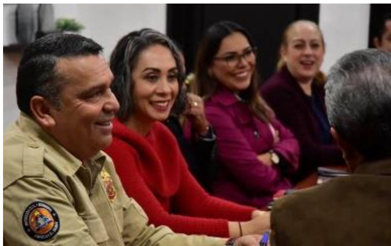
20 ENERO 2020