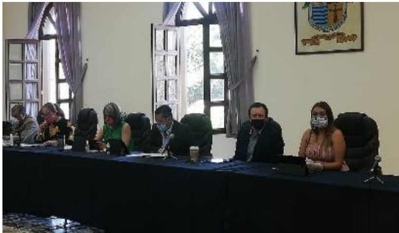
05 MAYO 2020