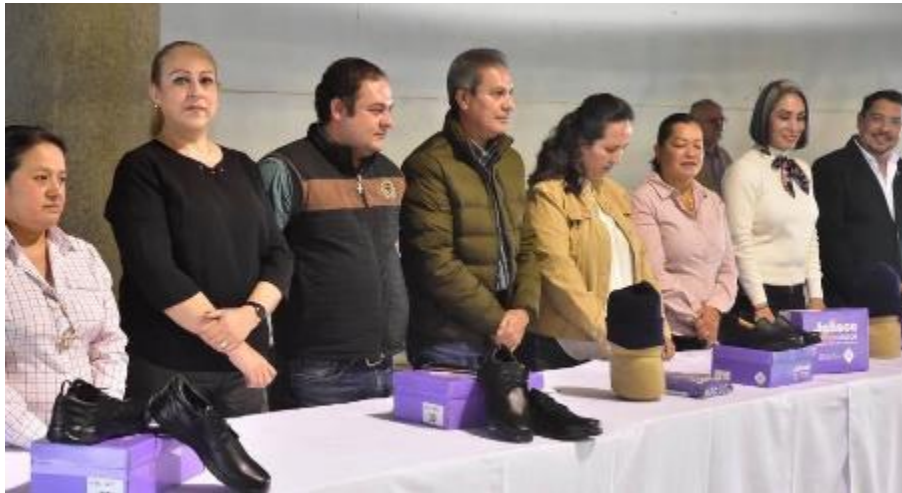
03 DE DICIEMBRE 2019