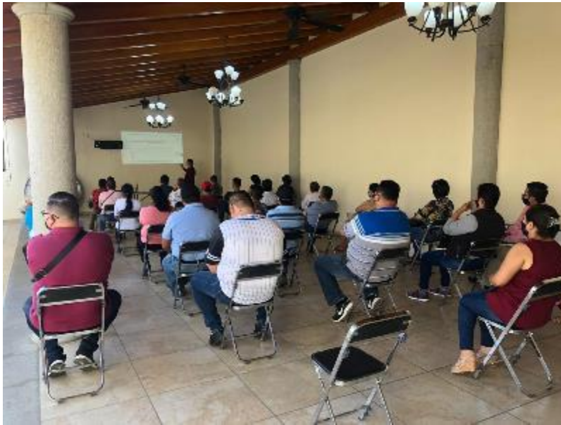
29 DE JUNIO 2020