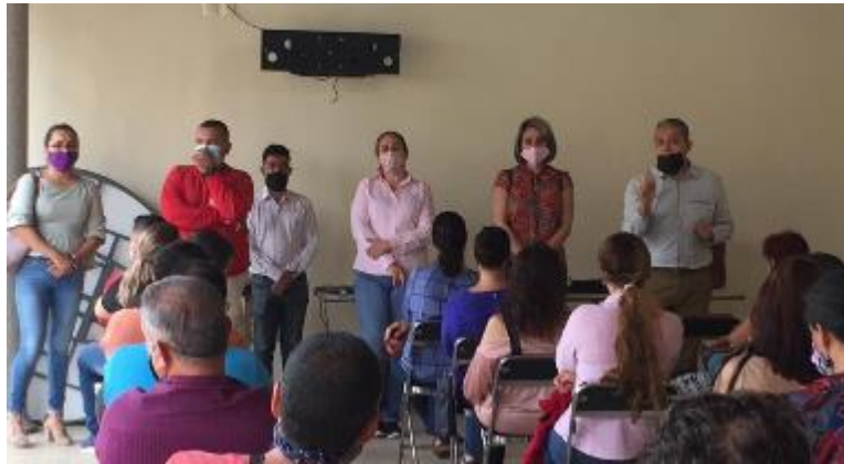
17 DE JUNIO 2020