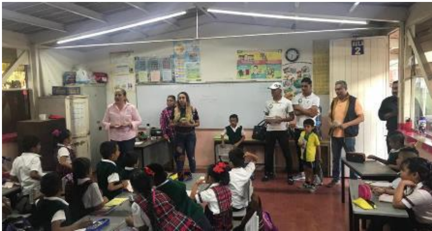
29 DE NOVIEMBRE 2019