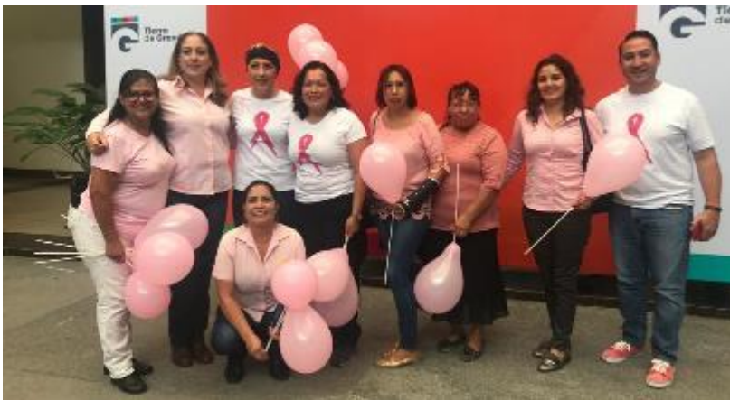
18 DE OCTUBRE 2019