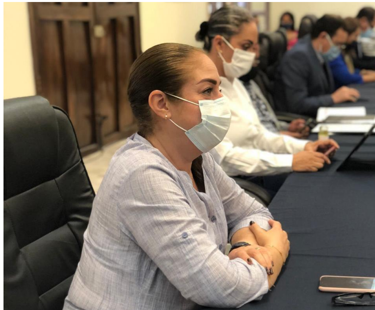
17 DE AGOSTO 2020