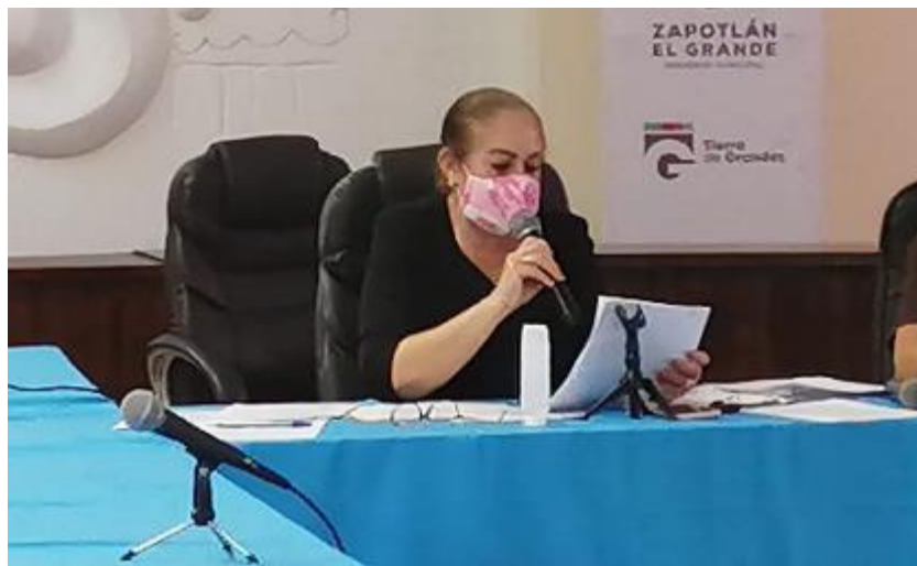
12 DE JUNIO 2020