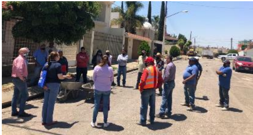
12 DE MAYO 2020