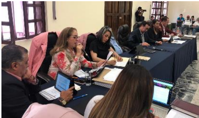
19 DE FEBRERO 2020