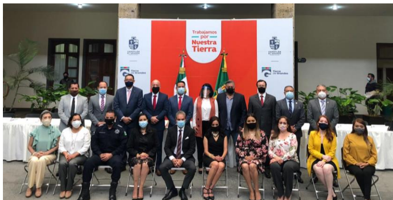
03 DE JULIO 2020