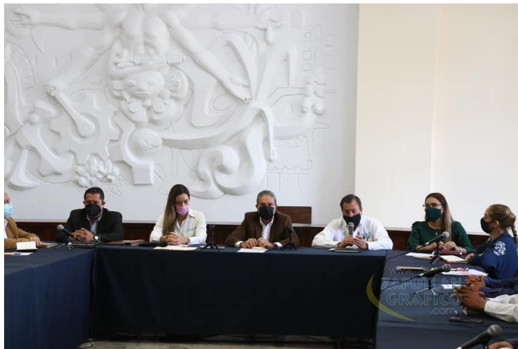
21 DE SEPTIEMBRE 2020