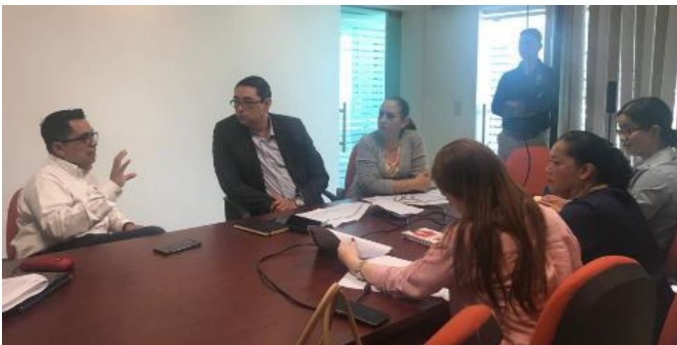
11 DE NOVIEMBRE 2019