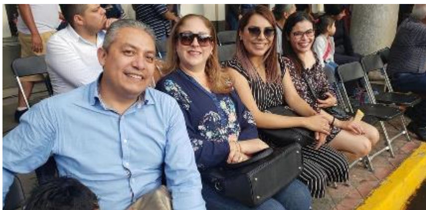
05 DE OCTUBRE 2019