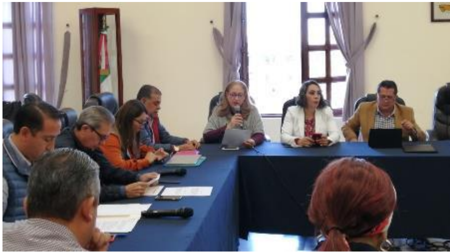
05 DE DICIEMBRE 2019