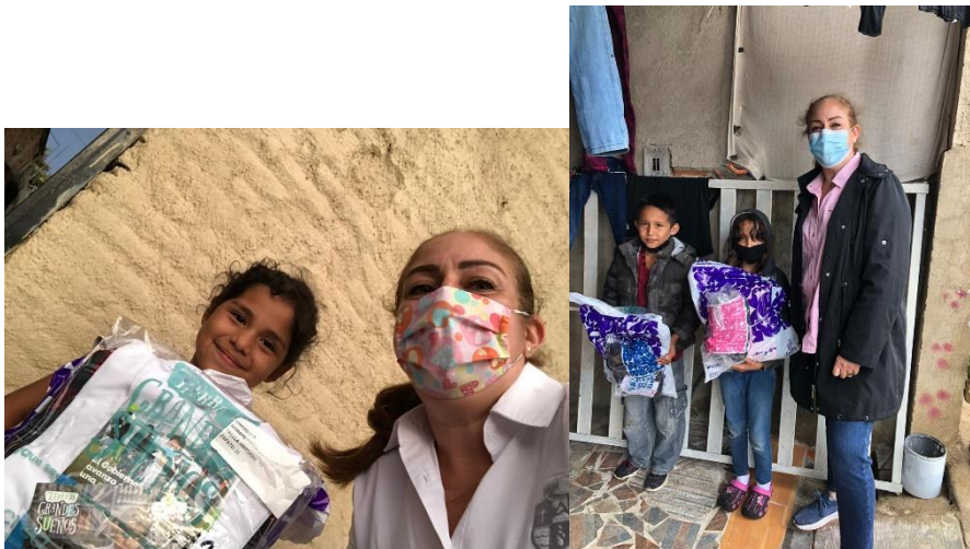
08 DE JULIO AL 09 DE SEPTIEMBRE 2020