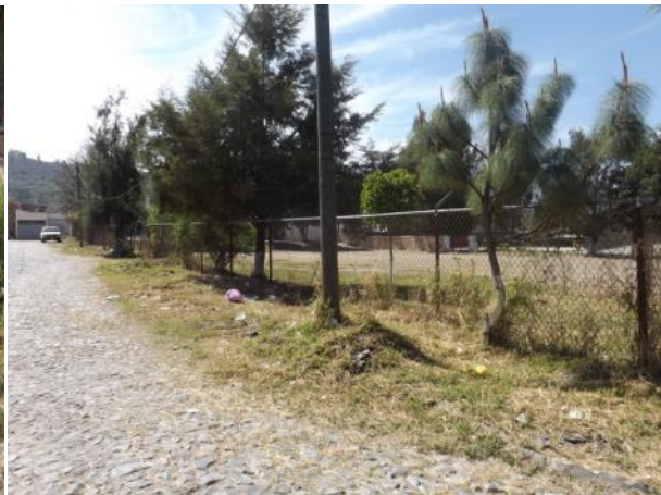
PODA DE PASTO EN LOTE BALDIO EN LA COL. COSTITUYENTES SEC.3 B. CALDERON