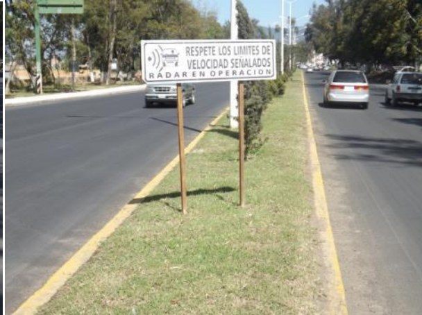
PODA DE PASTO EN EL MONUMENTO A LA SOLIDARIDAD