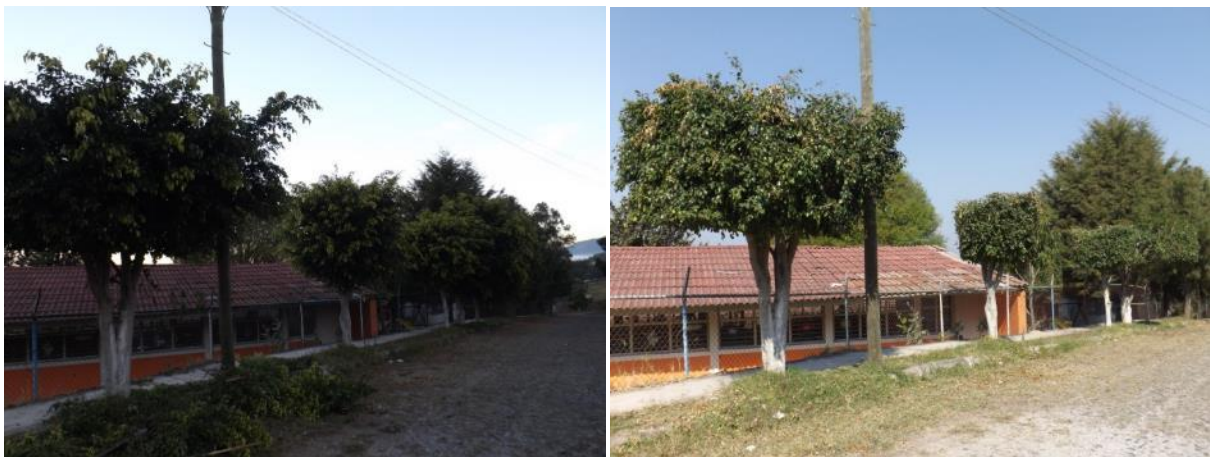
PODA DE ARBOLADO EN LA PRIVADA DE INSURGENTES