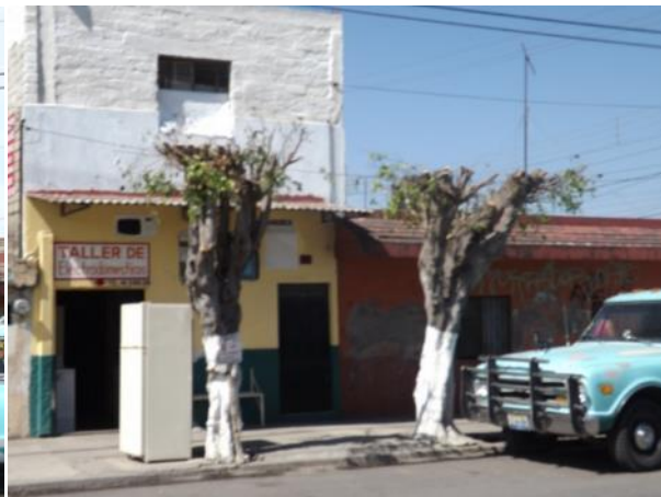
PODADE PASTO EN LATERALES DE LA CALLE GORDOA