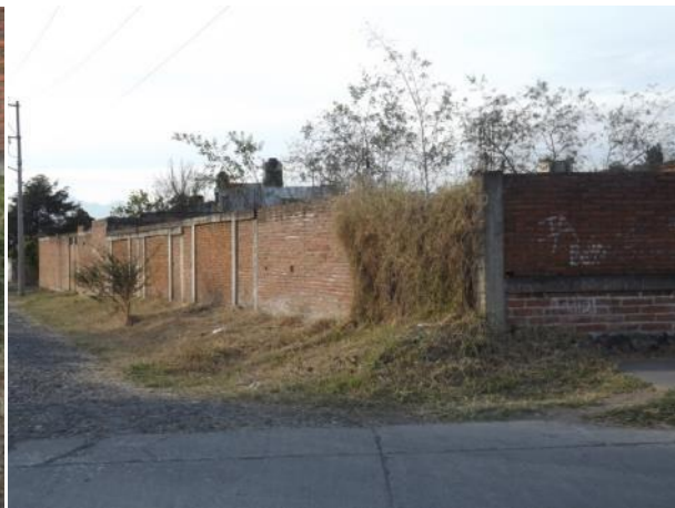
PODA DE PASTO EN LATERALES DE LA AV. SERAFIN VAZQUEZ