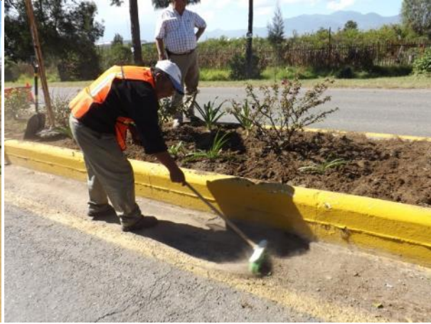
MANTENIMIENTO DE CAMELLON DEL INGRESO NORTE