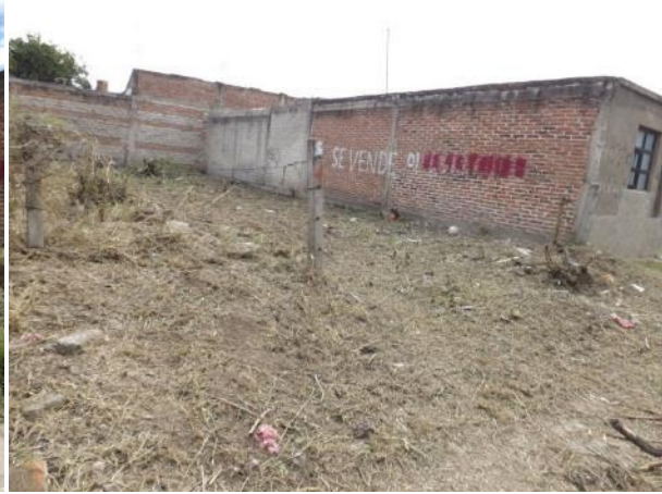
PODA DE MALEZA EN LATERAL DE LA CALLE COMOFORT ESQ. BASILIO VADILLO