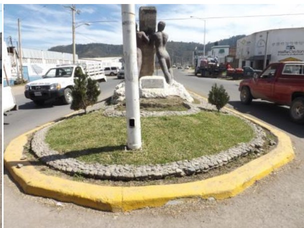
PODA DE MALEZA EN LATERAL DE LA CALLE COMORT ESQ GALEANA