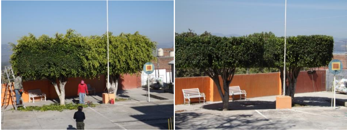
PODA DE ARBOLES EN EL JARDIN DE NIÑOS ALCALDE