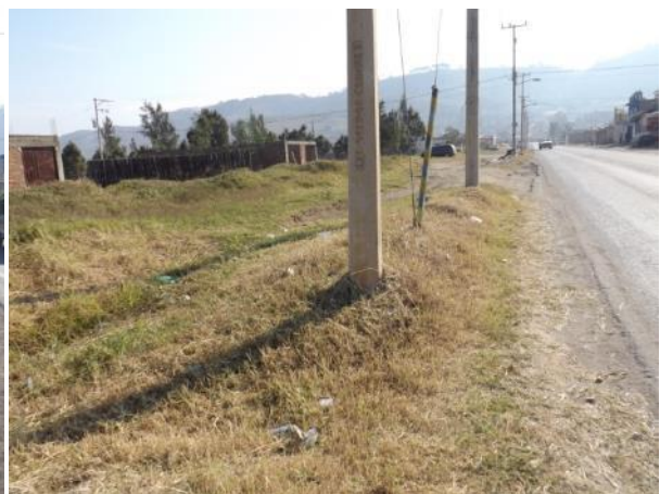
PODA DE PASTO EN EL CAMELON DEL INGRESO SUR