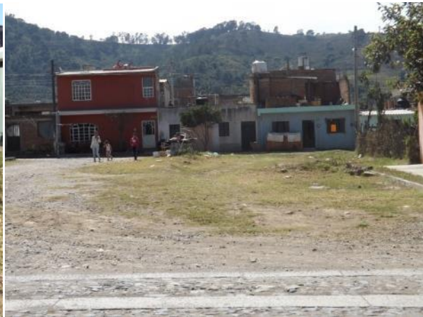
PODA DE PASTO EN LAS CALLES DE LA COL. BUGAMBILIAS