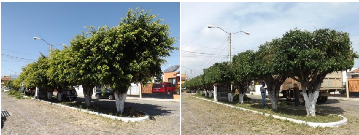
PODA DE ARBOLADO EN EL JARDIN DE NIÑOS CARUSEL COL. COSTITUYENTES