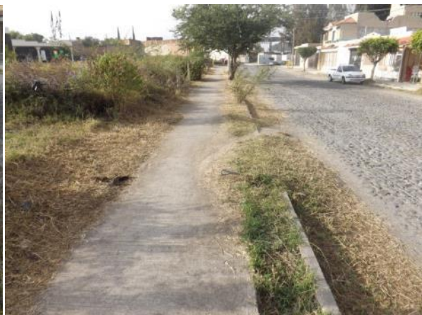
PODA DE MALEZA EN EL LATERAL DE LA CALLE GALEANA