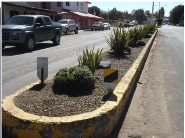
MANTENIMIENTO DE CAMELLON INGRESO NORTE