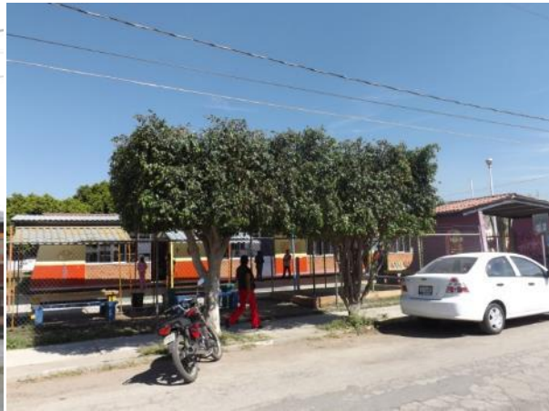
COL. CONSTITUYENTES PODA DE ARBOLES EN EL AREA VERDE EN LA CANCHA