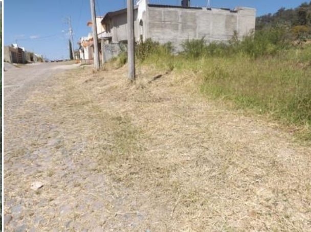
PODA DE PASTO DE LA COLONIA BUGAMBILIAS ESTACIONAMIENTOS