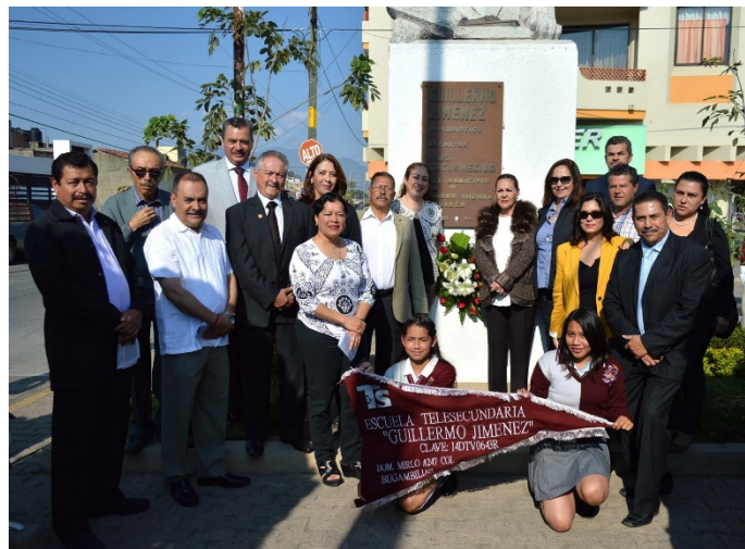
HOMENAJE AL ESCRITOR Y DIPLOMÁTICO GUILLERMO JIMENEZ EN EL ANIVERSARIO DE SU NATALICIO. 09 DE MARZO DE 2017.