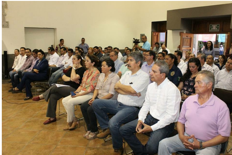
FIRMA DEL CONVENIO DE COLABORACION, AYUNTAMIENTO-INSTITUTO TECNOLÓGICO DE CIUDAD GUZMÁN. 27 DE MARZO DE 2017.