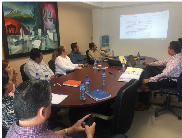
VIGESIMA SEGUNDA SESION ORDINARIA. EMISION DE FALLO LICITACIÓN PÚBLICA 004/2017 “ADQUISICIÓN DE UNIFORMES ESCOLARES DE PREESCOLAR Y PRIMARIA DEL MUNICIPIO DE ZAPOTLÁN EL GRANDE, JAL”. 21 DE MARZO DE 2017.