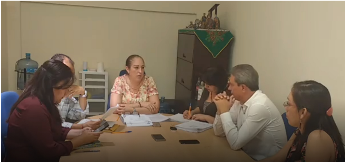
SESION EXTRAORDINARIA, 23 DE MARZO DE 2017.