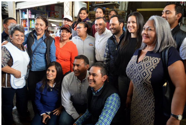
GIRA DE TRABAJO CON DIPUTADOS FEDERALES, TIANGUIS MUNICIPAL.