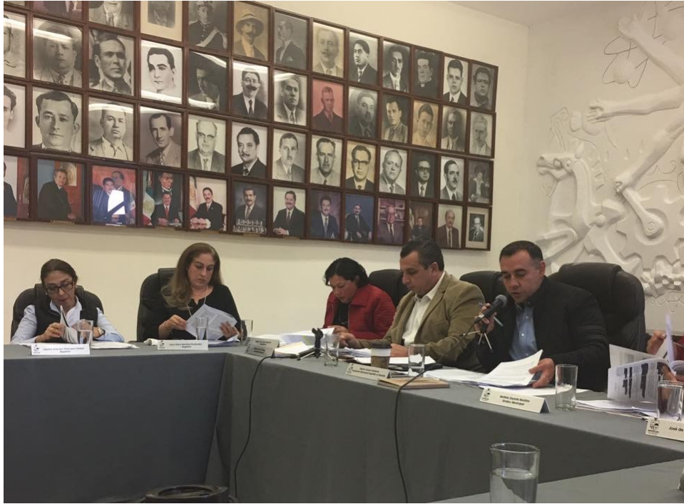
SESION ORDINARIA NO. 13. 26 DE ENERO DE 2017