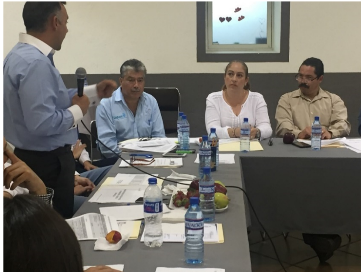
PRIMERA SESION ORDINARIA 21 DE MARZO DE 2017.