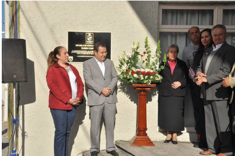
ANIVERSARIO DEL NATALICIO DE RUBÉN FUENTES GASSON. 15 DE FEBRERO DE 2017.