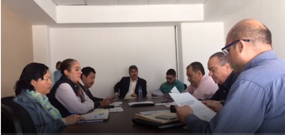
QUINTA SESION ORDINARIA, 23 DE FEBRERO DE 2017