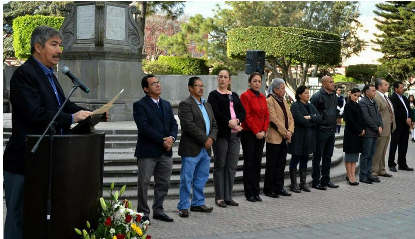
193 ANIVERSARIO DE LA APROBACIÓN DEL ACTA CONSTITUTIVA DE LA FEDERACIÓN MEXICANA (1824).