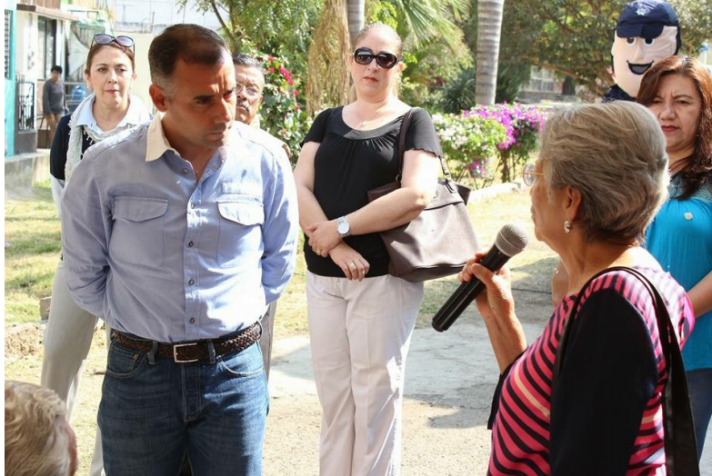
INAUGURACION DE LA CASETA DE POLICIA EN LA COLONIA JARDINES DE ZAPOTLÁN. 07 DE MARZO DE 2017.