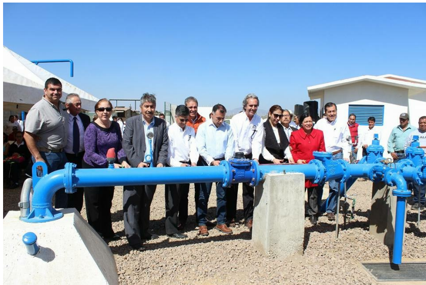
INAUGURACION DE POZO DE AGUA 27 DE ENERO DE 2017.