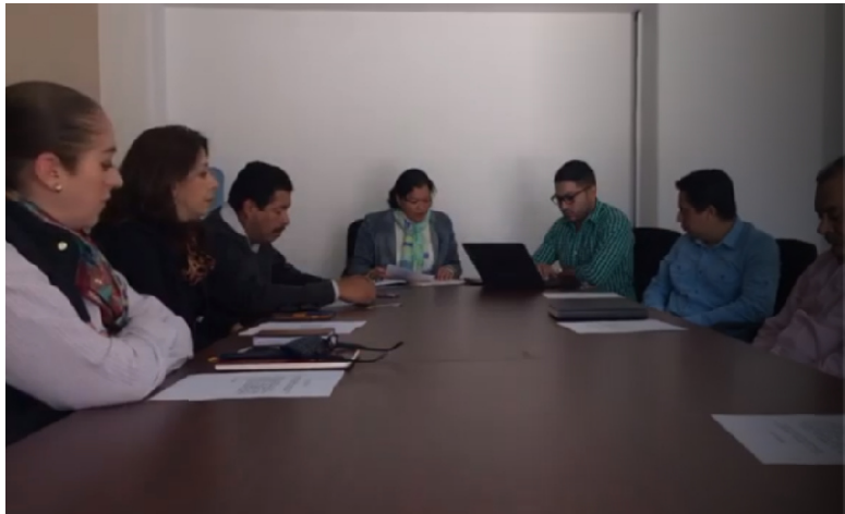
SESION ORDINARIA 23 DE FEBRERO DE 2017.

SESIONES DE COMISION COMO COADYUVANTE, CONVOCA LA COMISI3N EDILICIA DE AGUA POTABLE