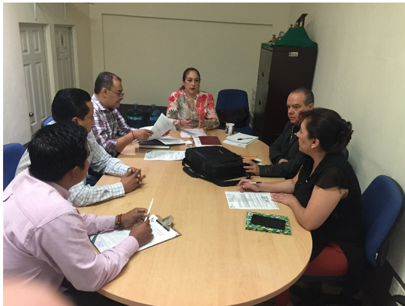
SESION ORDINARIA. 30 DE MARZO DE 2017.