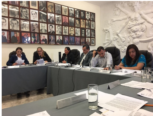
SESION EXTRAORDINARIA NO. 29