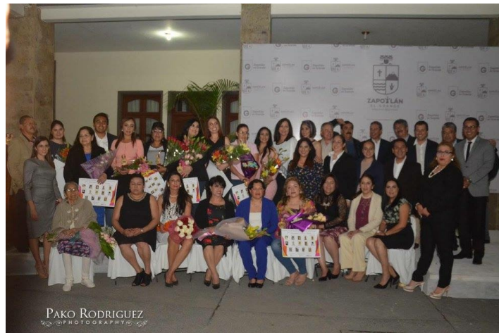
ENTREGA DE LOS PREMIOS A LA MUJER EN EL MARCO DE LA CONMEMORACIÓN DEL DÍA INTERNACIONAL DE LA MUJER. 08 DE MARZO DE 2017.