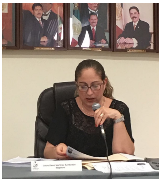
SESION EXTRAORDINARIA NO. 31.