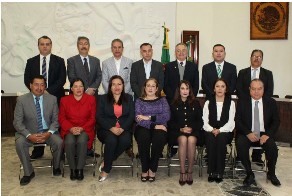
SESION SOLEMNE NO. 08. 27 DE ENERO 2017.