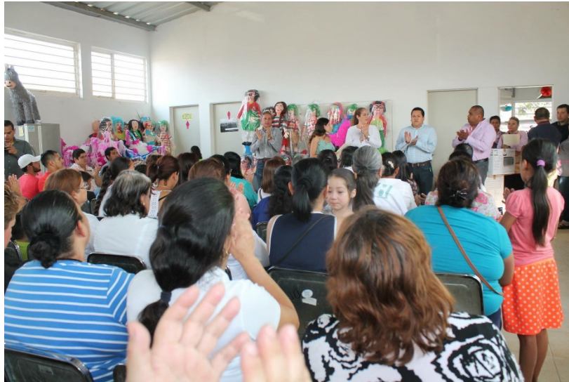
CLAUSURA DE LOS TALLERES DE LA VERTIENTE PARA EL HABITAT 2016 E INAUGURACIÓN DE LA AMPLIACIÓN Y EQUIPAMIENTO DE LA COCINA Y EL CENTRO DE COMPUTO EN EL CENTRO DE DESARROLLO COMUNITARIO DE LA COLONIA TEOCALLI. 21 DE MARZO DE 2017.