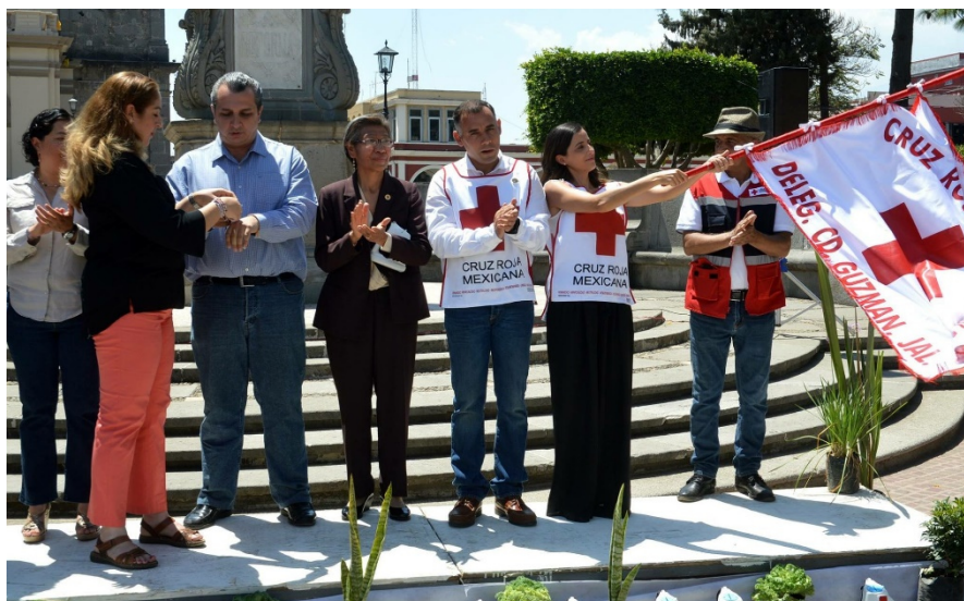
ARRANQUE DE LA COLECTA ANUAL DE LA CRUZ ROJA MEXICANA DELEGACIÓN CIUDAD GUZMÁN. 20 DE MARZO DE 2017