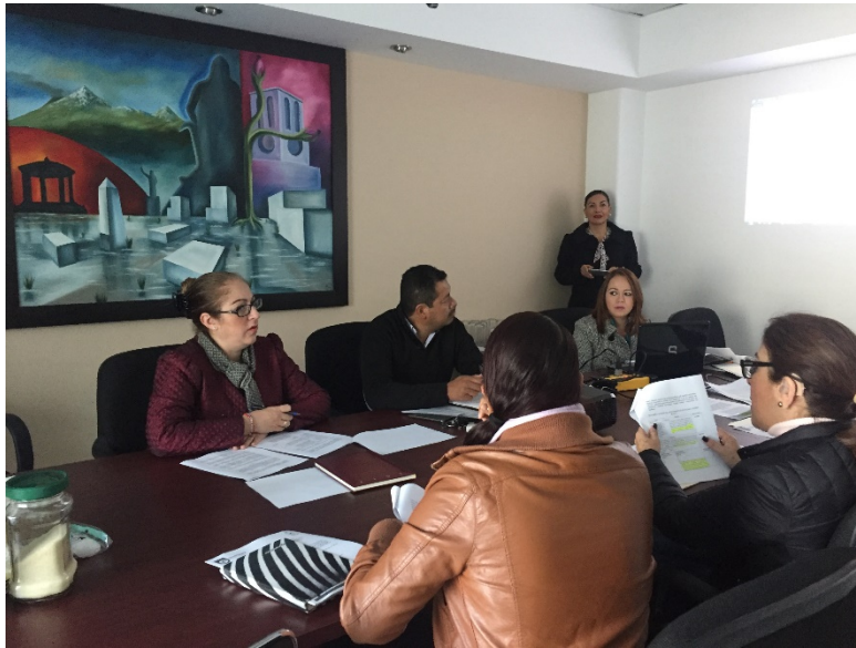
SESIÓN ORDINARIA DEL 11 DE ENERO DE 2017.