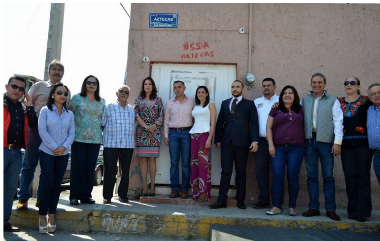
INICIO DE LA PRIMERA ETAPA DEL PROGRAMA DE PLACAS DE NOMENCLATURA 2015-2018.02 DE MARZO DE 2017.