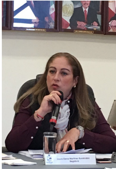
SESION ORDINARIA NO. 14