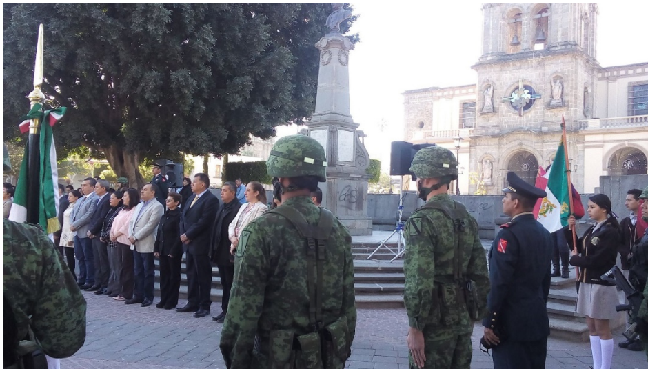
ANIVERSARIO DEL DIA DE LA BANDERA NACIONAL. 24 DE FEBRERO DE 2017.