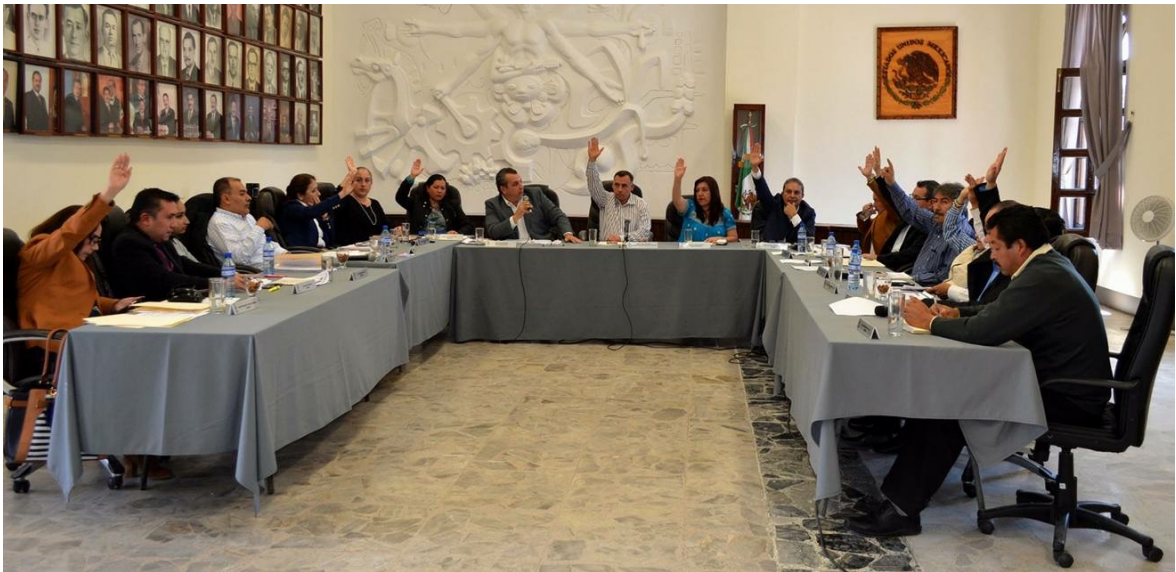
SESION EXTRAORDINARIA NO. 29. 28 DE FEBRERO DE 2017.