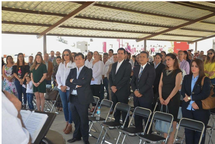
INAUGURACIÓN DEL FRACCIONAMIENTO CAMICHINES II. 01 DE MARZO DE 2017.