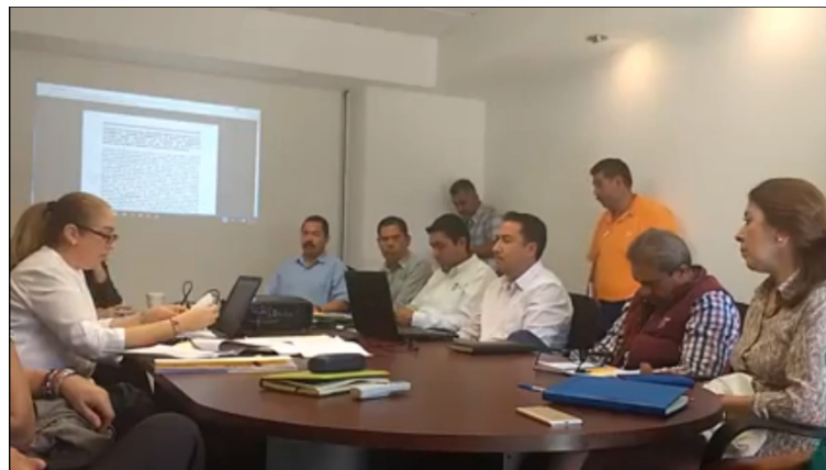
SESION EXTRAORDINARIA, 27 DE FEBRERO DE 2017.