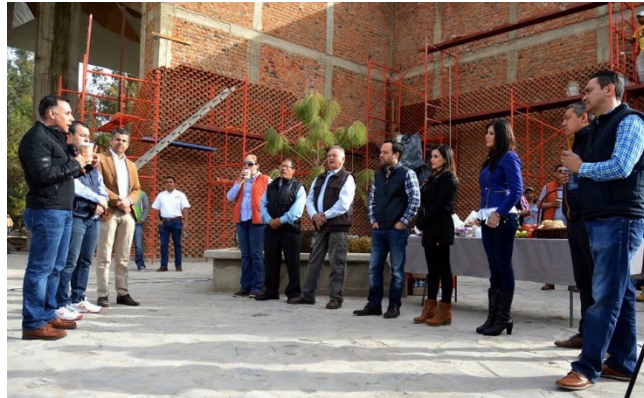
GIRA DE TRABAJO CON DIPUTADOS FEDERALES, CENTRO DE CULTURA JOSE ROLON