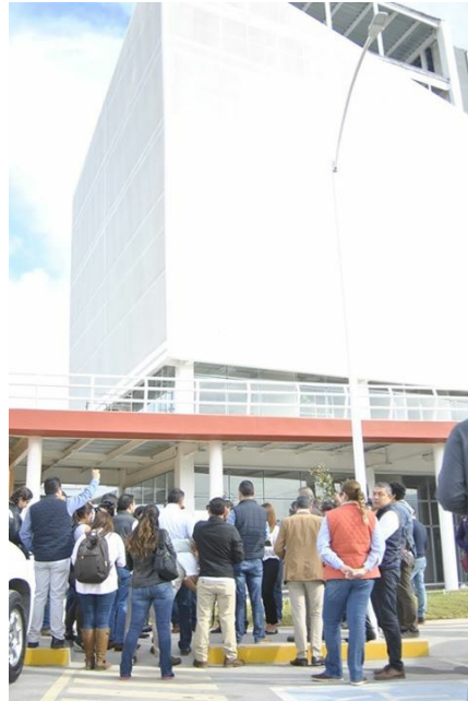
GIRA DE TRABAJO CON DIPUTADOS FEDERALES, AGRO-CENTER.