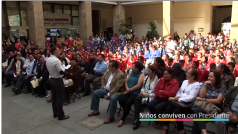
ENTREGA DE RECURSOS DEL PROGRAMA "DOMOS PROTECTORES PARA LA ACTIVACIÓN FÍSICA EN ESCUELAS DE ZAPOTLÁN". 01 DE MARZO DE 2017.