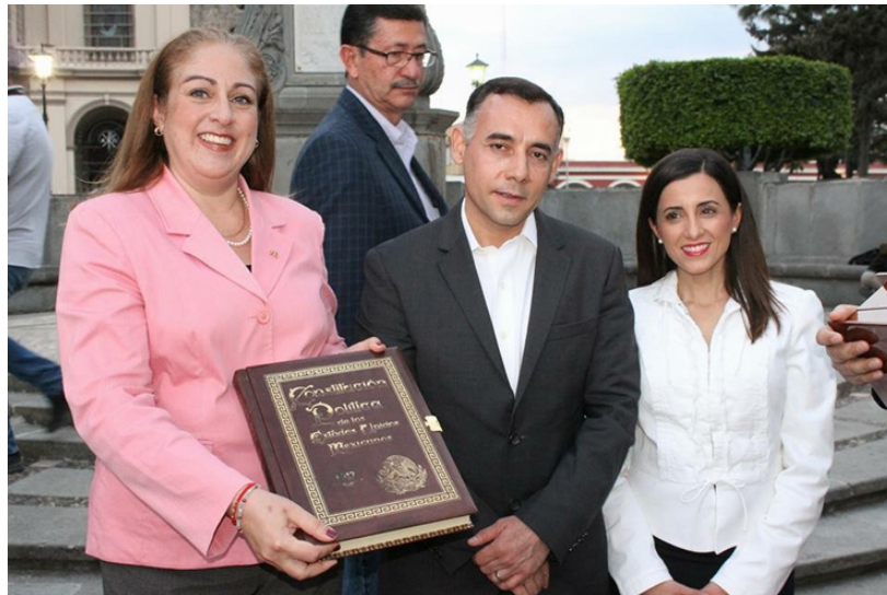
ANIVERSARIO DE LA PROMULGACIÓN DE LAS CONSTITUCIONES DE 1857 Y 1917