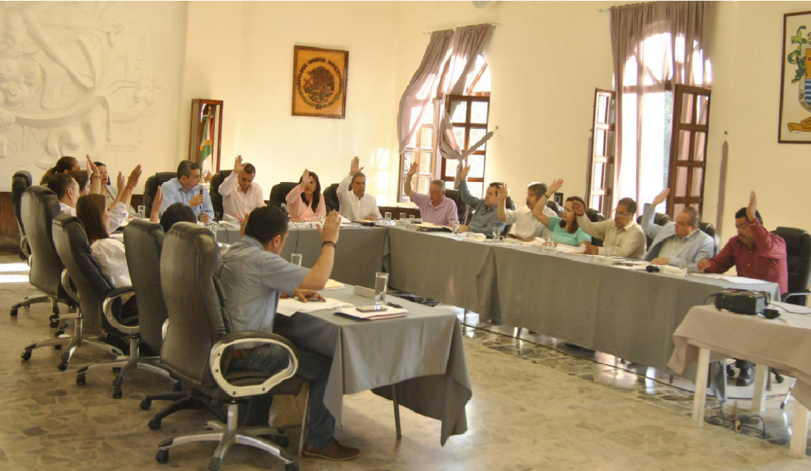
SESION EXTRAORDINARIA NO. 30 Y NO. 31. 27 DE MARZO DE 2017