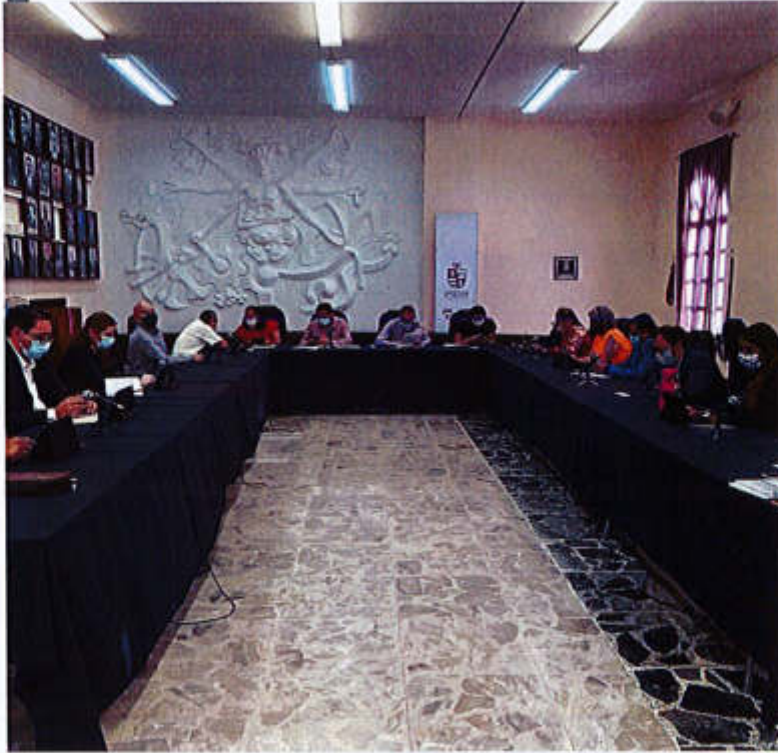
14 DE ABRIL 2020.