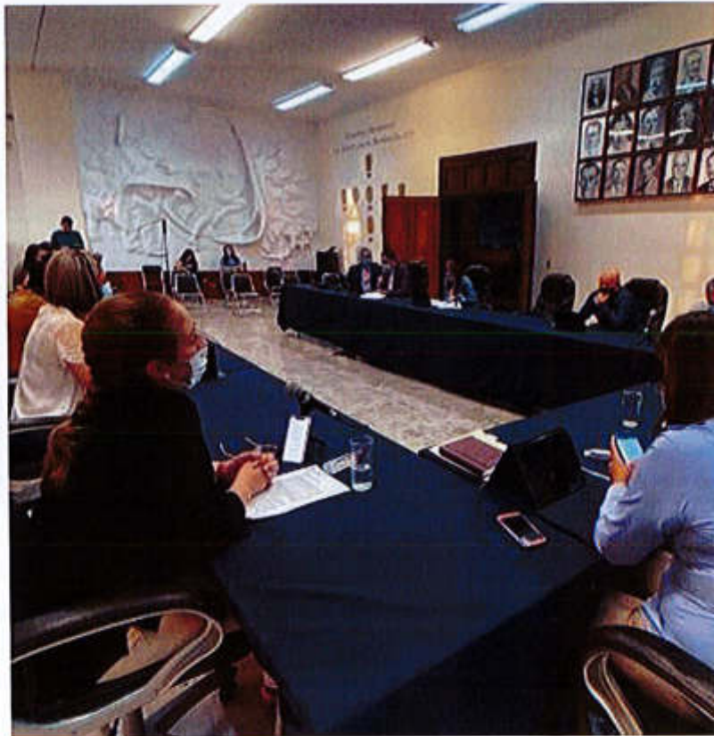
08 DE ABRIL 2020.