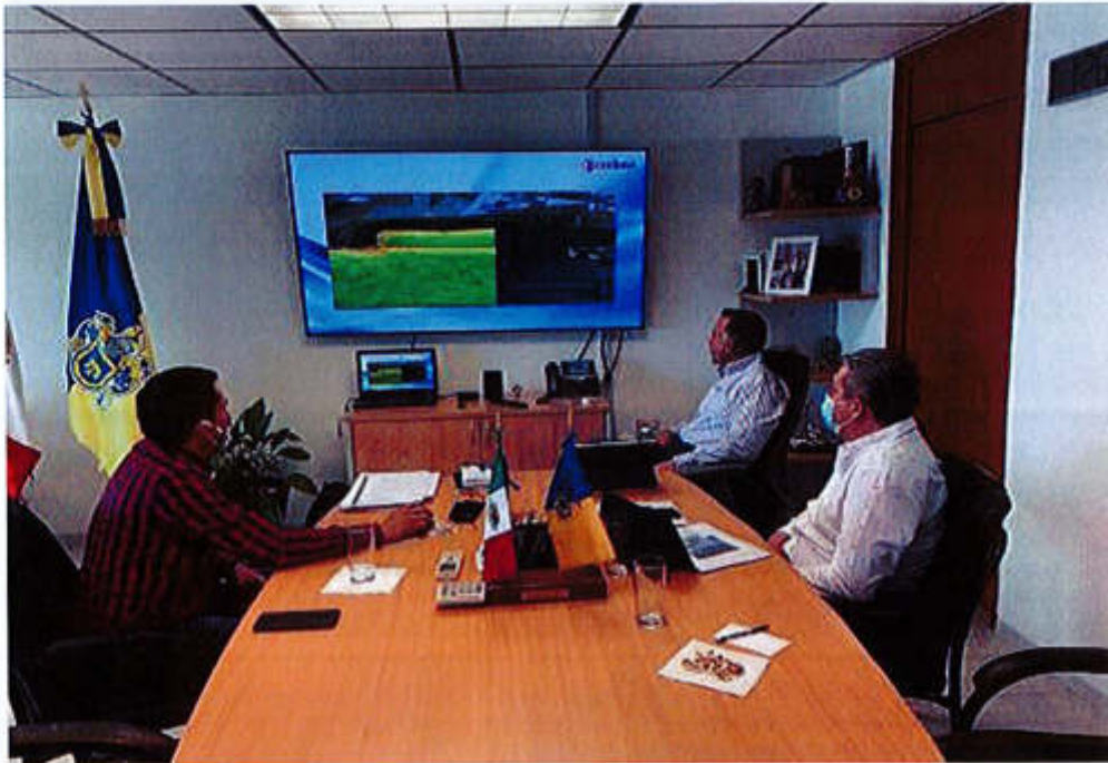
01 DE JUNIO 2020.