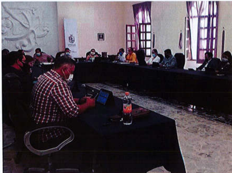
15 DE MAYO 2020.