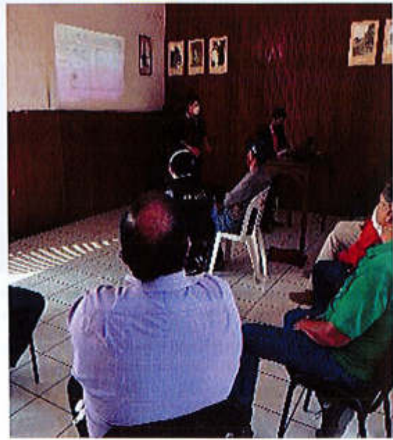
03 DE JUNIO 2020.

Av. Cristóbal Colón #62, Centro Histórico CP 49000, Cd. Guzmán, Zapotlán el Grande, Jal. Tel: (341) 575 2500 www.ciudadguzman.gob.mx