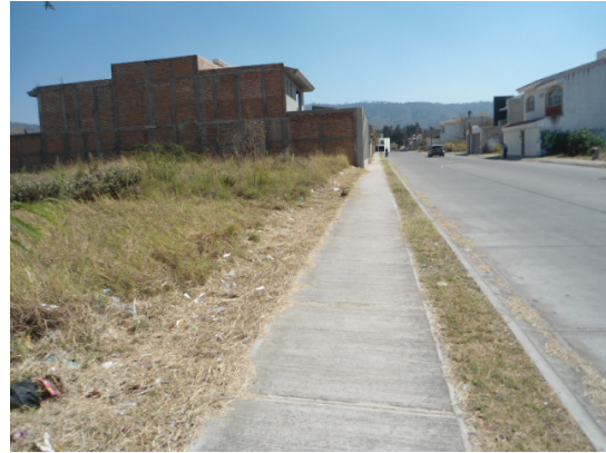
Limpieza de matorrales en costados de la Laguna de Zapotlán.