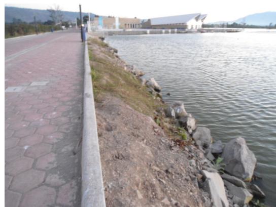
Limpieza de adoquín en área de la Laguna de Zapotlán.