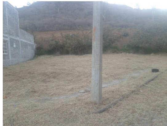
Limpieza de lote en calle Pino esquina Sauce, Colonia San Pedro.