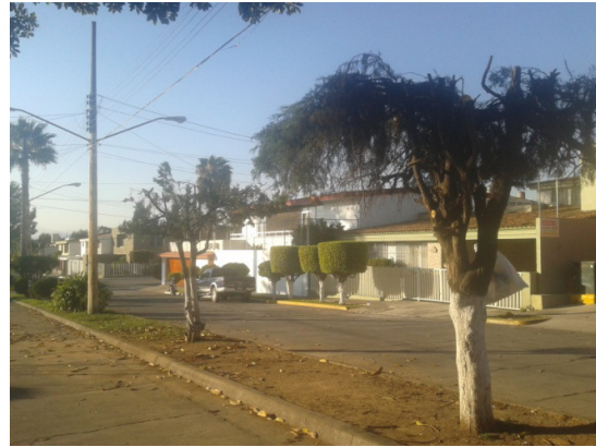
Poda con tijera de camellón en avenida Manuel M. Diéguez.