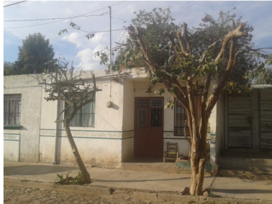
Poda de árbol con tijera en “Plaza San Luis”, Colonia Constituyentes.