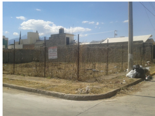
Limpieza de banquetas de calle Ramón Corona.