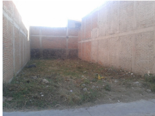
Limpeza de banquetas en calle Marcos Gordo, Colonia Centro.