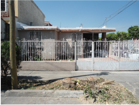
Poda de pasto en Colonia La Providencia.