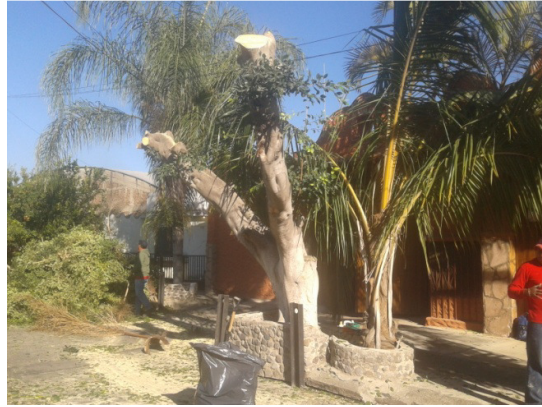
Poda en Agustín Yáñez No. 12 Colonia Jalisco (antes Provipo).