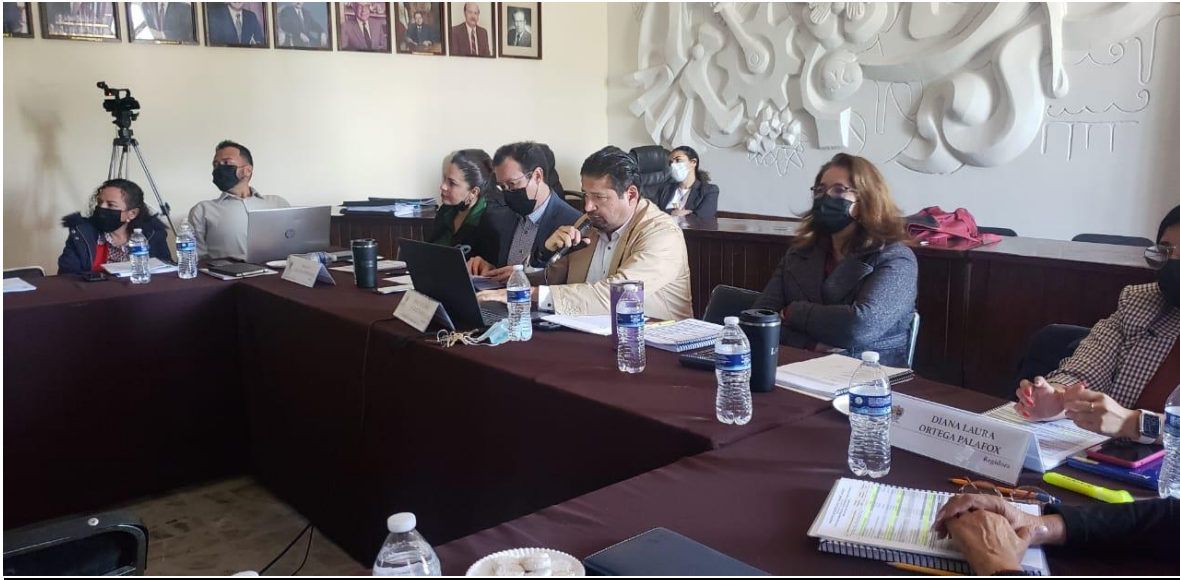
Sesión Extraordinaria No. 1.