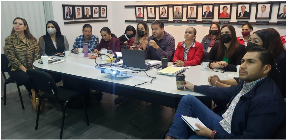
Sesión Extraordinaria No. 3.