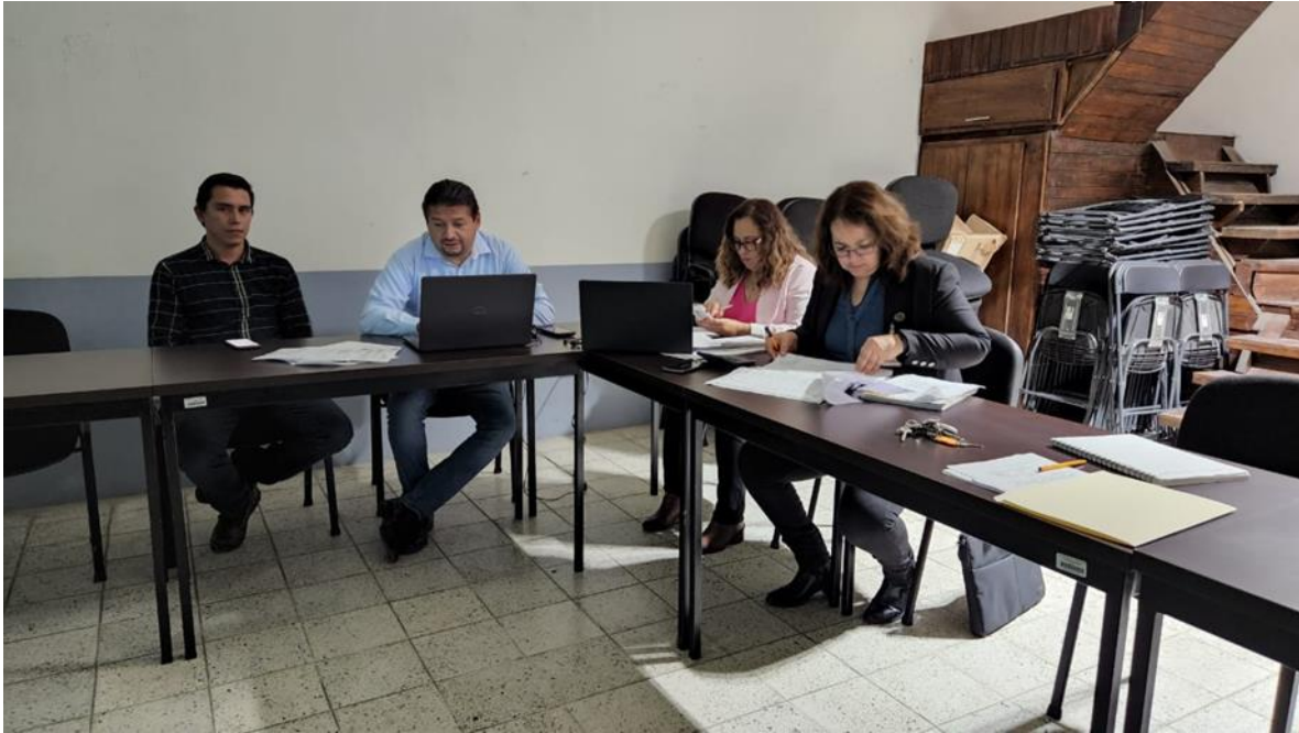
Sesión Extraordinaria No. 4.